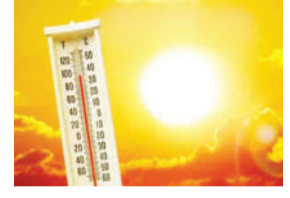
સુધી રાજ્યના અનેક જિલ્લાઓમાં હિટવેવની શક્યતાઓ છે. દક્ષિણ ગુજરાતના સુરત, વલસાડ, સૌરાષ્ટ્રના પોરબંદર, જુનાગઢ, ગીર સોમનાથ, કચ્છ, રાજકોટ, અમરેલી તથા ઉત્તર ગુજરાતમાં બનાસકાંઠા, પાટણ, સાબરકાંઠા તથા ગાંધીનગર અને અમદાવાદ જિલ્લામાં યેલો એલર્ટ જાહેર કરાયું છે.

અમદાવાદ, તા.૨૪ રાજ્યમાં ફરી એકવાર અંગ દગ્ગડતી ગરમી જોવા મળશે. હવામાન વિભાગે આગામી ચાર દિવસ સુધી રાજ્યના અનેક જિલ્લાઓમાં હિટવેવની આગાહી કરી છે. આ જિલ્લાઓમાં તાપમાનનો પારો ૪૨ ડિગ્રી સુધી રહી શકે છે. શનિવારે અમદાવાદ સહિત ૪ શહેરોમાં ગરમીનો પારો ૪૨ ડિગ્રી અને ૫ શહેરોમાં ૪૧ ડિગ્રી પાર કરી ગયો હતો. હવામાન વિભાગના જણાવ્યા મુજબ, આગામી ૨૮મી એપ્રિલ