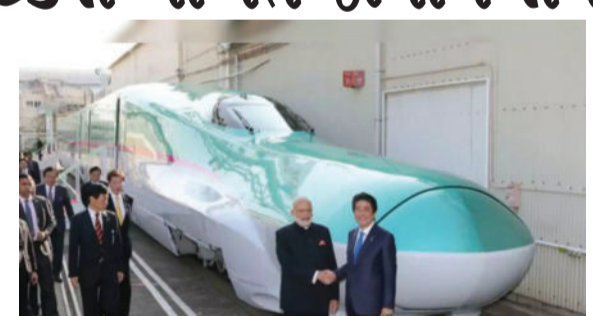
કે આ ટેક્સ બુલેટ ટ્રેન પ્રોજેક્ટસની ડિઝાઈન સાથે જોડાયેલા કામ સંભાળી રહેલા કન્સલ્ટન્ટ્સ પર લાગવો જોઈએ નહીં. અંગ્રેજી અખબારના અહેવાલ પ્રમાણે, જાપાને કહ્યું છે કે ભારત સરકારે આ કન્સલ્ટન્ટને મળનારી ફી અને અન્ય ખર્ચાઓ પર ઈન્કમેટેક્સ લગાવવો જોઈએ નહીં. એટલું જ નહીં આ મુદ્દા વણકેટ્યા રહેવાની

(એ.આર.એલ), નવીદિલ્હી, તા. ૨૪ મુંબઈથી અમદાવાદ વચ્ચેનું અંતર ઓછું કરવા માટે દોડનારી બુલેટ ટ્રેનના પ્રોજેક્ટમાં નવી અડચણ આવી છે. જમીન સંપાદન અને પર્યાવરણ સાથે જોડાયેલી ચિંતાઓને દૂર કર્યા બાદ હવે ઈન્કમેટેક્સનો મામલો ઉભો થઈ ગયો છે. જાપાને આ પ્રોજેક્ટમાં લાગેલા પોતાના એન્જિનિયરોની કમાણી પર લાગનારા ઈન્કમેટેક્સને લઈને સવાલો ઉઠાવ્યા છે. જાપાને કહ્યું છે