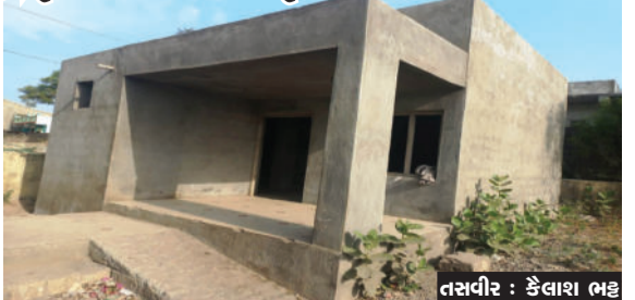
ઓરડાઓના કારણે આવવા તત્વો અહીં દારૂની મહેફિલો જમાવતા હોય તેમ દારૂની કોથળીઓ જોવા મળતા ગ્રામજનોમાં ભારે આકોશ ફેલાયો છે. ત્યારે તંત્ર દ્વારા સત્વરે આંગણવાડી રૂમના બારી-દરવાજા તાત્કાલિક ફીટ કરી બાળકોના હિતમાં અભ્યાસ શરૂ કરવામાં આવે તેવી ગ્રામજનોમાંથી ઉગ્ર માંગ ઉઠવા પામી છે.

ઉના, તા. ૨૪ ઉનાના સામતેર ગામે આવેલ આંગણવાડી કેન્દ્ર નં. ૧નું છેલ્લા ૮ માસથી બારી-દરવાજા અને કલરના વાંકે ઓરડાનું કામ અધૂરું રહેતા હાલ આ ઓરડા દેશી દારૂનો અડો બની ગયા હોય તેમ દારૂની કોથળીઓ જોવા મળી રહી છે. આંગણવાડીની અધુરી કામગીરીને લઈ ગ્રામજનો દ્વારા અનેકવાર મૌખિક રજૂઆત કરાઈ હોવા છતાં આજ સુધી કોઈ કામગીરી કરવામાં આવી નથી. ખુલ્લા