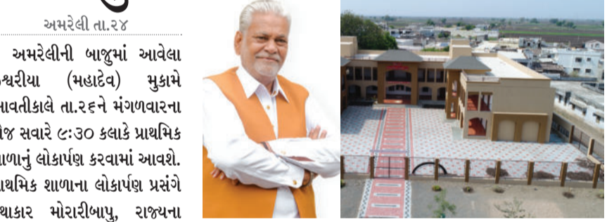
અમરેલી તા.૨૪ અમરેલીની બાજુમાં આવેલા ઈશ્વરીયા (મહાદેવ) મુકામે આવતીકાલે તા.૨૬ને મંગળવારના રોજ સવારે ૯:૩૦ કલાકે પ્રાથમિક શાળાનું લોકાર્પણ કરવામાં આવશે. પ્રાથમિક શાળાના લોકાર્પણ પ્રસંગે કથાકાર મોરારીબાપુ, રાજ્યના મુખ્યમંત્રી ભૂપેન્દ્રભાઈ પટેલ તેમજ સાંસદ હેમામાલિની ઉપસ્થિત રહેશે.