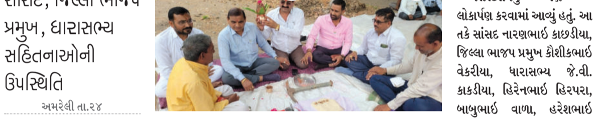
સાંસદ, જિલ્લા ભાજપ પ્રમુખ, ધારાસભ્ય સહિતનાઓની ઉપસ્થિતિ અમરેલી તા.૨૪ ધારી તાલુકાના સમઠીયાળા ગામે વાસ્મો યોજનાના કામોનું ખાતમુહૂર્ત કરવામાં આવ્યું હતું. આ યોજનાના કારણે ગ્રામજનોને