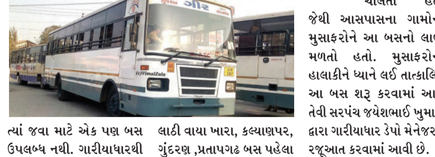
અમરેલી તા.૨૪ લાઈ તાલુકાનું શાખપુર ગામ અમરેલી જિલ્લાનું છેવાડાનું ગામ હોય આ ગામમાં એસટીની અપૂરતી સેવાને કારણે ગ્રામજનો ભારે મુશ્કેલીનો સામનો કરી રહ્યા છે. શાખપુર ગામથી લાઈ વચ્ચે ૩૦ કિલોમીટરનું અંતર હોય પરંતુ ત્યાં જવા માટે એક પણ બસ ઉપલબ્ધ નથી. ગારીયાધારથી લાઈ વાયા ખારા, કલ્યાણપર, ગુંદરણ, પ્રતાપગઢ બસ પહેલા