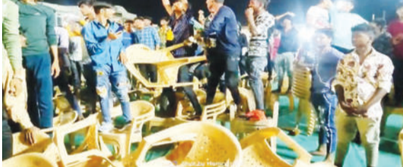
દવેના ડાયરાનું આયોજન કરાયું હતું, કિંજલ દવેના ગીત ચાલુ થતાં કેટલાક અસામાજિક તત્વોએ રીતસરની કાર્યક્રમમાં પ્લાસ્ટિકની ખુરશીઓ ઉછળી હતી અને કાર્યક્રમની મજા બગાડવાનો પ્રયાસ કર્યો હતો. આ લોકો કોણ હતા અને ક્યાંથી આવ્યા તે અંગે હજી કોઈ માહિતી મળી નથી. સમગ્ર મામલે કોઈ કાર્યવાહી કરવામાં આવી છે કે કેમ તે અંગે પણ હજી કોઈ માહિતી સામે આવી નથી.

(સં.સ.સે.) પાટણ, તા.૨૪ રાધનપુર ખાતે લોકગાયિકા કિંજલ દવેનો સંગીતનો કાર્યક્રમ યોજાયો હતો. જેમાં કિંજલ પર ચલણી નોટો વરસાદ તો થયો પરંતુ અહીં કેટલાક ચાહકો તો એવા ઝૂમી ઉઠ્યા કે પડાપડી કરવા લાગ્યા હતા. ખુરશીઓ ઉછળતા કેટલીક તો તૂટી પણ ગઈ હતી. યુવાનોએ ખુરશીઓ ઉછળાવતા અફરાતફરી પણ મચી ગઈ હતી. જેનો વિડીયો હાલ સોશિયલ મીડિયામાં વાયરલ થઈ રહ્યો છે. રાધનપુરમાં કિંજલ