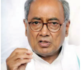
શું આ જુમ નથી, કાનૂની સલાહ લઈ હું જે ભાજપ નેતાઓએ તેને પ્રસારિત કર્યા છે તેમની વિરુદ્ધ એફઆઈઆર પણ કરાવીશ અને માનહાનિનો દાવો પણ કરાવીશ.

(એ.આર.એલ), ભોપાલ, તા. ૨૪ મધ્યપ્રદેશના પૂર્વ મુખ્યમંત્રી દિગ્વિજય સિંહે ટૂંક સમયમાં લખ્યું છે કે જે ભાજપ નેતાઓ સોશિયલ મીડિયા પર કોંગ્રેસ નેતાઓના એડિટેડ વીડિયો દેશભરમાં વાયરલ કરે છે એવા નેતાઓની વિરુદ્ધ તે તાકિદે એફઆઈઆર દાખલ કરાવશે. દિગ્વિજય સિંહે ટૂંક સમયમાં આગળ લખ્યું છે કે ભાજપ અમારા નિવેદનોને એડિટ કરી બદનામ કરે છે આ તેનું જવલંત ઉદાહરણ છે