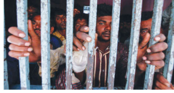
સંસ્થા એનઆઈએએ પાકિસ્તાન દ્વારા ભારતમાં અશાંતિ ફેલાવવાના વધુ એક કાવતરાંનો ઘટસ્ફોટ કર્યો છે ત્યારે રાજ્યકક્ષાના વિદેશ મંત્રી વી. સુરવીધરને તાજેતરમાં સંસદમાં જણાવ્યું હતું કે, દુનિયામાં ૮૨ દેશોમાં ૮,૦૦૦થી વધુ ભારતીય નાગરિકો કેદ છે,વિદેશની જેલોમાં

(એ.આર.એલ) નવીદિલ્હી,તા.૨૪ પાકિસ્તાનની સમુદ્રી સંસ્થા પાકિસ્તાન મેરીટાઈમ સિક્યોરિટી એજન્સી (પીએમએસએ) આંતરરાષ્ટ્રીય જળસીમામાં માછલી પકડવા જતાં ગુજરાતના માછીમારોની ગેરકાયદે ધરપકડ કરીને તેમની જેલોમાં ગોંધી રાખે છે. ભારતીય વિદેશ મંત્રાલયના એક અહેવાલ મુજબ પાકિસ્તાનની જેલોમાં ગુજરાતના માછીમારો સહિત ૭૦૧ ભારતીય નાગરિકો કેદ છે. કેન્દ્રીય તપાસ