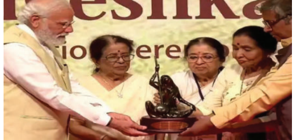
મોદી લતા મંગેશકરને યાદ કરતા ભાવુક થયા હતા. પીએમ મોદીએ કહ્યું કે ઘણા દાયકાઓ પછી આ પહેલો રક્ષાબંધનનો તહેવાર આવશે, જ્યારે દીદી નહીં હોય.

મુંબઈ, તા. ૨૪ પ્રધાનમંત્રી નરેન્દ્ર મોદી આજે મુંબઈની મુલાકાતે પહોંચ્યા હતા. આ કાર્યક્રમમાં પ્રધાનમંત્રી નરેન્દ્ર મોદીને પ્રથમ લતા દીનાનાથ મંગેશકર એવોર્ડથી સન્માનિત કરવામાં આવ્યા છે. આ કાર્યક્રમ દરમિયાન પીએમ મોદીએ કહ્યું કે, સંગીત, સાધના અને ભાવના પણ છે. કાર્યક્રમ દરમિયાન પીએમ