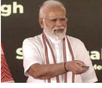
એ. આ બાદ પલ્લી કેન્દ્રશાસિત પ્રદેશ જમ્મુ કાશ્મીરની પ્રથમ

(એ.આર.એલ), જમ્મુ, તા. ૨૪ રાષ્ટ્રીય પંચાયતીરાજ દિવસના અવસરે જમ્મુના સામ્યા જિલ્લાની પલ્લી પંચાયતનું નામ ઇતિહાસમાં નોંધાઈ ગયું છે. વડા પ્રધાન નરેન્દ્ર મોદીએ પલ્લી પંચાયતના લોકોને ૫૦૦ કિલોવોટ ક્ષમતાવાળો પાવર પ્લાન્ટ સમર્પિત કર્યો છે.