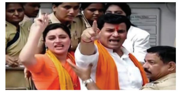
ધરની બહાર આખો દિવસ હોબાળો થયો. આ બધાની વચ્ચે