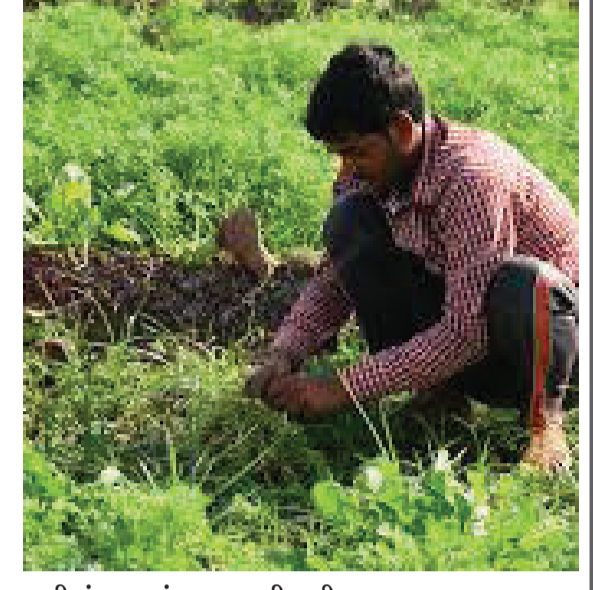
પાણીમાં પ્રથમ છંટકાવ વાવણી રીત બાદ ૪૦ દિવસે અને ત્યારબાદ

● ડુંગળીના છોડની ટોચ નમી ન જાય ત્યાં સુધી એટલે કે, એપ્રિલ-મે માસ દરમિયાન ખેતરમાં જ રહેવા દેવામાં આવે છે. કાપણી સમયસર કરવી, મોડી કાપણી કરવાથી કાંદાની ગુણવત્તા બગડે છે.