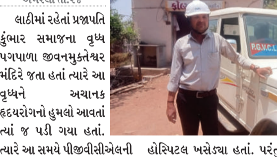
અમરેલી તા.૨૪ લાઈમાં રહેતાં પ્રજાપતિ કુંભાર સમાજના વૃધ્ધ પગપાળા જીવનમુક્તેશ્વર મંદિરે જતા હતાં ત્યારે આ વૃધ્ધને અચાનક હૃદયરોગનો હુમલો આવતાં ત્યાં જ પડી ગયા હતાં. ત્યારે આ સમયે પીજીવીસીએલની ટીમ ત્યાંથી પસાર થતી હોય તેમણે તાત્કાલિક વૃધ્ધને સારવાર અર્થે હોસ્પિટલ ખસેડ્યા હતાં. પરંતુ સારવાર મળે તે પહેલા જ વૃધ્ધ દમ તોડી દીધો હતો.