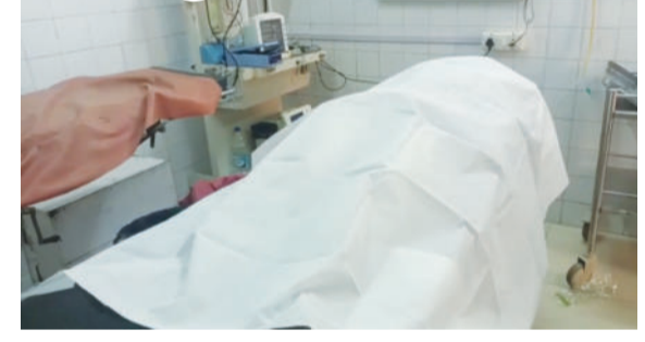
ઘા ઝીંકી હત્યા કરવામાં આવતા સમગ્ર પર્યંકમાં ચક્રચાર મચી જવા પામી છે. આ ઘટનામાં ૧૦થી વધુ લોકોનું ટોળું ઘરમાં તીક્ષ્ણ હથિયારો સાથે ઘુસી ગયું હતુ અને સરેઆમ આતંક મચાવ્યો હતો જેમાં નોરતામાં બોલાચાલીના મામલે પરિવારની

સુરેન્દ્રનગર, તા.૨૪ સુરેન્દ્રનગર જિલ્લાના લખતરના તાવીમાં ઘરમાં ઘુસીને યુવકને છરીના ઘા ઝીંકી હત્યા કરવામાં આવતા ચક્રચાર મચી જવા પામી છે. જેમાં નોરતામા બોલાચાલીના મામલે યુવકને પરિવારની નજર સામે જ યુવકને છરીના ઘા ઝીંકાયા હોવાની સનસનીખેજ વિગતો સામે આવી છે સુરેન્દ્રનગર જિલ્લાના લખતરના તાવીમાં ઘરમાં ઘુસીને યુવકને છરીના