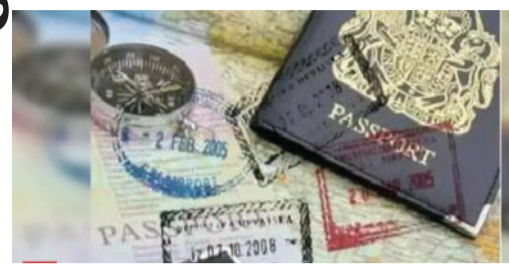
એ. આર. એલ. આ વિદ્યાર્થીઓનું રેસ્ક્યુ કર્યું હતું. હવે કોરોનાની સ્થિતિ સમાપ્ત થઈ છે ત્યારે ચીન ભારતના ૨૦ હજાર વિદ્યાર્થીઓને પરત આવવાની મંજૂરી નથી આપી રહ્યું. વિદેશ મંત્રી એસ. જયશંકરે માર્ચ મહિનામાં ચીનના વિદેશમંત્રી વાંગ યી સામે આ મુદ્દો ઉઠાવ્યો હતો. પરંતુ ચીન તરફથી કોઈ પ્રતિક્રિયા નથી આપવામાં આવી.

નવી દિલ્હી, તા. ૨૪ ભારતે ચીની નાગરિકોના ટુરિસ્ટ વિઝા પર રોક લગાવી દીધી છે. આંતરરાષ્ટ્રીય હવાઈ પરિવહન સંઘે કહ્યું કે, ચીની નાગરિકોને અપાયેલા ભારતીય ટુરિસ્ટ વિઝા હવે માન્ય નહીં ગણાય. ભારત સરકારના આ નિર્ણયને ચીનને આપેલા જડબાતોડ જવાબ તરીકે જોવામાં આવી રહ્યો છે. ભારતે આ નિર્ણય એ સમયે લીધો