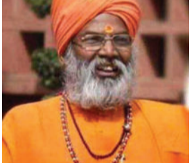
હતું કે, તમારા ગલી-મહોલ્લામાં, ઘરે અચાનક ટોળું ધસી આવે તો બચવા માટે તમારી પાસે કયા ઉપાયો છે, જો ન હોય તો કશુંક કરી રાખો. સાક્ષી

(એ.આર.એલ), લખનૌ, તા. ૨૪ ઉત્તર પ્રદેશના ઉત્તમ પાતેથી ભાજપના સાંસદ અને ફાયર બ્રાન્ડ નેતા સાક્ષી મહારાજે ફેસબુક પર એક વિવાદિત પોસ્ટ શેર કરી છે. સાક્ષી મહારાજે પોસ્ટમાં લોકોને પોતાની સુરક્ષા માટેના ઉપાયો સમજાવ્યા છે. આ સાથે જ તેમણે પોલીસને કાયર ગણાવી છે. પોતાના નિવેદનો માટે સતત વિવાદોમાં ઘેરાયેલા રહેતા સાક્ષી મહારાજે ફેસબુક પોસ્ટમાં લખ્યું