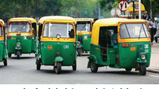
ભાવવધારો થઈ રહ્યો છે. જેથી અમરેલીમાં પેટ્રોલ-ડીઝલના

મોંઘવારીનો વાર થઈ રહ્યો છે. પેટ્રોલ, ડીઝલ, દવાઓ, શાકભાજી, દૂધ વગેરેના ભાવ તો વધ્યા જ હતા સાથે સાથે અદાણી દ્વારા સીએનજીના ભાવમાં પણ વધારો કરવામાં આવ્યો છે. સીએનજીના ભાવમાં પાંચ રુપિયાનો તોતિંગ વધારો થતાં અમરેલી જિલ્લાના રીક્ષાચાલકોની સમસ્યા વધી છે અને હવે રીક્ષાચાલકોને ભાડુ વધારવા સિવાય કોઈ રસ્તો બચ્યો નથી. ભાડાવધારો થતાની સાથે જ સામાન્ય જનતાને પણ બોજ પડશે. છેલ્લાં ઘણા સમયથી પેટ્રોલ-ડીઝલમાં કૂદકે ને ભૂસકે