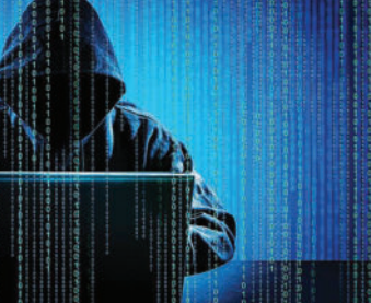
સોશિયલ મીડિયાના માધ્યમથી પ્રચાર કરવામાં આવ્યો. સાથે જ વિદ્યાર્થીઓ માટે ખાસ જે હેન્ડબુક પ્રસારિત કરવામાં

(જી.એન.એસ) નવી દિલ્હી, તા.૨૮ સાયબર ક્રાઈમ વિશે માહિતી લોકો સુધી પહોંચાડવા માટે તમામ માધ્યમોનો ઉપયોગ કરવામાં આવી રહ્યો છે. સાયબર ક્રાઈમ વિશે જાણકારી આપવા માટે ૧૦૦ કરોડથી વધુ SMS મોકલવામાં આવ્યા. સાયબર ક્રાઈમ રોકવા માટે અને સાયબર સુરક્ષા ટિપ્સ માટે અલગ-અલગ સોશિયલ મીડિયા પ્લેટફોર્મ પર પ્રચાર શરૂ કરવામાં આવ્યો છે.