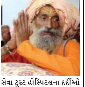
સેવા ટ્રસ્ટ હોસ્પિટલના દર્દીઓ માટે આ રક્તદાન કેમ્પનું આયોજન કરવામાં આવ્યું છે.

દામનગર તા.૨૮ દામનગર લટુરિયા હનુમાનજી મંદિર ખાતે ચાલી રહેલી ભાગવત કથામાં હઠયોગી ધનશ્યામગીરીબાપુની રક્તતુલા કરવા માટે સેવક સમુદાય દ્વારા આગામી તા.૩૦ને શનિવારના રોજ સવારના ૭:૩૦ કલાકથી રક્તદાન કેમ્પનું આયોજન કરવામાં આવ્યું છે. કથાના સમાપન પ્રસંગે ટીબી માનવ