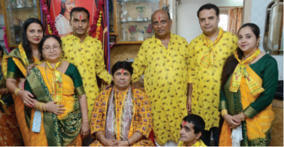
હવેલીમાં પ્રાગટ્ય ઉત્સવ નિમિત્તે વિવિધ મનોરથ સર્વોત્તમ ઓતના