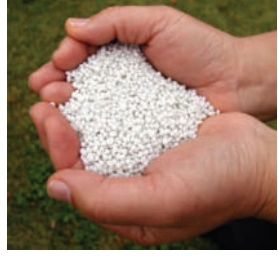
ખરીફ સિઝન માટે વધારવામાં આવી છે અને વધેલી સબસિડી

(જી.એન.એસ) નવી દિલ્હી, તા.૨૮ સબસિડી વધારવાના નિર્ણયથી હવે કિસાનોને મળનાર ખાતરના ભાવ વધશે નહીં અને તે જૂના ભાવે મળતું રહેશે. કેબિનેટના નિર્ણયની જાણકારી આપતા સૂચના અને પ્રસારણ મંત્રી અનુરાગ ઠાકુરે જણાવ્યું કે ડીએપી ખાતરની પ્રતિ બેગ પર મળનારી સબસિડીને