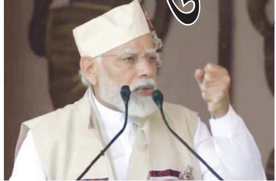
મામલાઓને પણ પ્રોત્સાહિત કરશે. તેનાથી સમગ્ર ક્ષેત્રમાં વિકાસની આકાંક્ષાઓને બળ મળશે. મોદીએ કહ્યું કે જ્યારે હથિયાર નાંખીને જંગમાંથી પરત ફરતા જવાનોને પોતાના પરિવારની સાથે પરત ફરતા જોઈને અને જ્યારે તે માતાઓની ખુશીઓનો અનુભવ કરું છું તો મને આશીર્વાદની અનુભૂતિ થાય છે. બોડો અર્કાડ હોય કે પછી કાર્બી આંગલોગનો કરાર, લોકલ સેલ્ફ ગવર્નન્સ પર અમે ખૂબ જ ભાર આપ્યો છે. કેન્દ્ર સરકારનો છેલ્લા ૭-૮ વર્ષથી સતત એ જ પ્રયત્ન રહ્યો છે કે સ્થાનિક શાસનની સંસ્થાઓને સશક્ત કરવામાં આવે,

ફરી રહી છે, તેમ-તેમ નિયમોને પણ બદલવામાં આવી રહ્યાં છે. આ કારણે જ અમે આફસ્યા (આર્મ્ડ ફોર્સિસ સ્પેશિયલ પાવર્સ એક્ટ)માં ઘટાડો કર્યો છે. નોર્થ ઈસ્ટમાં હિંસાની ઘટનામાં ૭૫ ટકાનો ઘટાડો આવ્યો છે. લાંબા સમય સુધી આફસ્યા નોર્થ ઈસ્ટના અનેક રાજ્યોમાં રહ્યો છે. જોકે છેલ્લા ૮ વર્ષ દરમિયાન સ્થાઈ શાંતિ અને સારી કાયદો વ્યવસ્થા લાગુ થવાના કારણે અમે આફસ્યાને નોર્થ ઈસ્ટના ઘણા ક્ષેત્રોમાંથી હટાવી દીધો છે. સબકા સાથ, સબકા વિકાસની ભાવનાની સાથે આજે સીમા સાથે જોડાયેલા મામલાનું સમાધાન શોધવામાં આવી રહ્યું છે. આસામ અને મેઘાલયની વચ્ચે થયેલી સહમતી બીજા