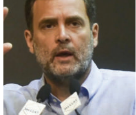
ઈંધણના ઊંચા ભાવ - રાજ્યની ભૂલ, કોલસાની અછત - રાજ્યની ભૂલ, ઓકિસજનની અછત - રાજ્યની ભૂલ. તમામ ઈંધણ કરમાંથી ૬૮% કેન્દ્ર દ્વારા એકત્રિત કરવામાં આવે છે. તેમ છતાં પીએમ

નવી દિલ્હી તા.૨૮ તાજેતરના દિવસોમાં પેટ્રોલ, ડીઝલ અને સીએનજીના ભાવમાં સતત વધારો થઈ રહ્યો છે. આ અંગે વિપક્ષી દળો સતત કેન્દ્ર સરકારને ઘેરી રહ્યા છે. કોંગ્રેસ નેતા રાહુલ ગાંધીએ ફરી એકવાર આ મુદ્દે કેન્દ્ર પર નિશાન સાધ્યું છે. તેમણે ટોણો માર્યો છે કે, ઈંધણના વધતા ભાવો માટે રાજ્યને દોષી ઠેરવવામાં આવે છે, જ્યારે તમામ ઈંધણ કરમાંથી ૬૮% કેન્દ્ર દ્વારા લેવામાં આવે છે. રાહુલ ગાંધીએ ટ્વીટ કર્યું કે જવાબદારીથી દૂર રહે છે. મોદીનો સંઘવાદ સાથીદાર નથી. તાજેતરમાં જ વડાપ્રધાન નરેન્દ્ર મોદીએ મુખ્યમંત્રીઓની બેઠકમાં વિપક્ષ શાસિત રાજ્યોને પેટ્રોલ અને ડીઝલ પર વેટ ઘટાડવાની અપીલ કરી હતી. તેમણે કહ્યું કે, કેન્દ્ર સરકારે ગયા વર્ષે એક્સાઈઝમાં ઘટાડો કર્યો હતો. આ પછી ભાજપ શાસિત રાજ્યોએ વેટમાં ઘટાડો કરીને જનતાને રાહત આપી છે. પરંતુ વિપક્ષ શાસિત રાજ્યોમાં આવું થયું નથી.