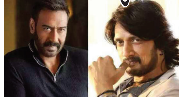
રાષ્ટ્રીય ભાષા હતી, છે અને હંમેશા રહેશે. જન ગણ મન. જોકે, કિચ્ચા સુદીપે પણ અજયની આ ટ્વિટ પર તાત્કાલીક પોતાનો પક્ષ રજૂ કર્યો. તેણે કહ્યું કે, હેલો, અજય દેવગણ સર, જે કો-રેસ્ટમાં મેં એ વાત કરી, મને

(સં. સ. સે.) મુંબઈ, તા.૨૮ અજય દેવગણ એ બોલિવુડ કલાકારોમાંથી છે, જે પોતાના કામથી જ કામ રાખે છે અને વિવાદોથી દૂર રહેવાનો પ્રયાસ કરે છે. સોશિયલ મીડિયા પર નિવેદનો આપવાથી પણ બચતો રહે છે. જોકે, આ વખતે હિંદી ભાષાને લઈને સાઉથ સિનેમાના વિલન કિચ્ચા સુદીપને કંઈક એવું કહી દીધું કે, અજય દેવગણ તેને જવાબ આપ્યા વિના ન રહી શક્યો. રનવે ૩૪ના એક્ટરે ટ્વિટ કરી કિચ્ચા સુદીપને હિંદીનું અપમાન કરવા માટે ઘણું કહી દીધું. હાલના દિવસોમાં જ્યાં બોલિવુડની