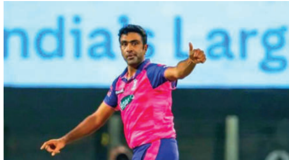
કરતાં પોતાની ટીમને મોટી જીત અપાવી હતી. અશ્વિને આ મેચમાં ૪ ઓવર બોલિંગ કરી. જેમાં માત્ર ૧૭ રન આપીને ૩ મોટી વિકેટ ઝડપી. તેની સાથે જ અશ્વિને આઈપીએલ ઈતિહાસમાં પોતાની ૧૫૦ વિકેટ પૂરી કરી. આ સિદ્ધિ મેળવનારો તે આ લીગનો આઠમો બોલર બની ગયો છે.

(એ.આર.એલ), પુણે, તા.૨૮ ઈન્ડિયન પ્રીમિયર લીગ ૨૦૨૨ ભારતીય બોલરો માટે શાનદાર સાબિત થઈ રહી છે. કેમ કે આ સિઝનમાં ભારતનો સ્ટાર સ્પિનર રવિચંદ્રન અશ્વિન ફરી એકવખત ફૂલ ફોર્મમાં આવી ગયો છે. ઓફ સ્પિનરે શાનદાર પ્રદર્શન કરતાં એક મોટો રેકોર્ડ પોતાના નામે કરી લીધો છે. અશ્વિને હાલની આઈપીએલ સિઝનમાં રોયલ ચેલેન્જર્સ બેંગલુરુ સામે ધમાકેદાર પ્રદર્શન