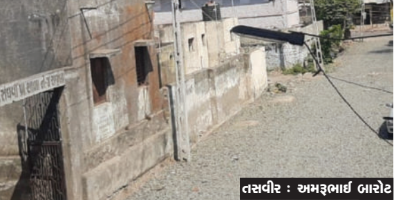
સુરેલીયા રોડ સહિતના વિવિધ વિસ્તારોમાં ૨૫ જેટલા રસ્તાઓ

રાજુલા તા.૨૮ રાજુલામાં રસ્તાના કામો શરૂ કરવામાં આવતાં શહેરીજનોમાં આનંદની લાગણી પ્રસરી જવા પામી હતી. પરંતુ ચાલુ થયેલા રસ્તાના કામો અધુરા છોડી દેવામાં આવતાં શહેરીજનોમાં ભારે રોષ ફેલાયો છે. શહેરના ભેરાઈ રોડ, જાફરાબાદ રોડ,