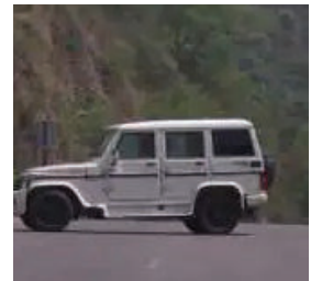
અને બોમ્બ ડિસ્પોઝલ સ્કવોડને જાણ કરવામાં આવી હતી.

(એ.આર.એલ), જમ્મુ, તા.૨૮ જમ્મુ-કાશ્મીરમાં પોલીસ પાસેથી મળેલી જાણકારી અનુસાર સિદ્ધામાં બના હોસ્પિટલની નજીક હાઈવે પર એક કચરામાં કાળા કલરનો ડબ્બો જોઈને લોકોને શંકા ગઈ અને પોલીસને જાણ કરી. માહિતી મળતા પોલીસની ટીમ સ્થળ પર પહોંચી