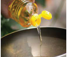
નિકાસ બંધ કરતાં મુશ્કેલી વધી શકે છે. આગામી દિવસોમાં પામ તેલના ભાવ હજી વધી શકે છે. છેલ્લા આઠ દિવસમાં જ પામ તેલમાં ૩ બે ૫૦ રૂપિયાનો ભાવ વધ્યો છે. બીજી તરફ, સનક્લાવરનો ભાવ ઓલ

રાજકોટ, તા.૨૮ આજથી ઈન્ડોનેશિયાએ ભારતમાં પામ તેલની નિકાસ બંધ કરવાનો નિર્ણય જાહેર કર્યો છે. ભારત ૫૦ ટકા પામ તેલની આયાત ઈન્ડોનેશિયાથી કરે છે. ઈન્ડોનેશિયાની આયાત-નિકાસની પોલિસીની સીધી જ અસર ભારતના તેલબજાર પડશે અને પામ તેલની અછત વર્તાય એવાં અંધાજા જોવા મળ્યાં છે. એક તરફ દરેક તેલના ભાવ આ વર્ષે આસમાને પહોંચ્યા છે, ત્યારે બીજી તરફ, ઈન્ડોનેશિયાએ પામ તેલની