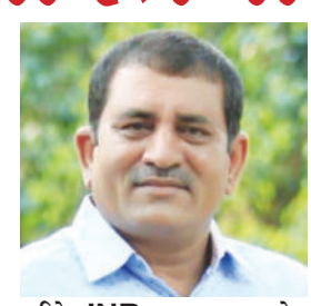
થઈને INR ૮,૭૬૪ કરોડ થઈ હતી. ભારતમાં લેબ ગ્રોન ડાયમંડ ઉદ્યોગના ઉત્ક્રાંતિના અગ્રણી, શ્રી

ટકાવી રાખવામાં મદદ કરે છે. આ આઈવીએફ ટેકનોલોજી અને ટેસ્ટ ટ્યુબ બેબીના વિચારને સમકક્ષ છે, જ્યાં ડીએનએ સમાન રહે છે પરંતુ રચનાનું વાતાવરણ અલગ છે. તે છતાં ટેસ્ટ ટ્યુબ બેબીને કેક કે આર્ટિફિશ્યલ ના કહીએ શકાય. બેઈન એન્ડ કંપનીનો તાજેતરનો ડાયમંડ ઈન્ડસ્ટ્રી રિપોર્ટ 2021-22 દર્શાવે છે કે લેબમાં ઉગાડવામાં આવતા હીરાનું વૈશ્વિક ઉત્પાદન દર વર્ષે 10 મિલિયન કરેટને વટાવી ગયું છે. તેમાંથી, ભારત દર વર્ષે લગભગ 1.5 મિલિયન કરેટના સીવીડી હીરાના ઉત્પાદનના ચાર્ટમાં અગ્રેસર છે, જે યુએસએ, યુરોપ અને મધ્ય પૂર્વ, રશિયા અને સિંગાપોરના એક્સ્ટર ઉત્પાદન સ્તર કરતાં પણ વધુ છે. આ જંગી ઉત્પાદન વોલ્યુમોના પરિણામે ભારત માટે આ વર્ષે નિકાસમાં ઝડપી વૃદ્ધિ થઈ છે. જેમ્સ એન્ડ જ્વેલરી એક્સપોર્ટ પ્રમોશન કોર્પોરેશનના અહેવાલ મુજબ, પોલિશ લેબ-ગ્રોન ડાયમંડ્સની નિકાસ ગયા વર્ષે INR ૫, 1૭૫ કરોડ હતી તેની સરખામણીએ FY 2022 માં લગભગ બમણી