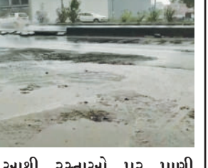
આથી રસ્તાઓ પર પાણી ભરાયા હતા. વરસાદ પહેલા પવનને કારણે ધૂળની ડમરી પણ ઉડી હતી. રાજકોટ શહેરમાં હાલ વાતાવરણ ગોરંભાયું છે અને કાળા ડિબાંધ વાદળો છવાયા છે.

રાજકોટ, તા.૫ રાજકોટ જિલ્લામાં આજે સવારથી જ વાતાવરણમાં પલ્ટો જોવા મળ્યો હતો. વહેલી સવારે આકાશમાં વાદળો છવાયા હતા. બપોર બાદ વાતાવરણમાં અચાનક પલ્ટો જોવા મળ્યો હતો. ત્યારે ગોંડલ અને કોટડા સાંગાણી પંથકમાં ભારે પવન અને કરા સાથે ધોધમાર વરસાદ વરસ્યો હતો.