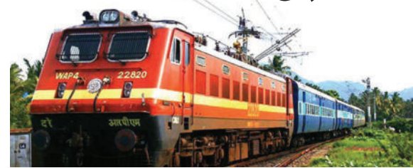
હાલાકીને ધ્યાને લઈ ભાજપ અગ્રણી રેલવેમંત્રી દર્શનાબેન જરદોશ, મુખ્યમંત્રી ભૂપેન્દ્રભાઈ પટેલ અને પ્રદેશ ભાજપ

અમરેલી,તા.૫ અમરેલી જિલ્લામાંથી બહોળો સમાજ હાલ સુરત સ્થાયી થયો છે. જેમાં અમરેલી જિલ્લાના તમામ તાલુકાઓમાંથી લોકો સુરત ધંધા અર્થે સ્થાયી થયા છે. ત્યારે મહુવા-સુરત ટ્રેનનો દામનગરનો સ્ટોપ ન હોવાથી મુસાફરો આ બાબતે ભારે હાલાકી ભોગવી રહ્યાં છે. જેથી મુસાફરોની