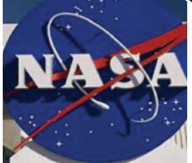
ઈન્સ્ટિટ્યુટ ઓફ ટેકનોલોજીની ટીમને સોશિયલ મીડિયા એવોર્ડમાં

ગ્રુપ દ્વારા એક સ્વચાલિત રોવરની ડિઝાઇન તૈયાર કરવામાં આવી હતી. જે સૌર તંત્રમાં મળતી યજ્ઞની પિંડ (રોકી બોડી) સુધી પહોંચી શકે. પંજાબના ડિસેન્ટ ચિલ્ડ્રન મોડલ પ્રેસીડેન્સી સ્કૂલના વિદ્યાર્થીઓએ ડાઈસ્કૂલ ડિવિઝનમાં એસટીઈએમ એન્ડ એન્ડ્રીયુસ પુરસ્કાર જીત્યો છે. તમિલનાડુના વેલ્લોર