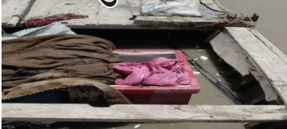
જ્યારે પેટ્રોલિંગ ટીમ જઈ રહી હતી ત્યારે પાકિસ્તાની માછીમારો આસપાસમાં ઝાડીઓની મદદથી છુપાઈ ગયા હતા અને પાકિસ્તાની વિસ્તારમાં નાસી છૂટવામાં સફળ

(જી.એન.એસ)નવીદિલ્હી, તા.૦૫ બીએસએફ ભુજની ટીમ અરબી સમુદ્ર પાસે પેટ્રોલિંગ કરી રહી હતી. ત્યારે બીપી નંબર ૧૧૫૮ હરામી નાળા વિસ્તારમાં કેટલીક શંકાસ્પદ વસ્તુઓ બનવાની આશંકા હતી. પછી જોયું કે પાકિસ્તાની માછીમારો ત્રણ-ચાર બોટમાંથી ભારતીય જળસીમામાં ઊંડે સુધી આવી રહ્યા છે. આ પછી તરત જ પેટ્રોલિંગ પાર્ટી ત્યાં પહોંચી ગઈ.