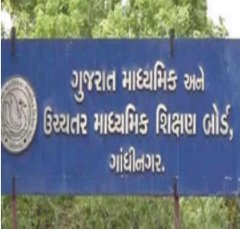
જાય તો શિક્ષણ બોર્ડ દ્વારા સુધારી દેવામાં આવશે. વિદ્યાર્થીઓને અપાતી કમ્પ્યુટરાઈઝ્ડ માર્કશીટમાં વિદ્યાર્થીનાં નામ,

(સં.સ.સે.)ગાંધીનગર, તા.૫ ગઈ ૧૨ એપ્રિલના રોજ ગુજરાત માધ્યમિક અને ઉચ્ચતર માધ્યમિક વિભાગની પરીક્ષાઓ પૂર્ણ થઈ ગઈ છે. જે બાદ શિક્ષણ વિભાગ દ્વારા ધોરણ ૧૦ અને ૧૨ના પરિણામો તૈયાર કરવાની તૈયારીઓ ચાલી રહી છે. આ કામગીરી દરમિયાન તૈયાર થયેલી વિદ્યાર્થીઓની માર્કશીટમાં ક્યારેક ભૂલ આવી