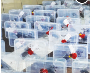
જ આ ઓપરેશન પાર પાડ્યું હતું. પોલીસ તપાસમાં બહાર આવ્યું છે કે કોઈએ સોશિયલ મીડિયામાં ફોટો પડાવી અપલોડ કરવા તો કોઈએ ગુનાહિત કૃત્ય કરવા માટે હથિયારો

ગુજરાતમાં ડ્રગ્સ જેવા નશીલા પદાર્થોની હેરાફેરી અને વેચાણ બાદ રથયાત્રા પહેલાં જ ગેરકાયદે હથિયારોના વેચાણનો પર્દાફાશ કર્યો છે. ગુજરાત ATSએ ૨ આરોપીઓને હથિયાર સાથે ઝડપી પાડ્યા હતા. ત્યાર બાદ તેમની પૂછપરછ કરતા અન્ય ૨૨ ઈસમોના નામ સામે આવ્યા હતા. જેમની પાસેથી પણ ૫૦ ગેરકાયદેસર હથિયાર કબજે કર્યા છે. ATSએ ૨૪ કલાકમાં