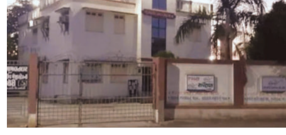
વિસ્તારોમાં ગંદકીના ગંજ જામ્યા છે. તો મોટે ઉપાડે સીસીટીવી

દામનગર નગરપાલિકા શહેરીજનોને પ્રાથમિક સુવિધા પુરી પાડવામાં નિષ્ફળ રહેતાં શહેરીજનોમાં ભારે રોષ ફેલાયો છે. વેરા બાબતે અવારનવાર લોકોને નોટીસ પાઠવતી દામનગર પાલિકા સફાઈ કામગીરીમાં ઉણી ઉતરી છે. સફાઈના અભાવે અનેક