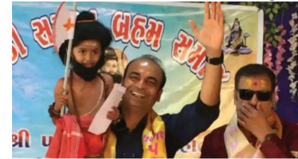
હતી. આ પ્રસંગે બ્રહ્મસમાજના વિશિષ્ટ સેવા આપનારનું સન્માન તેજસ્વી છાત્રો અને સામાજિક ક્ષેત્રે કરવામાં આવ્યું હતું.

અમરેલી,તા.૫ લાઠી ખાતે અખાત્રીજના પાવન પ્રસંગે પરશુરામજીના પ્રાગટ્ય દિનની ભક્તિભાવ સાથે ઉજવણી કરવામાં આવી હતી. પરશુરામ જયંતીએ ભૂદેવો દ્વારા શોભાયાત્રા કાઢવામાં આવી હતી. આ શોભાયાત્રામાં મોટી સંખ્યામાં ભૂદેવો જોડાયા હતા. શોભાયાત્રા શહેરના વિવિધ માર્ગો પર ફરી