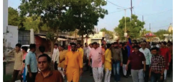
આવ્યું હતું. વિવિધ વિસ્તારો જય પરશુરામ અને હર હર મહાદેવના

અમરેલી,તા.૫ દામનગરમાં પરશુરામ જયંતીની ધામધૂમથી ઉજવણી કરવામાં આવી હતી. આ ધાર્મિક પ્રસંગે બ્રહ્મસમાજ દ્વારા ભવ્ય શોભાયાત્રા કાઢવામાં આવી હતી. શોભાયાત્રા શહેરના મુખ્ય માર્ગો પર ફરી હતી. શહેરમાં બ્રહ્મસમાજની વાડી ખાતેથી શોભાયાત્રાનું પ્રસ્થાન કરવામા