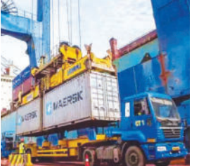
નાણાકીય વર્ષ ૨૦૨૧-૨૨માં દેશમાંથી કુલ ૪૦૦ અબજ ડોલરની નિકાસ થઈ હતી. દેશની નિકાસમાં

દેશના કેટલાક એવા રાજ્યો છે જ્યાં અર્થતંત્રમાં વ્યાપાર અને ઉદ્યોગનો હિસ્સો મોટો છે. ગુજરાત તેમાં સૌથી આગળ છે. ગુજરાતમાં છેલ્લા સાત દાયકાથી ફાર્મા, કેમિકલ્સ, ફૂડ ઓઈલ રીફાઈનીંગ, પેટ્રોકેમિકલ્સ, ટેક્સટાઈલ્સ, કેમિકલ્સ જેવા ઉદ્યોગો સ્થપાયેલા છે. કેન્દ્ર સરકારના આંકડાઓ અનુસાર