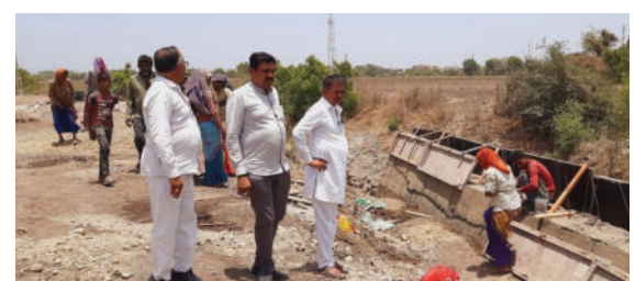
રસ્તા માટે રૂ.૧૮૦ લાખ મંજૂર કરવામાં આવ્યા હતાં. આ અનુરોધ કર્યો હતો.

વડિયા તા.૫ વડિયાના રણુજાધામથી ખજૂરી જવા માટેના બિસ્માર રસ્તા બાબતે સ્થાનિક ધારાસભ્ય અને પૂર્વ વિપક્ષ નેતા પરેશભાઈ ધાનાણીને રજૂઆત મળતા તેમના દ્વારા ઉચ્ચકક્ષાએ રજૂઆત કરતા તે નોન પ્લાન