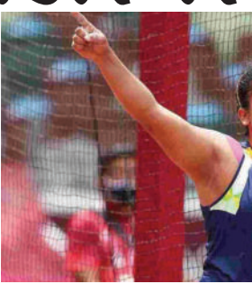
પ્રતિબંધ લગાવાયો છે. તમને જણાવી દઈએ કે, કમલપ્રિત કૌર આ રમતમાં ભારતમાં ટોપ

(જી.એન.એસ) નવી દિલ્હી, તા.૦૫ ભારતીય ડિસ્કસ થ્રો કમલપ્રિત કૌરનો ડોપિંગ કેસ મામલે પોઝિટિવ રિપોર્ટ આવ્યો છે. જેથી હવે ભારતીય ડિસ્કસ થ્રોઅર કમલપ્રિત કૌર પર પ્રતિબંધ લગાવાયો છે. ભારતના સિનિયર ડિસ્કસ થ્રો ખેલાડી કમલપ્રિત કૌર સામે કડક કાર્યવાહી કરવામાં આવી છે. AIUની તપાસમાં કમલપ્રિત કૌર પોઝિટિવ આવતા