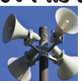
અંગે ચેતવણી આપી હતી, બુધવારે મોડી રાત્રે દક્ષિણ મુંબઈમાં મુસ્લિમ ધર્મગુરુઓની બેઠક યોજાઈ હતી. બુધવારે મોડી રાત્રે દક્ષિણ મુંબઈની

(એ.આર.એલ), મુંબઈ, તા.૫ છેલ્લા કેટલાક દિવસોથી મહારાષ્ટ્રમાં ધાર્મિક સ્થળો પર લાઉડસ્પીકર લગાવવાના મુદ્દે વિવાદ ચાલી રહ્યો છે. આ વિવાદ વચ્ચે મુસ્લિમ ધર્મગુરુઓએ મોટો નિર્ણય લીધો છે. ૨૬ મસ્જિદોના ધર્મગુરુઓએ એક બેઠક કરીને નિર્ણય લીધો છે કે હવે સવારની નમાજ લાઉડ સ્પીકર પર નહીં થાય. રાજ ઠાકરેએ મસ્જિદોમાં અઝાન