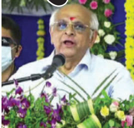
જરૂરિયાત મુજબના વિકાસ કામો પૂર્ણ કરવા રાજ્ય સરકાર પ્રતિબદ્ધ છે તેમ તેમણે ઉમેર્યું હતું. આ સંદર્ભમાં તેમણે કહ્યું કે, વડાપ્રધાન નરેન્દ્ર

(સં.સ.સે.)ગાંધીનગર, તા.૫ મુખ્યમંત્રી ભૂપેન્દ્રભાઈ પટેલે સ્પષ્ટ મત વ્યક્ત કર્યો છે કે હરેક સમાજ, જાતિ, વંચિત, પીડિત, શોષિત અને અંતરિયાળ વિસ્તારો સુધી સરકારની યોજનાઓનો લાભ સુપેરે પહોંચાડી આપણે ગુજરાતને વિકાસનું ગ્રોથ એન્જીન બનાવ્યું છે. વિકાસની ખૂટતી તમામ કડી પૂર્ણ કરી આદિજાતિ વિસ્તારોને પણ વિકાસની મુખ્યધારામાં લાવ્યા છીએ. હજુ પણ