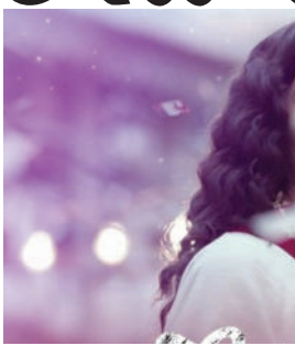
રાજદાને ફિલ્મની સફળતા માટે પુશી વ્યક્ત કરવા માટે ઇન્સ્ટાગ્રામ સ્ટોરી મૂકી છે. નેટફ્લિક્સ પર

(જી.એન.એસ) મુંબઈ, તા.૦૫ 'ગંગુબાઈ કાઠિયાવાડી' નેટફ્લિક્સ પર અત્યાર સુધીમાં ૧૩.૮૨ મિલિયન કલાક જોવામાં આવી છે અને કેનેડા, યુનાઈટેડ કિંગડમ, દક્ષિણ આફ્રિકા, ઓસ્ટ્રેલિયા, ન્યૂઝીલેન્ડ અને UAE સહિત ૨૫ દેશોમાં ટોચની ૧૦ ફિલ્મમાં રહી છે. આલિયાએ ફિલ્મમાં 'ગંગુબાઈ'નું પાત્ર ભજવ્યું છે. આલિયા અને તેની માતા સોની