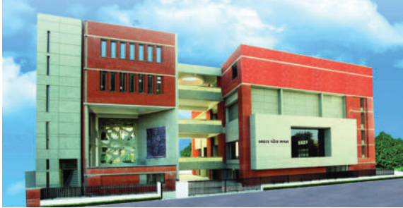
કરાવવું પડશે. રાજકોટ સ્થિત શ્રી સરદાર પટેલ ભવન ખાતે સવારે ૯ વાગ્યાથી બપોરે ૧૨ વાગ્યા સુધી આ કાર્યક્રમ યોજાશે. જેમાં ધો. ૧૦ અને ૧૨ પછી શું કરવું તે અંગે સતત મુંઝવતા પ્રશ્નોનું

રાજકોટ, તા. ૫ ધો. ૧૦ અને ૧૨ની પરીક્ષા પૂર્ણ કર્યા બાદ વિદ્યાર્થીઓમાં હવે આગળ શું કરવું તેની મુંઝવણ જોવા મળતી હોય છે ત્યારે શ્રી ખોડલધામ ટ્રસ્ટ-કાગવડ સંચાલિત શ્રી સરદાર પટેલ કલ્ચરલ ફાઉન્ડેશન-રાજકોટ દ્વારા આગામી રવિવારે ફી કારકિર્દી માર્ગદર્શન કાર્યક્રમનું આયોજન કરાયું છે. આ કાર્યક્રમમાં ભાગ લેવા વિદ્યાર્થીઓએ રજિસ્ટ્રેશન