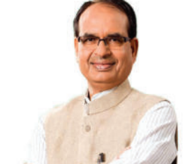
શિવરાજસિંહ ચૌહાણે જાહેરાત કરતા કહ્યું હતું કે હું તાકિદે પાઠ્યક્રમ સમિતિને બોલાવી નિર્દેશ આપીશ કે ભગવાન પરશુરામજીના ચરિત્રના પાઠને પાઠ્યક્રમમાં

ભોપાલ, તા.૫ મધ્યપ્રદેશની સ્કૂલોના પાઠ્યક્રમમાં હવે તાકિદે ભગવાન પરશુરામના જીવનથી જોડાયેલ વાતોને ભણાવવામાં આવશે. આ જાહેરાત ખુદ મુખ્યમંત્રી શિવરાજસિંહ ચૌહાણે કરી છે. પરશુરામ જયંતી પર ભોપાલના ગુફા મંદિરમાં પરશુરામની સૌથી ઉંચી ૨૧ ફૂટની અષ્ટ ધાતુથી નિર્મિત મૂર્તિનું અનાવરણ કરવામાં આવ્યું હતું.