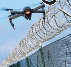
પછી તરત જ પાક ડ્રોન પાછું કર્યું. બીએસએફએ કહ્યું કે આ ઘટના બાદથી આસપાસના વિસ્તારમાં શોધખોળ કરવામાં આવી રહી છે. જમ્મુમાં ડ્રોન દ્વારા જમ્મુ અને કાશ્મીરમાં કાર્યરત આતંકવાદીઓને પાકિસ્તાનમાંથી શસ્ત્રો છોડવાના અનેક કિસ્સા છે. ત્રણ દિવસ પહેલા સેનાએ ચક ફકીરા વિસ્તારમાં એક અંડરગ્રાઉન્ડ ટનલ શોધી કાઢી હતી.

કે પાકિસ્તાન દ્વારા મોકલવામાં આવેલ ડ્રોનને ૭.૨૫ વાગ્યે અરનિયા વિસ્તારમાં ભારતીય બાજુથી બીએસએફના જવાનોએ જોયું હતું. ડ્રોન ભાગ્યે જ ઈન્ટરનેશનલ બોર્ડર ઓળંગ્યું હોવું જોઈએ, જ્યારે એલર્ટ બીએસએફ સૈનિકોએ ડ્રોન પર છ રાઉન્ડ ફાયરિંગ કર્યું, જેના