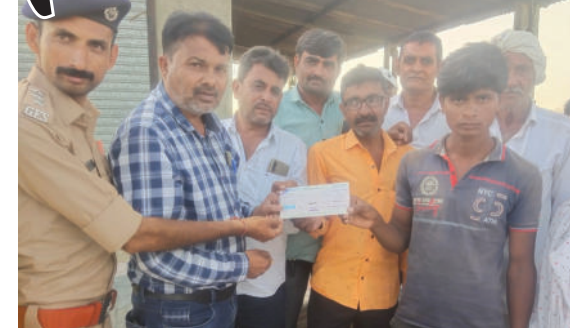
પાંચ વર્ષની બાળકીને ફાડી ખાનાર થતા વનવિભાગ પણ દોડી ગયો હતો અને બાળકીને ફાડી ખાનાર સિંહને ગણતરીના કલાકોમાં જ

ચેક અર્પણ સમયે સ્થાનિક આગેવાનો ઉપસ્થિત રહ્યાં અમરેલી,તા.૮ બગસરા તાલુકાના કડાયા ગામે પાંચ વર્ષની બાળકીને સિંહે ફાડી ખાતા નાના એવા ગામમાં અરેરાટી પ્રસરી જવા