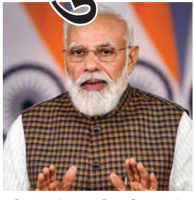
ઓનલાઈન અને ઓફલાઈન શિક્ષણ આ પ્રકારે વિકસિત કરવામાં આવે કે સ્કૂલે જતા

(જી.એન.એસ)નવીદિલ્હી,તા.૦૮ પીએમઓ તરફથી જાહેર કરવામાં આવેલા એક નિવેદનમાં પ્રધાનમંત્રીએ કહ્યું કે, સ્કૂલ છોડી ચૂકેલા બાળકોને ફરીથી મુખ્ય ધારામાં સામેલ કરવાથી લઈને ઉચ્ચ શિક્ષણમાં મલ્ટિપલ એન્ટ્રી એન્ડ એકિઝટની વ્યવસ્થા શરૂ કરવા માટે ઘણા બધા ટ્રાન્સફોર્મેટ સુધારાઓ કરવાની પહેલ કરવામાં આવી છે. જે દેશની પ્રગતિમાં અસરકારક સાબિત થશે. બેઠક દરમિયાન પ્રધાનમંત્રીને રાષ્ટ્રીય સંચાલન સમિતિ હેઠળ તૈયાર કરવામાં આવી રહેલા રાષ્ટ્રીય પાઠ્યક્રમ રૂપરેખાની પ્રગતિની જાણ કરી. આ દરમિયાન તેમણે કહ્યું કે