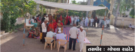
જેમાં ૬૦ દર્દીઓને મોતિયાના ઓપરેશનની જરૂરીયાત જણાતા આ તમામને વિનામૂલ્યે ઓપરેશન કરી આપવામાં આવશે. તથા સર્વરોગ નિદાન કેમ્પમાં સ્ત્રીરોગ નિષ્ણાંત, હોમિયોપેથિક સહિતના ડોક્ટરોએ સેવા આપી હતી. જેનો પણ દર્દીઓએ બહોળી સંખ્યામાં લાભ લીધો હતો.

રાજુલા, તા.૮ રાજુલા ગાયત્રી શક્તિપીઠ ખાતે ગુજરાત પીપાવાવ પોર્ટ લિ., અંધત્વ નિવારણ સમિતિ, ગાયત્રી પરિવાર ટ્રસ્ટ અને સુદર્શન નેત્રાલય-અમરેલીના સહયોગથી વિનામૂલ્યે નેત્ર નિદાન, મોતિયાના ઓપરેશન અને સર્વરોગ નિદાન કેમ્પ યોજાયો હતો. આ નેત્ર નિદાન કેમ્પનો ૨૦૫ દર્દીઓએ લાભ લીધો હતો.