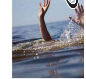
એક મહિલા અને તેની પુત્રવધૂ કપડાં ધોતા હતા. મહિલાના ત્રણ બાળકો અહીં નજીકમાં બેઠા હતા. આ દરમિયાન એક બાળક લપસીને પાણીમાં પડી ગયો હતો. તેને બચાવવા માટે પરિવારના સભ્યો એક પછી એક કૂદી પડ્યા અને તેમાં ડૂબીને જીવ ગુમાવ્યો હતો. બાળકને બચાવવા ચાર લોકો તેમાં કૂદી પડ્યા હતા, પરંતુ આ તમામ લોકો ડૂબી જવાથી મૃત્યુ પામ્યા હતા.

(એ.આર.એલ),મુંબઈ,૮ મહારાષ્ટ્રમાં એક ખાણમાં મોટી દુર્ઘટના સામે આવી છે. અહીં, ડોમ્બિવલીમાં પાણીથી ભરેલી ખાણમાં પડી જવાથી એક જ પરિવારના પાંચ લોકોના મોત થયા છે. મૃતકોમાં ત્રણ બાળકો અને બે મહિલાઓનો સમાવેશ થાય છે. ગ્રામજનોએ જણાવ્યું કે, ગામમાં પાણીની અછત હોવાથી પરિવારના સભ્યો અહીં કપડાં ધોવા ગયા હતા. અહીં બે મહિલાઓ કપડા ધોવા ગઈ હતી. આ દરમિયાન એક બાળક તેમાં પડી ગયો, જેને બચાવવા માટે મહિલા અંદર કૂદી પડી અને આ અકસ્માતમાં તમામ પ લોકોના મોત થયા હતા. પોલીસ અધિકારીએ જણાવ્યું કે, અહીં