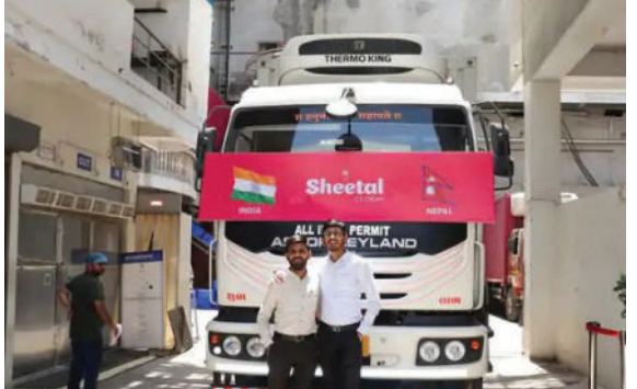
નેપાળમાં પણ નિકાસ કરવાની શરૂઆત કરી છે. નેપાળના કાઠમંડુ અને પોખરા ડિસ્ટ્રિક્ટમાં આઈસ્ક્રીમ મોકલવાની શરૂઆત કરી છે. હાલમાં અમરેલીથી ૨

અમરેલી તા.૮ ગુજરાતમાંથી કોઈ કાશ્મીર ફરવા ગયું હોય અને તેને આઈસ્ક્રીમ ખાવાની ઈચ્છા થાય તો ત્યાં પણ હવે તેમને ગુજરાતમાં જ બનેલો આઈસ્ક્રીમ ખાવા મળશે. અમરેલી શહેરની આઈસ્ક્રીમ બનાવતી કંપની શીતલ ફૂલ પ્રોડક્ટ્સ લિમિટેડે કાશ્મીરમાં પુલવામા અને શ્રીનગરમાં