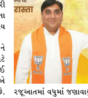
રજૂઆતમાં વધુમાં જણાવવા

માલસામાન લેવા માટે શહેરી વિસ્તારમાં જવું પડે છે જેના કારણે વધુ પૈસાનો વ્યય થાય છે. જેથી ગ્રામીણ લાભાર્થીઓને સહાયમાં વધારો થાય તે માટે ભાજપ અગ્રણી જનકભાઈ તળાવીયાએ ઉચ્ચકક્ષાએ પત્ર પાઠવી રજૂઆત કરી છે.