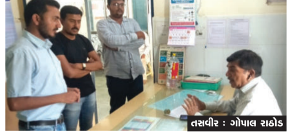
૧૮ વર્ષથી ઉપરના ૧૭૭૬ બાળકોને રસીનો ડોઝ આપી