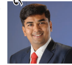
વર્ષની ફી બાકી છે. નાણાકીય અને શૈક્ષણિક વર્ષ પણ પૂર્ણ

અમરેલી, તા. ૨૪ અમરેલી જિલ્લા સ્વનિર્ભર શાળા સંચાલક મંડળ દ્વારા પ્રાથમિક શાળાઓને આરટીઈ અંતર્ગતની ફી સરકાર દ્વારા સમયસર ચૂકવવામાં આવે તેવી માંગ કરવામાં આવી છે. હાલ અમરેલી તાલુકાની શાળાઓને ચાલુ શૈક્ષણિક વર્ષમાં આખા વર્ષની ફી બાકી છે. નાણાકીય અને શૈક્ષણિક વર્ષ પણ પૂર્ણ થઈ ગયેલ હોવા છતાં શાળા સંચાલકોને આરટીઈ અંતર્ગતની સરકાર તરફથી ચૂકવાતી ફી મળેલ નથી. છેલ્લા બે વર્ષથી શાળાઓની પરિસ્થિતિ પણ ખૂબ જ સંવેદનશીલ છે ત્યારે આ અંગે યોગ્ય કરવામાં આવે તેવી શાળા સંચાલક મંડળ દ્વારા માંગ કરવામાં આવી છે.