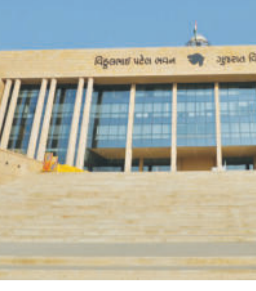
છે, તેમની પસંદગી રાજ્યના ભૂણેભૂણેથી કરવામાં આવી