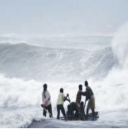
દીવ, જાકરાબાદ પીપાવાવ ભાવનગર અલગ ભરૂચ દહેજ મગદલ્લા અને દમણના બંદરો પર એલર્ટ આપી દેવાયું છે. આજે વાતાવરણમાં ભેજનું પ્રમાણ

(એ.આર.એલ), રાજકોટ, તા. ૨૪ નેઋત્યનું ચોમાસુ આગળ વધી રહ્યું છે અને અરબી સમુદ્રમાં તેની એન્ટી થવાની સાથે દરિયામાં કરંટ જોવા મળી રહ્યો છે. પ્રતિ કલાકના ૪૦ થી ૫૦ કિલોમીટરની ઝડપે પવન ફૂંકાય છે અને અમુક તબક્કે તેની ઝડપ વધીને ૬૦ કિલોમીટર આસપાસ પહોંચી જતી હોવાથી જખો, માંડવી, મુન્દ્રા, ન્યુ કંડલા, નવલખી, જામનગર, સલાયા, પોરબંદર, મૂળ દ્વારકા, વેરાવળ,