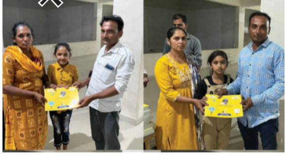
આ ડ્રીમ ડાયરીનું વિમોચન મોરારી બાપૂના હસ્તે કરવામાં આવ્યું હતુ. આ ડાયરી વિષયના ૨૧ દેશોમાં પ્રસિધ્ધ થયેલી છે.

અમરેલી, તા.૨૪ અમરેલીમાં ડો. કલામ ઈનોવેટીવ સ્કૂલ દ્વારા ચિત્ર સ્પર્ધાનું આયોજન કરવામાં આવ્યું હતુ. ઈશ્વરીયા, મતિરાણા, વરસડા તેમજ અમરેલીમાં અલગ-અલગ વિષય પર ચિત્ર તૈયાર કરવામાં આવ્યા હતા. આ સ્પર્ધામાં ભાગ લેવા બદલ સ્પર્ધકોને વિશિષ્ટ ઈનામમાં ડ્રીમ ડાયરી આપવામાં આવી હતી.