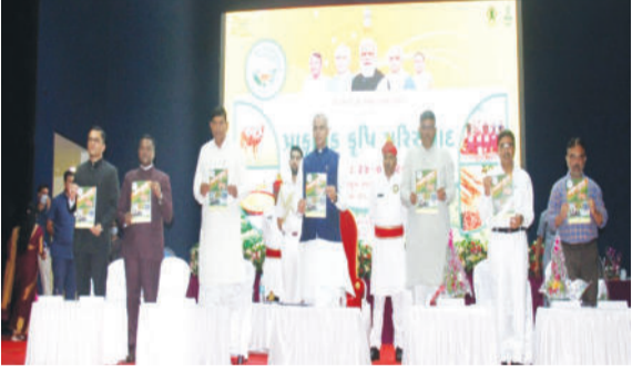
મિત્રોની 'પ્રાકૃતિક કૃષિ સાફલ્ય હસ્તે વિમોચન કરવામાં ગાથા' પુસ્તકનું રાજ્યપાલના આયુષ્ય હતું. આ પરિસંવાદમાં

રાજકોટ તા. ૨૪ રાજકોટમાં આજે પ્રમુખસ્વામી ઓડિટોરિયમ ખાતે રાજ્યપાલ આચાર્ય દેવવ્રતની ઉપસ્થિતિમાં પ્રાકૃતિક કૃષિ પરિસંવાદ યોજાયો હતો. જ્યાં તેમણે ખેડૂતોને સંબોધતા જણાવ્યું હતું કે, ખેતી કરવાથી ૧ વર્ષમાં જ જમીનમાં ઓર્ગેનિક કાર્બનનું પ્રમાણ વધશે આ સાથે રાજકોટ જિલ્લાના ૭૫ ખેડૂત