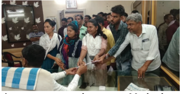
શોચાલય મુક્ત રાજ્ય કરવા માટે ખુબજ કામગીરી કરેલ છે. આ

અમરેલી, તા.૨૪ અમરેલીમાં સ્વચ્છ ભારત મિશન ગ્રામિણ યોજના અંતર્ગત કામગીરી કરતા કર્મચારીઓએ પોતાની પડતર માંગણી માટે જિલ્લા ગ્રામ વિકાસ એજન્સી ખાતે ધરણા કરી રોષ વ્યક્ત કર્યો છે. કર્મચારીઓએ જણાવ્યું હતું કે, સ્વચ્છ ભારત મિશન ગ્રામિણ યોજનાના કર્મચારીઓએ