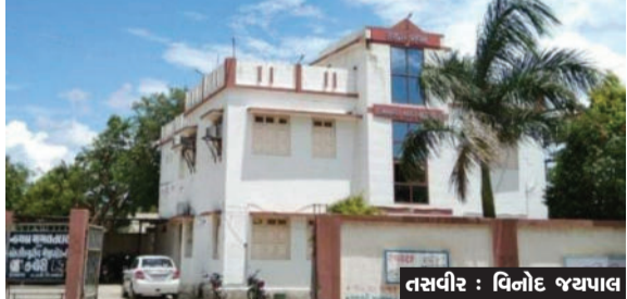
૩૧.૧૫ હજારનું બીલ હોય તેને ૩૧.૨૫ હજાર આપવામાં આવ્યાં

દામનગર તા.૨૪ દામનગર નગરપાલિકા દેવાળુ ફૂંકવા બેઠી હોય તેમ પાલિકાની તિજોરીને લાખો રૂપિયાનો ધુંબો માર્યા હોવાનું સામે આવ્યું છે. પાલિકાના સત્તાધિશો આટલા બધા કોના કહેવાથી ? ઓળઘોળ થઈ રહ્યાં છે તેવી ચર્ચાઓ થઈ રહી છે. માલ - સામાનની ખરીદીમાં