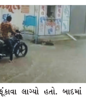
ફૂંકવા લાગ્યો હતો. બાદમાં ભારે પવન અને ગાજવીજ સાથે

રાજકોટ તા. ૨૪ હવામાન ખાતાની આગાહીને પગલે સમગ્ર રાજ્ય સહિત રાજકોટ જિલ્લાના વાતાવરણમાં પણ પલટો આવ્યો છે. આખો દિવસ અસહ્ય ગરમી બાદ સાંજે પાંચ વાગ્યાથી વાતાવરણમાં પલટો જોવા મળી રહ્યો છે. આકાશ કાળા ડિબાંગ વાદળોથી ઘેરાયું હતું અને અચાનક પવન