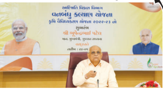
વિતરણનો મુખ્યમંત્રી ભૂપેન્દ્ર પટેલે ગાંધીનગરથી વર્ચ્યુઅલ પ્રારંભ કર્યો છે. તદઅનુસાર સાબરકાંઠા, બનાસકાંઠા, અરવલ્લી,

ગાંધીનગર તા.૨૪ રાજ્ય સરકાર દ્વારા ૨૦૧૨ થી અમલમાં આવેલી આ કૃષિ વેવિધ્યકરણની આ યોજનામાં ૬૨ વર્ષે ૩.૩૦ થી ૩૫ કરોડના ખર્ચે અંદાજે ૧ લાખથી વધુ આદિજાતિ ખેડૂતોને લાભ આપવામાં આવે છે. જે અંતર્ગત ૧૪ જિલ્લાના ૧.૨૩ લાખ જેટલા આદિજાતિ ખેડૂતોને ખાતર-બિયારણ કિટ્સ