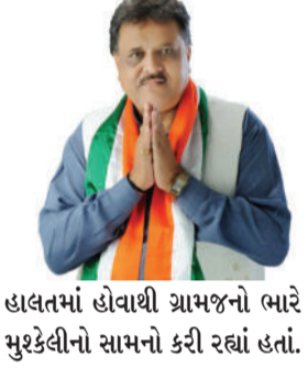
હાલતમાં હોવાથી ગ્રામજનો ભારે મુશ્કેલીનો સામનો કરી રહ્યાં હતાં.

વિધાનસભાના ગ્રામ્ય વિસ્તારોમાં રોડ રસ્તાઓને પ્રાથમિકતા આપી બિસ્માર રસ્તાઓ તેમજ સાત વર્ષથી બન્યા ન હોય તેવા માર્ગોને રિસર્વેસીંગ તેમજ નોન પ્લાન રસ્તાઓ પણ મંજૂર કરાવતા લાઠી અને બાબરા પંથકની જનતામાં રાહતની લાગણી પ્રસરી ગઈ છે. લાઠી - બાબરા પંથકના અનેક માર્ગો બિસ્માર