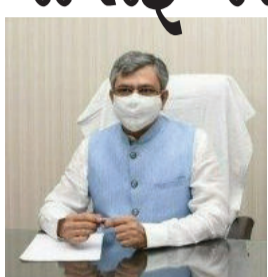
છે, તેના પરિણામો પણ આવવા લાગ્યા છે. આ સાથે તેમણે ઉમેર્યું હતું કે, ફર્સ્ટ એસીને ભાડાનો આધાર બનાવવામાં આવી રહ્યો છે.

(સિ.મી.એ), નવી દિલ્હી, તા.૩૦ દેશમાં હાલ મુંબઈ અને અમદાવાદ વચ્ચે દેશની પ્રથમ બુલેટ ટ્રેનની લાંબા સમયથી રાહ જોવાઈ રહી છે. હાલમાં જ એક કાર્યક્રમ દરમ્યાન રેલ મંત્રી અશ્વિની વૈષ્ણવે કહ્યું હતું કે, બુલેટ ટ્રેનનું સંચાલન વર્ષ ૨૦૨૬ થી શરૂ થશે. તેમણે કહ્યું કે, સરકાર મુસાફરોની સુવિધા માટે રાત-દિવસ કામ કરી રહી છે. સરકારે આ દિશામાં ઘણા પગલાં લીધા