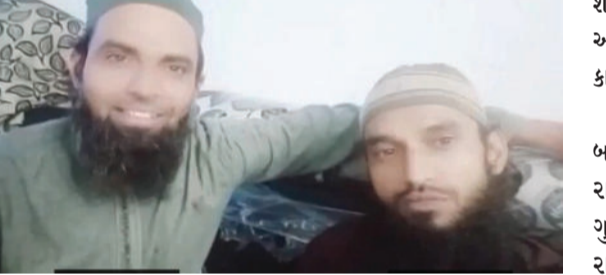
હતું. આ તરફ ડુંગરપુર જિલ્લાના રતનપુર બોર્ડરથી રાજસ્થાન તરફ જતી ગુજરાતની બસોને ગુજરાતના