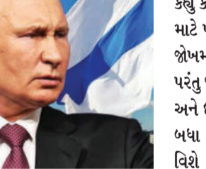
અમને એ પ્રકારની સમસ્યા નથી જે યુક્રેનથી છે. જો આ બંને દેશો નાટો સાથે જોડાવા માંગતા હોય તો બેશક જોડાઈ શકે છે. વ્લાદિમિર પુતિને

(જી.એન.એસ) રશિયા, તા.૩૦ ફિનલેન્ડ અને સ્વીડન હાલમાં જ નાટોમાં સામેલ થયા છે. જ્યારે એક દિવસ પહેલા જ તુર્કીએ સ્વીડન અને ફિનલેન્ડના નાટોમાં સામેલ થવા વિરુદ્ધ પોતાનો વીટો પાછો લઈ લીધો અને ત્રણ દેશ વચ્ચે એકબીજાની રક્ષા કરવા પર સહમતિ બની ગઈ છે. જેને લઈને પુતિને રશિયાના સરકારી ટીવી પર ઈન્ટરવ્યુમાં જણાવ્યું કે સ્વીડન અને ફિનલેન્ડથી