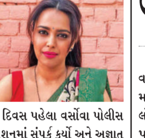
બે દિવસ પહેલા વર્સાવા પોલીસ સ્ટેશનમાં સંપર્ક કર્યો અને અજ્ઞાત લોકો સામે ફરિયાદ નોંધાવી છે. તેમણે કહ્યું કે, ફરિયાદના આધારે અમે અજ્ઞાત વ્યક્તિઓ સામે એક નોન-કોંગ્રીએબલ ગુનો નોંધ્યો છે. તેમણે કહ્યું તપાસ ચાલી રહી છે.

(એ.આર.એલ), મુંબઈ, તા.૩૦ અભિનેત્રી સ્વરા ભાસ્કરને જાનથી મારી નાખવાની ધમકી મળી છે. સ્વરા ભાસ્કરને આ ધમકી એક પત્રના માધ્યમથી મળી છે. ધમકી મળ્યા બાદ મુંબઈ પોલીસે તપાસ શરૂ કરી દીધી છે. આ જાણકારી એક અધિકારીએ બુધવારના આપી છે. અધિકારીએ કહ્યું કે, પત્ર અભિનેત્રીના વર્સાવા સ્થિત આવાસ પર મોકલવામાં આવ્યો હતો. અધિકારીએ જણાવ્યું કે, પત્ર મળ્યા બાદ સ્વરા ભાસ્કરે