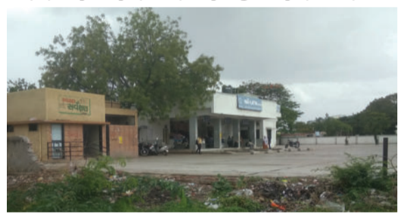
રીપેરીંગ કામ કરવામાં આવતું ન હોવાથી આજુબાજુના વેપારીઓ અને રહેવાસીઓ પણ ત્રાહિમામ પોકારી ઉઠ્યા છે.

અમરેલી તા.૩૦ લાઠી બસ સ્ટેશનમાં આવેલી દિવાલ છેલ્લા ઘણાં સમયથી ધરાશાયી થઈ ગઈ હોવાથી હવે આ જગ્યાએ ગંદકીના ગંજ ખડકાયા છે. ગંદકીના કારણે મુસાફરો ત્રાહિમામ પોકારી ઉઠ્યા છે. આ બાબતે એસ.ટી.ના ઉચ્ચ અધિકારીઓને રજૂઆત કરવામાં આવી હોવા છતાં દિવાલનું