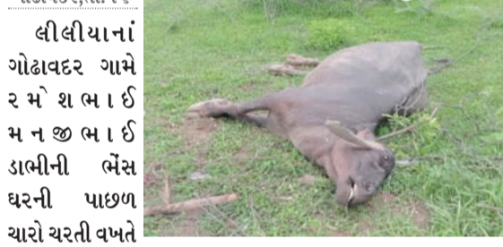
ગોઢાવદર, તા. ૧૬

લીલીયાનાં ગોઢાવદર ગામે ર મેં શ ભાઈ મ ન જ ભાઈ ડાભીની ભેંસ ઘરની પાછળ ચારો ચરતી વખતે સર્પ કરડી જતા ભેંસ થોડે દુર ભાગી જતા શરીરમાં ઝેર પ્રસરી જતા ત્યાં ને ત્યાં ઢળી પડી હતી અને મૃત્યુ પામી હતી. ભેંસના મોતથી પશુપાલકોમાં અરેરાટી પ્રસરી જવા પામી હતી.