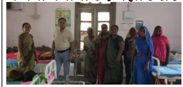
અમરેલી, તા. ૧૬

આરોગ્ય કેન્દ્રના ગામોમાં લાઠી તાલુકામાં વિશ્વ કુંટુંબ નિયોજનની પધ્ધતિ વિશે વસ્તી પખવાડીયાની ઉજવણી કરવામાં આવી હતી. તમામ આયોજન કરવામાં આવ્યું હતું.