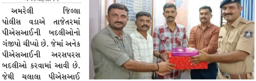
અમરેલી, તા. ૧૬

અમરેલી જિલ્લા પોલીસ વડાએ તાજેતરમાં પીએસઆઈની બદલીઓનો ગંજીયો ચીપ્યો છે. જેમાં અનેક પીએસઆઈની અરસપરસ બદલીઓ કરવામાં આવી છે. જેથી ચલાલા પીએસઆઈ ગલચરની બદલી જતા પીએસઆઈનો વિદાય સમારંભ યોજવામાં આવ્યો હતો. પોલીસ