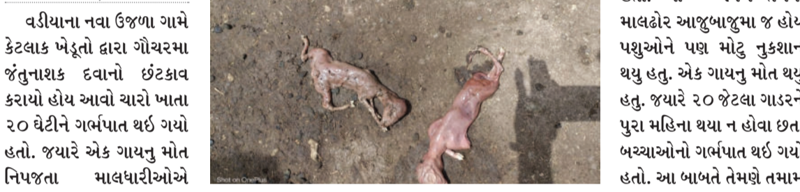
અમરેલી, તા. ૧૬

વડીયાના નવા ઉજળા ગામે કેટલાક ખેડૂતો દ્વારા ગૌચરમાં જંતુનાશક દવાનો છંટકાવ કરાયો હોય આવો ચારો ખાતાર ૨૦ ઘેટીને ગર્ભપાત થઈ ગયો હતો. જ્યારે એક ગાયનું મોત નિપજતા માલધારીઓએ મામલતદારને આવેદન આપી રોષ વ્યક્ત કર્યો હતો.