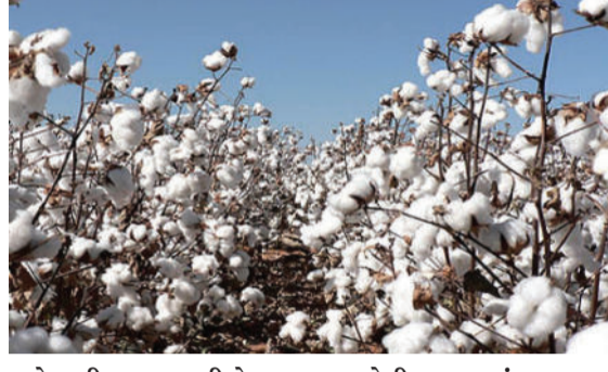
વાવેતરની વાત કરીએ તો અમરેલી તાલુકામાં ૫૮૫૬૦

૩૦૯૯૫ હેક્ટર, જાફરાબાદમાં ૯૦૮૦ હેક્ટર, ખાંભામાં ૧૪૫૩૫ હેક્ટર, લાઠીમાં ૮૧૦ હેક્ટરમાં, લીલીયામાં ૭૦૫ હેક્ટર, રાજુલામાં ૧૪૨૪૦, સાવરકુંડલામાં ૨૮૫૨૬ અને કુંકાવાવમાં ૧૭૩૫૧ હેક્ટરમાં વાવેતર નોંધાયું છે જ્યારે કપાસનું જિલ્લામાં સૌથી વધુ વાવેતર નોંધાયું છે. કપાસના