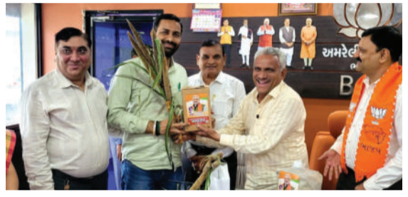
અમરેલી, તા. ૧૬