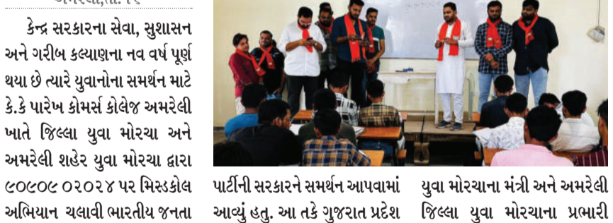
અમરેલી, તા. ૧૬

કેન્દ્ર સરકારના સેવા, સુશાસન અને ગરીબ કલ્યાણના નવ વર્ષ પૂર્ણ થયા છે ત્યારે યુવાનોના સમર્થન માટે કે.કે પારેખ કોમર્સ કોલેજ અમરેલી ખાતે જિલ્લા યુવા મોરચા અને અમરેલી શહેર યુવા મોરચા દ્વારા ૯૦૯૦૮ ૦૨૦૨૪ પર મિસ્ડકોલ અભિયાન ચલાવી ભારતીય જનતા પાર્ટીની સરકારને સમર્થન આપવામાં આવ્યું હતું. આ તકે ગુજરાત પ્રદેશ યુવા મોરચાના મંત્રી અને અમરેલી જિલ્લા યુવા મોરચાના પ્રભારી