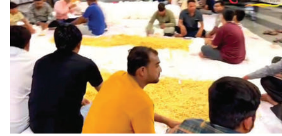
માર્ગદર્શન હેઠળ સોરઠામાં બનાવવા માટે ૬૦૦ થી વધુ જેતપુર, ગોંડલ અને રાજકોટમાં સ્વયંસેવકોની ટીમ તૈયાર કરી કંટ્રોલ રૂમ શરૂ કરી અને કુડપેકેટ સેવાયજ આરંભ્યો છે.

ખોડલધામ ટ્રસ્ટ કાગવડ દ્વારા જૂનાગઢ અને આસપાસના વિસ્તારોમાં વરસાદથી તારાજ પામેલા વિસ્તારોના લોકો માટે સેવાકીય કાર્યો કરવામાં આવી રહ્યા છે. ટ્રસ્ટ દ્વારા મુસીબતના સમયમાં જરૂરિયાતમંદોને મદદરૂપ થવાના હેતુથી ખોડલધામ ટ્રસ્ટના ચેરમેન નરેશભાઈ પટેલના સીધા