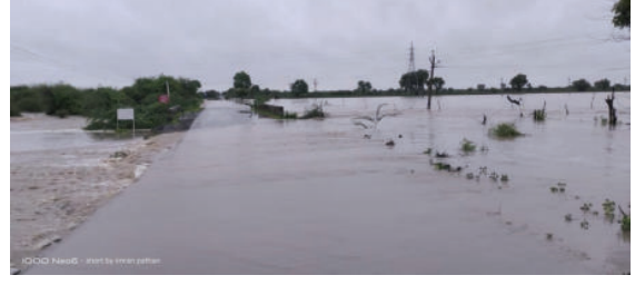
વિસ્તારમાં પૂરની પરિસ્થિતિ સર્જાઈ છે. જેમાં પણ ગઈકાલે ઘાટી-બાબરા-અમરેલી-બગસરા પૂર આવ્યું હતું. જેના કારણે લીલીયા