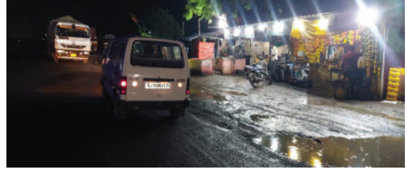
વિઝીબિલીટી ઓછી હોય છે જેથી રોડ પર પાર્ક કરેલ વાહન ન દેખાતા અકસ્માત સર્જવાની પૂરી સંભાવના રહેલી છે. ત્યારે

સાવરકુંડલા મહુવા નેશનલ હાઈવે પર આડેધડ વાહનો પાર્ક કરાતા હોવાની રાવ ઉઠી રહી છે. સાવરકુંડલાના મહુવા હાઈવે રોડ ઉપર જ વાહનો પાર્ક કરીને લોકો ચા, પાણી અને નાસ્તો કરવા જતા રહે છે. હાલ ચોમાસાનો સમય હોય ચાલુ વરસાદમાં વાહનચાલકની