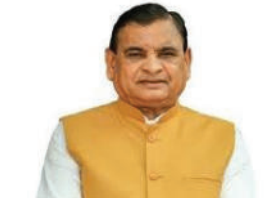
ટ્રેન મારફત દરેક વર્ગને પોસાય તેટલા ભાડામાં સોમનાથ પહોંચી શકાય છે. જો કે આ ટ્રેનમાં ખૂબ

હાલ અધિક શ્રાવણ માસ ચાલી રહ્યો છે અને લોકો શિવમંદિરોમાં ખાસ પૂજા અર્ચના માટે જઈ રહ્યા છે. ત્યારે અમરેલીના લોકો પ્રસિધ્ધ શિવતીર્થ અને પ્રથમ જ્યોતિર્લિંગ એવા સોમનાથ મહાદેવના દર્શન અર્થે સોમનાથ જાય છે. અમરેલીથી વેરાવળ જતી