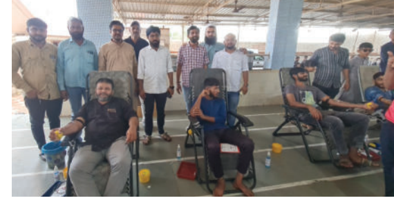
આ કેમ્પમા મુસ્લિમ સમાજના સહિત યુવાનો ઉપસ્થિત રહ્યા આગેવાનો તેમજ અગ્રણીઓ હતા. સમસ્ત મુસ્લિમ સમાજના

રાજુલા શહેરની શાહગોરા વાડી ખાતે સમસ્ત મુસ્લિમ સમાજ દ્વારા બ્લડ ડોનેશન કેમ્પનું ભવ્ય આયોજન કરવામાં આવ્યું હતું. આ બ્લડ ડોનેશન કેમ્પ ઈમામ હુસેન શહાદતની યાદમાં યોજાયો હતો. જેમાં મોટી સંખ્યામાં લોકોએ રક્તદાન કર્યું હતું.