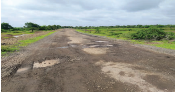
હજુ ઘણા ખેડૂતોને વળતર મળ્યું ન હોવાનો આક્ષેપ કરવામાં આવ્યો છે.

રહેલી છે. આ વર્ષે કમોસમી વરસાદે ખેડૂતોની આર્થિક કમર તોડી નાખી હતી જેના લીધે ઉનાળુ પાક સદંતર નિષ્ફળ ગયો હતો તો બિપોરજોય વાવાઝોડાની આંશિક અસરને કારણે ખેડૂતોએ કરેલા બાગાયતી પાકને પણ ભારે નુકસાન થયું હતું. રાજ્ય સરકારે કમોસમી વરસાદથી થયેલા નુકસાનને કારણે આંશિક વળતર આપ્યું છે જો કે