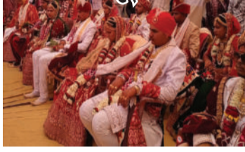
વચ્ચે ઉદારદિલ દાતાઓના સહયોગ અન સીતારામ સેવક સમુદાયનાં ભવ્ય આયોજનથી ૨૩મા સર્વજ્ઞાતિ સમૂહ

દામનગર ગુરુમુખી સંત દયારામબાપુ પ્રેરિત સીતારામ આશ્રમ ખાતે ૨૩મો સર્વજ્ઞાતિ સમૂહ લગ્નોત્સવ ભવ્ય રીતે સંપન્ન થયો હતો. આ લગ્નોત્સવમાં ૨૦ નવદંપતીઓને અનેક વરિષ્ઠ સંતોના આશિષ પ્રાપ્ત થયા હતા. હજારોની માનવ મેદની