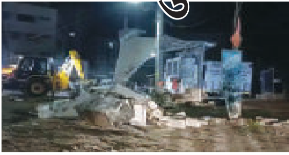
મંદિરોનું પણ દબાણ દૂર કરવામાં આવી રહ્યું છે. જૂનાગઢના તળાવ દરવાજા પાસે આવેલ જલારામ મંદિર પણ તોડી પડાયું છે. એટલુ જ નહીં રેલવે સ્ટેશન રોડ પર આવેલા રામદેવપીરનું મંદિર

(એ.આર.એલ), જૂનાગઢ, તા. ૧૦ રાજ્યમાં અવારનવાર ડિમોલિશનની પ્રક્રિયા હાથ ધરવામાં આવતી હોય છે. ત્યારે આવી જ એક ઘટના જૂનાગઢમાં બની છે. જૂનાગઢમાં ધાર્મિક સ્થળો પર મનપા તંત્ર દ્વારા ડિમોલિશન કરવામાં આવી રહ્યું છે. જૂનાગઢના મજેવડી દરવાજા પાસે આવેલી દરગાહ તોડી પાડવામાં આવી છે. આ ઉપરાંત હિન્દુ ધર્મના