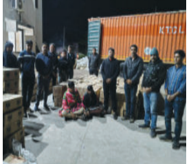
આવ્યું હતું. જેની તલાશી લેતા જેમાંથી ૨૮.૯૬ લાખનો વિદેશી શરાબનો જથ્થો મળી આવ્યો હતો. હરિયાણાથી આવતા રાજસ્થાનના

(એ.આર.એલ), મહેસાણા, તા. ૧૦ મહેસાણા એલસીબીએ દારૂ ભરેલા કન્ટેનરને ઊંઝાના ઉનાવા નજીકથી ઝડપી પાડ્યું છે. હરિયાણાથી ગુજરાતમાં ઘુસાડવામાં આવતા દારૂ અંગેની ખાતમી મળવાને લઈ એલસીબીએ ઊંઝા હાઈવે પર વોચ ગોઠવી હતી. એસપી ઋષિકેશ ઉપાધ્યાયની સૂચના અનુસાર માર્ગ પર વોચ રાખતા એક શંકાસ્પદ કન્ટેનર ઝડપાઈ