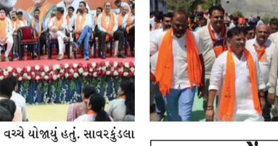
કાછડીયાની વિશેષ ઉપસ્થિતિ વચ્ચે યોજાયું હતું. સાવરકુંડલા

દિલીપ સંઘાણી, નારણ કાછડીયા સહિતના નેતાઓએ યોજાયું વિજય વિશ્વાસ સંમેલન