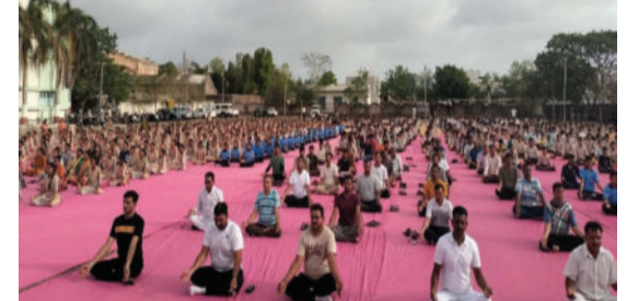
અધિકારી, મામલતદાર, પાલિકા બાળકો અને ૫૦૦થી વધુ લોકો આ યોગ દિવસની ઉજવણીમાં હાજર રહ્યાં હતાં.

બગસરા શહેરમાં ૧૦મો વિશ્વ યોગ દિવસ ભવ્ય રીતે ઉજવવામાં આવ્યો હતો. આ ઉજવણી મેઘાણી હાઈસ્કૂલ ખાતે રમતગમત, યુવા અને સાંસ્કૃતિક વિભાગ દ્વારા કરવામાં આવી હતી. તાલુકા વહીવટી તંત્ર બગસરા દ્વારા આયોજનને સફળ બનાવવા માટે ખૂબ મોટો સહયોગ આપવામાં આવ્યો હતો. આ કાર્યક્રમમાં પ્રાંત