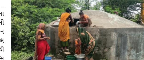
કરવામાં આવી નથી. જેના કારણે માલગામની મહિલાઓ પાણી બાબતે ભારે પરેશાન છે. આ બાબતે માલગામ ગ્રામ

કોડીનાર તાલુકાના માલગામને પાણી પૂરું પાડતી જામવાળા ડેમની પાઈપ લાઈન નેશનલ હાઈવે દ્વારા ટોલ નાકાના કામ દરમિયાન તોડી નાખી હતી. આ વાતને બે માસ વીતી ગયા પણ આ પાઈપ લાઈન હાઈવે ઓથોરિટી દ્વારા રિપેર કરવામાં આવી નથી. તો પાણી પુરવઠા બોર્ડ કોડીનાર દ્વારા પણ કોઈ કામગીરી