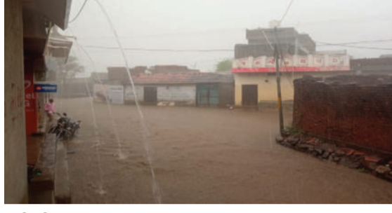
લાઠીમાં ૨૮ મીમી, અમરેલીમાં ૩ મીમી, બગસરામાં ૧ મીમી, ધારીમાં ૧૫ મીમી, ખાંભામાં ૬ મીમી, રાજુલામાં ૩ મીમી, વરસાદ નોંધાયો હતો. જો કે લીલીયાના ગ્રામ્ય પંથક મોટા કણકોટ ગામે પાંચ ઈંચ જેટલો વરસાદ નોંધાયો હોવાનું જાણવા મળ્યું છે. કોટડાપીઠામાં પણ વાવણીલાયક વરસાદ વરસ્યો હતો. જ્યારે ધારીના ગોવિંદપુર, દલખાણીયા, માલસીકા સહિતના ગામોમાં પણ ભારે વરસાદ થતા ખોડીયાર કેમમાં નવા નીરની આવક નોંધાઈ હતી. જિલ્લામાં મેઘરાજાના આગમનથી ખેડૂતોના ચહેરા પર ખુશીનો માહોલ છવાયો છે.

સાવરકુંડલામાં ૪૩ મીમી વરસાદથી નાવલી નદીમાં નવા નીર તો ખોડીયાર કેમમાં પણ નવા પાણીની આવક નોંધાઈ