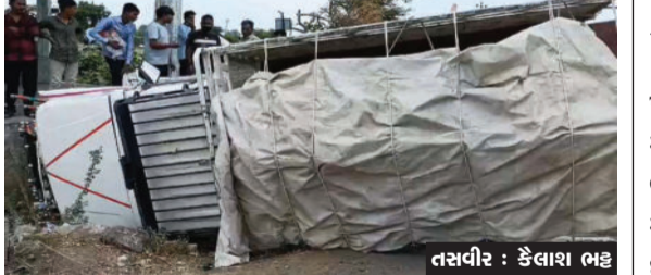
સારવાર અર્થે ઉના ખાનગી હોસ્પિટલ ખસેડવામાં આવ્યો હતો. અકસ્માતમાં બોલરો બેઠેલા દસથી વધુ લોકોનો આબાદ બચાવ થયો

ઉના ગીરગઢડા રોડ પર આવેલ જરગલી ગામનાં પાટિયા પાસે ધોળીવાવ નામે ઓળખાતી જગ્યા પર એક બોલરો ચાલકે સ્ટેડીંગ પરનો કાષુ ગુમાવી દેતા પલ્ટી ખાઈ ગયો હતો. જેમાં બેઠેલા તમામ લોકોનો આબાદ બચાવ થયો હતો. આ અકસ્માતમાં ત્યાંથી પસાર થતા એક બાઈક ચાલકને ઈજા પહોંચતા ઈમરજન્સી ૧૦૮ અમ્બ્યુલન્સમાં