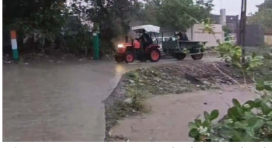
દરમિયાન સાવરકુંડલામાં ૪૩ મીમી જેટલો વરસાદ નોંધાયો હતો તો કુંકાવાવ-વડીયામાં ૮ મીમી, બાબરામાં ૭ મીમી,

અમરેલી, તા. ૨૩ અમરેલી જિલ્લામાં આજે મેઘરાજાનું ધમાકેદાર આગમન થયું હતું. છેલ્લાં ઘણા દિવસથી જિલ્લાવાસીઓ સારા વરસાદની રાહ જોઈ રહ્યાં હતાં. ખેડૂતોએ ચોમાસુ પાકનું વાવેતર કરી નાખ્યું હોય ત્યારે આ વરસાદ ખેતીપાક માટે કંચનરૂપી વરસાદ વરસતા ખેડૂતોમાં આનંદની લાગણી પ્રસરી જવા પામી છે. અમરેલી જિલ્લાના ખેડૂતો છેલ્લાં ઘણા દિવસથી સારા વરસાદ માટે મેઘરાજાને વિનવણી કરતા હતા ત્યારે આજે મેઘરાજાએ ખેડૂતોની વિનવણી સાંભળી હોય તેમ ક્યાંક ધોધમાર તો ક્યાંક ધીમીધારે વરસાદનું આગમન થયું હતું. આજે દિવસ