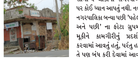
લોકો એવો પણ આક્ષેપ કરી રહ્યા છે કે જ્યાં શાસક પક્ષના લોકો રહે છે ત્યાં તાત્કાલિક કામગીરી કરવામાં આવે છે, જ્યારે સામાન્ય લોકોની સમસ્યાઓ પર કોઈ ધ્યાન આપતું નથી. નવી નગરપાલિકા બન્યા પછી 'પહેલાં અને પછી' ના ફોટા ચુપમાં મૂકીને કામગીરીનું પ્રદર્શન કરવામાં આવતું હતું, પરંતુ હવે તે પણ બંધ કરી દેવામાં આવ્યું છે. આ બધી બેદરકારીથી લોકો ખૂબ જ નારાજ છે અને પાલિકા પાસેથી ઝડપથી કાર્યવાહીની માંગ કરી રહ્યા છે.

બાબરા, તા. ૨૩ બાબરા શહેરમાં ગટરના ઠાંકણ ગાયબ રહેવાના અને ગટરનાં પાણી રસ્તા પર વહેતા રહેવાના મુદ્દાએ લોકોમાં ભારે રોષ ફેલાયો છે. થોડા દિવસો પહેલા, ચમારડીના ઝાંપા પાસે ખુલ્લી ગટરમાં બે બહેનો એકિટવા સહિત પડી ગઈ હતી, જેમાં તેમને ઈજા પણ થઈ હતી. આવી ઘટનાઓ વારંવાર બનતી હોવા છતાં, પાલિકા દ્વારા કોઈ કાર્યવાહી કરવામાં આવી રહી નથી. લોકોના આરોપ છે કે ખુલ્લી ગટરની આસપાસ કોઈ બેરીકેડ પણ મૂકવામાં આવતા નથી, જેના કારણે અકસ્માતોનો ભય રહે છે. આ ઉપરાંત, શહેરમાં ઘણી સ્ટ્રીટ લાઈટો બંધ છે, વારંવાર રજૂઆત કરવા છતાં કચરાપેટી તુટી ગયેલી હોવા છતાં બદલાવવામાં આવતી નથી.