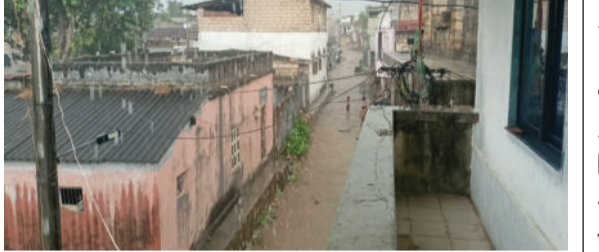
વરસાદ ખાબક્યો હતો. જેથી રસ્તાઓ પર પાણી વહેતા થયા હતા અને લોકોને ગરમીથી રાહત મળી

કોડીનાર તાલુકાના ડોળાસા ગામે સીઝનનો પ્રથમ વરસાદ પડ્યો હતો. જેથી ખેડૂતોમાં ખુશીનો માહોલ છવાયો હતો. લાંબા સમયથી બકારો અને ઉકળાના કારણે અહીંના લોકો અકળાઈ ઉઠ્યા હતા. બપોર બાદ વાતાવરણમાં પલટો આવ્યો હતો અને ધીમી ધારે વરસાદ બાદ એકદમ ધોધમાર