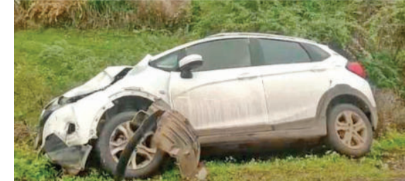
અકસ્માતમાં કોઈપણ પ્રકારની ઈજા પહોંચી છે. અકસ્માતમાં જાનહાનિ થઈ નથી, પરંતુ ફોરવ્હીલને વધુ પ્રમાણમાં નીલગાયના બે પગમાં ગંભીર નુકસાન થયું છે.

આજે ધારી તાલુકાના ચલાલાથી ગોપાલગ્રામ જતા રસ્તા પર એક અકસ્માત સર્જાયો હતો. જ્યાં એક ફોરવ્હીલ અને નીલગાય વચ્ચે અકસ્માત થયો હતો. અકસ્માતના સમાચાર મળતા સ્થાનિક લોકો ઘટનાસ્થળે દોડી આવ્યા હતા. સદનસીબે આ