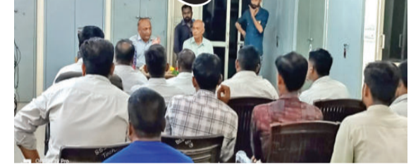
કરવામાં આવ્યું હતું. જેમાં ઈજનેર ઠેસીયાભાઈના માગદર્શન નીચે જે કર્મચારીઓ રાત દિવસ જોયા વગર નિષ્ઠાપૂર્વક પોતાની ફરજ બજાવી જીવના જોખમ કોઈપણ ઋતુમાં વીજપુરવઠો જળવાઈ રહે

ગુણવત્તા જોખમ કામગીરી કરનાર કર્મચારીઓની કામગીરીની નોંધ લઈ તેમને બિરદાવ્યા અમરેલી, તા. ૧૯ અમરેલી જિલ્લાના બાબરા ખાતે પીજીવીસીએલના કર્મચારીઓનું સન્માન કરવા માટે એક વિશેષ કાર્યક્રમનું આયોજન