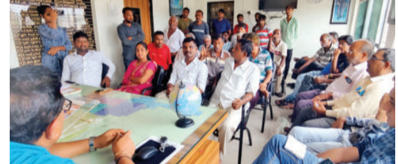
આપવામાં આવી હતી. સફાઈ કામદારો દ્વારા લઘુત્તમ વેતન મુજબ પગાર ચૂકવવાની માંગણી પણ સ્વીકારવામાં આવી હતી.

પગાર અને પેન્શનમાં થયેલ વિલંબ બદલ ચિંતા વ્યક્ત કરવામાં આવી હતી. પાલિકા દ્વારા પેન્શનરોને બે મહિનાનું તાત્કાલિક પેન્શન ચૂકવવામાં આવ્યું હતું, જેનાથી તેમને રાહત મળી હતી. આગામી મહિનામાં બાકીના ત્રણ મહિનાનું પેન્શન તેમજ નિયમિત પેન્શન ચૂકવવાની બાંહેધરી ચીફ ઓફિસર અને પ્રમુખ દ્વારા