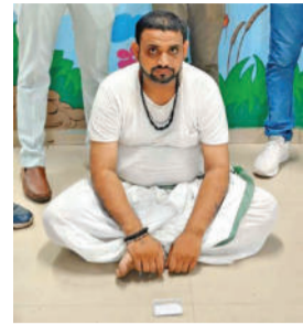
જણાવ્યા અનુસાર, ફરિયાદી તાઈવદર ગામના રહેવાસી છે.