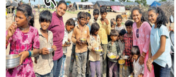
પર્વ પર ઉદારતા ચેરીટેબલ ટ્રસ્ટ દ્વારા સાવરકુંડલામાં આવેલા અલગ-અલગ ઝૂંપડપટ્ટી વિસ્તારોમાં જરૂરિયાતમંદ લોકોને ખારેકનું વિતરણ કરવામાં આવ્યું હતું. ઉપરાંત બાળકોને શિક્ષણમાં

સાવરકુંડલા, તા. ૧૯ દેવશયની એકાદશી- અગિયારસ એ હિન્દુ ધર્મમાં એક મહત્વપૂર્ણ વ્રત, દિવસ-તહેવાર છે, જે અષાઢ મહિનાના શુકલ પક્ષની એકાદશીના રોજ મનાવવામાં આવે છે. એકાદશી પર કરવામાં આવેલા ઉપાય, પૂજા, મંત્ર જાપ વગેરે સુખ, સમૃદ્ધિ લાવે છે. મા લક્ષ્મીના આશીર્વાદ મળે છે. આ એકાદશીના