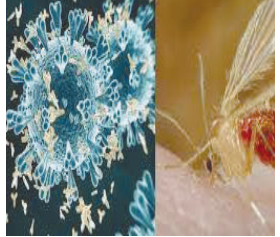
સારવાર દરમિયાન દમ તોડી દેતાં પરિવારમાં શોકની લાગણી જોવા મળી રહી છે. સયાજી હોસ્પિટલમાં હાલમાં ૭ બાળક સારવાર હેઠળ છે,

વાઈરસના કુલ કેસની સંખ્યા વધીને ૬૨ થઈ છે, જ્યારે મૃત્યુઆંક વધીને ૨૧ થયો છે. આજે વડોદરાની સયાજી હોસ્પિટલમાં ચાંદીપુરા વાયરસથી વધુ એક ૪ વર્ષના બાળકનું મોત થયું છે. શહેરના ગોત્રી વિસ્તારમાં મહાલક્ષ્મીનગરમાં રહેતા ૪ વર્ષના બાળકની ૧૮ જુલાઈથી શંકાસ્પદ ચાંદીપુરા વાયરસની સારવાર ચાલી રહી હતી, જોકે,