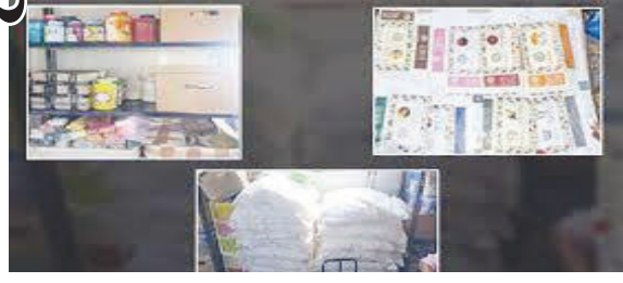
ખોરાક અને ઔષધ નિયમન તંત્રના કમિશનર કોશિયાએ વિગતો આપતા જણાવ્યું હતું કે, કોસ્મેટિકના કોઈપણ લાયસન્સ વગર ભ્રામક અને લોકોને ગેરમાર્ગે દોરતી જાહેરાત

(એ.આર.એલ), ભાવનગર, તા. ૨૦ ભાવનગર ખાતે વગર પરવાને વિવિધ કોસ્મેટિક સાબુની બનાવટી ફેક્ટરી પકડી પાડવામાં આવી છે અને શંકાસ્પદ કોસ્મેટિકના ૪ નમૂના લઈ ચકાસણી માટે મોકલી આશરે ૬૦ હજારની કિંમતનો કોસ્મેટિકનો મુદ્દામાલ જપ્ત કરાયો છે. અત્યાર સુધીમાં એમેઝોન મારકેટ આશરે રૂપિયા ૩.૫૦ લાખના વિવિધ બ્રાંડના ૧૮૦૦ સાબુનું વેચાણ કર્યું હોવાનો પણ ઘટસ્ફોટ થયો છે.