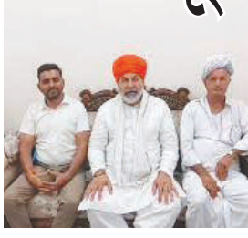
વાત એ છે કે જમીનનું પૂરતું વળતર મળી રહ્યું નથી. ખેડૂતોની મુખ્ય રજૂઆતોમાં સુજલામ સુકલામ કેનાલમાં પાણી છોડવા બાબતે તેની સાથે સાથે એએનજીસી

વિવિધ મુદ્દાઓ સાથે દિલ્હી ખાતે ખેડૂત આગેવાન રાકેશ ટીકેત સાથે મુલાકાત કરવામાં આવી હતી જેમાં પાલનપુરની બાજુમાં બાયપાસ રોડ બની રહ્યો છે જેમાં ૧૫૦૦ જેટલા ખેડૂતોની જમીન લેવામાં આવી રહી છે. ૫૦૦ સર્વે નંબરો એવાં છે કે જેમાં જમીન લઈ લેવામાં આવશે તો ૧૦૦ જેટલા ખેડૂતો જમીન વિહોણા થઈ જશે. ૬૦ જેટલા પાણીના બોર પણ નીકળી જશે, મહત્વની