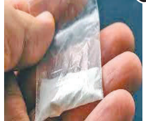
શરૂ કરી છે. લાલગેટ પોલીસને ભાતમી મળી હતી કે ભગ્યાની દુકાન, પાનના ગલ્લાની આડમાં

સુરત, તા. ૨૦ સુરતમાં ડ્રગ્સ મળવાનો સિલસિલો યથાવત છે ત્યારે લાલગેટ પોલીસે ભાતમીના આધારે ૩ આરોપીઓને ઝડપી પાડ્યા છે, આરોપીઓ પાનના ગલ્લાની આડમાં એમડી ડ્રગ્સનો ધંધો કરતા હતા. પોલીસે ૧૦ લાખનો મુદ્દામાલ ઝડપી પાડ્યો છે અને એનડીપીએસ એક્ટ મુજબનો ગુનો નોંધી તપાસ