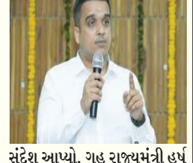
સંદેશ આપ્યો. ગુડ રાજ્યમંત્રી હર્ષ સંઘવીએ નિવેદન આપતા કહ્યું કે, વડોદરા શહેરમાં સલીમ સુરેશ બનીને બહાલી દીકરીને ફસાવે છે તેમના વિરૂદ્ધ કાર્યવાહી ચાલુ છે. એક પણ આવા વ્યક્તિને છોડવામાં નહિ આવે. દીકરીઓને ફસાવવા માટે આ લોકો પ્રયાસ કરી રહ્યા છે. આવા કોઈ પણ પરિવાર કે દીકરી હોય તો પોલીસને જાણ કરો. પ્રેમના પવિત્ર સંબંધને બદનામ થતાં રોકવાની જવાબદારી આપણી બધાની છે. કોઈ સલીમ સુરેશ બનીને કે કોઈ સુરેશ સલીમ બનીને દીકરીઓને ફસાવે તો તેને છોડતા નહિ.

ગુડ રાજ્યમંત્રી હર્ષ સંઘવીએ લવ જેહાદ પર મોટું નિવેદન આપ્યું છે. વડોદરામાં એક કાર્યક્રમ દરમિયાન સંઘવીએ કહ્યું કે, કોઈ સલીમ સુરેશ બનીને કે સુરેશ સલીમ બનીને દીકરીઓને ફસાવશે તો તેને નહીં છોડવામાં આવે. એક પણ આવા વ્યક્તિને છોડવામાં નહીં આવે. પ્રેમના પવિત્ર સંબંધને બદનામ થતા રોકવાની જવાબદારી આપણી છે. માતા-પિતા દીકરીઓને સમજ આપે, જેથી આવા બનાવ ન બને. લહજેહાદના સતત વધી રહેલા કિસ્સાઓને પગલે હર્ષ સંઘવી આકરા પાણીએ જોવા મળ્યા હતા. ગુડ રાજ્યમંત્રી હર્ષ સંઘવી આજે વડોદરાની મુલાકાતે આવ્યા હતા અને ભાજપ કાર્યાલય પર કોર્પોરેટરો સાથે બેઠક કરી હતી. આ પ્રસંગે હર્ષ સંઘવીએ સંબોધનમાં લવ જેહાદ કરનારાઓને કડક ભાષામાં