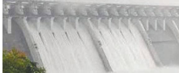
૨,૧૨,૧૫૬ એમ.સી.એફ.ટી. એટલે કે કુલ સંગ્રહ શક્તિના ૩૭.૮૭ ટકા જેટલો જળસંગ્રહ નોંધાયો છે તેમજ, જળ સંપતિ

(એ.આર.એલ), ગાંધીનગર, તા. ૨૦ રાજ્યમાં વરસી રહેલા વરસાદના પરિણામે ગુજરાતની જીવાદોરી સમાન સરદાર સરોવર યોજનામાં જળસંગ્રહ ૫૫ ટકાને પાર કરી ગયો છે. સરદાર સરોવરમાં હાલમાં ૧,૮૩,૬૬૦ એમ.સી.એફ.ટી. એટલે કે કુલ સંગ્રહ શક્તિના ૫૫ ટકા જેટલો જળસંગ્રહ જ્યારે આ સિવાય રાજ્યના કુલ ૨૦૬ જળાશયોમાં