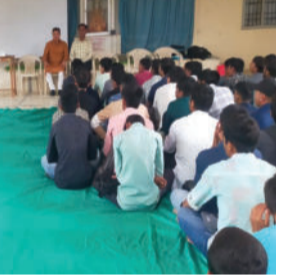
સત્રમાં જણાવ્યું કે, "આ પ્રકારના કાર્યક્રમો વિદ્યાર્થીઓના સર્વાંગી વિકાસ માટે અત્યંત મહત્વપૂર્ણ છે. અમે આગામી સમયમાં પણ આવા મૂલ્યવર્ધક કાર્યક્રમોનું આયોજન કરવામાં આવ્યું હતું.

સાવરકુંડલા, તા.૦૫ સાવરકુંડલા શહેરમાં આવેલ વી.ડી.કાણકિયા આર્ટ્સ એન્ડ એમ. આર. સંઘથી કોમર્સ કોલેજ ખાતે ગઈકાલે એક મહત્વપૂર્ણ શૈક્ષણિક કાર્યક્રમનું આયોજન કરવામાં આવ્યું હતું. સિક્વોરિટીઝ એન્ડ એક્સચેન્જ બોર્ડ ઓફ ઈન્ડિયા (SEBI) અને નેશનલ ઈન્સ્ટિટ્યૂટ ઓફ સિક્વોરિટીઝ માર્કેટ્સ (NISM)ના સંયુક્ત ઉપક્રમે બી.કોમ.ના વિદ્યાર્થીઓ માટે એક સેમિનાર અને ક્વિઝ સ્પર્ધાનું આયોજન કરવામાં આવ્યું હતું.