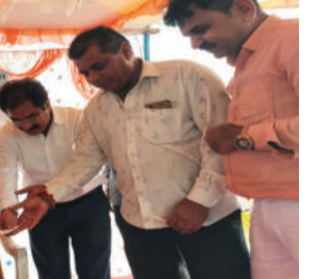
વિસ્તારમાં રહેતા જરૂરિયાતમંદ બાળકોને ફ્રી શિક્ષણ પૂરું પાડી તેમની દરેક જરૂરિયાત પૂરી કરી રહ્યું છે. આ સેવાકીય કાર્યમાં જે

સાવરકુંડલામાં આવેલ ઉદારતા ચેરિટીબલ ટ્રસ્ટ દ્વારા જરૂરિયાતમંદ બાળકોને ફ્રી શિક્ષણ પૂરું પાડવાના અભિયાનને એક વર્ષ પૂર્ણ થતાં તેમના બાળકો દ્વારા સાંસ્કૃતિક કાર્યક્રમ અને મહાનુભાવોના સન્માન કાર્યક્રમની ઉજવણી થઈ હતી. આ ટ્રસ્ટ સાવરકુંડલાના છેવાડાના