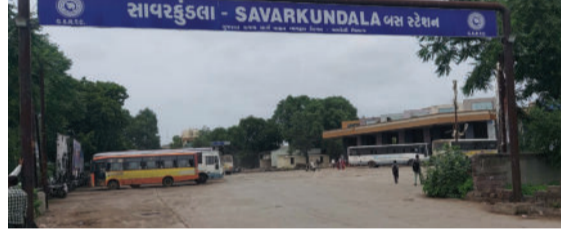
કે ઘણી ફોર્મલ પ્રોસિડરને અને આ નામ નિર્દેશન દર્શાવતું બોર્ડ પ્રવેશદ્વાર પર લગાવવામાં આવ્યું છે. જો કે આ નામનિર્દેશન દર્શાવતું બોર્ડ લગાવવાથી સાવરકુંડલા એસ.ટી. ડેપોની શોભામાં અભિવૃદ્ધિ થયેલી જોવા મળે છે. આ બોર્ડ લગાવવા માટે અવારનવાર વર્તમાન પત્રોમાં સમાચાર પ્રકાશિત થયા હતાં.

તોકતે વાવાઝોડામાં બોર્ડ ક્ષતિગ્રસ્ત થતાં ઉતારી લેવાયું હતું સાવરકુંડલા તા. ૦૫