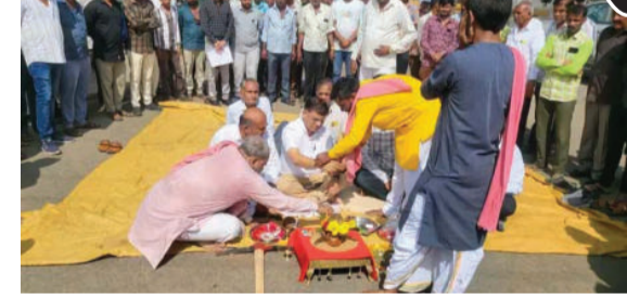
કાર્યનું ખાતમુહૂર્ત કરવામાં આવ્યું હતું. આ દરમિયાન જિલ્લા

સાવરકુંડલા તાલુકાના શેલણા, ઠવી, વીરડી, ભોંકરવા ગામને જોડતા રસ્તાનું રૂપિયા ૪.૫ કરોડના ખર્ચે થનાર નવીનીકરણ