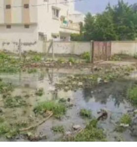
યોમાસાની જરૂર હોવાને કારણે રોગચાળો પણ ફાટે તેવી ભીતિ સર્જાઈ છે. ત્યારે રહિશોએ આ સમસ્યામાંથી છૂટકારો મેળવવા પાલિકાને રજૂઆત કરી છે. આ વિસ્તારમાં દુર્ગંધ રહ્યા છે, જેના કારણે લોકો ત્રાહિમામ પોકારી ઉઠ્યા છે.

અમરેલી, તા. ૧૨ સાવરકુંડલા શહેરમાં આવેલા જેસર રોડ ઉપર રેસિડેન્સી વિસ્તાર આવેલો છે, જ્યાં મંગલમ સોસાયટી, પટેલ સોસાયટી સહિત આસપાસના સોસાયટી વિસ્તારમાં ગટરના ગંદા પાણી ઉભરાઈ રહ્યા છે. જેથી રહીશો ભારે મુશ્કેલીનો સામનો કરી રહ્યા છે. હાલ