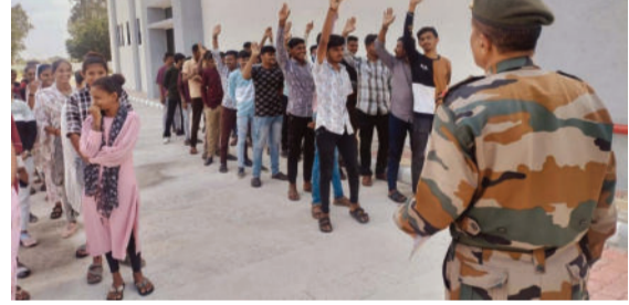
વિદ્યાર્થીઓ, પ્રોફેસર, લીલીયા વિસ્તારના લોકોમાં ખુશીનો