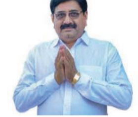
અમરેલી, તા. ૧૨

બે માર્ગો મંજૂર કરવામાં આવ્યા છે. જેમાં ભાડથી નાના વિસાવદરના પાટીયા સુધી અંદાજે ૨.૫૦ કિ.મી. માર્ગ