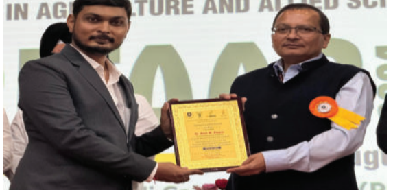
અખતરાઓમાં નવીન ટેકનોલોજી અને બેક્ટીરીયો જરૂરીયાતોને ધ્યાને લઈ ઉમદા કામગીરી બદલ આં. રા. કોન્ફરન્સમાં યંગ સાયન્ટિસ્ટ એવોર્ડ ભારત સરકારનાં એગ્રીકલ્ચર કમીશનર ડો. પી.કે. સિંહનાં હસ્તે આપવામાં આવ્યો હતો. ડો. એ. એમ.

અમરેલી, તા. ૧૨ આંતરરાષ્ટ્રીય કોન્ફરન્સનું ગુરુકાશી યુનિ. ભટીડા ખાતે આયોજન કરવામાં આવ્યું હતું. આ કોન્ફરન્સનો વિવિધ ક્ષેત્રોમાંથી એગ્રીકલ્ચરનાં વૈજ્ઞાનિકો હાજર રહ્યા હતાં. જેમાં પાકનું કઈ રીતે રક્ષણ કરી રીતે કરી શકાય તે અંગે ચર્ચાઓ કરવામાં આવી હતી. આ કોન્ફરન્સમાં જૂનાગઢ કૃષિ યુનિ. નાં કપાસ સંશોધન કેન્દ્રનાં ડો. એ.એમ. પોલરા કે જેઓ રાજ્યનાં સ્ટેટ લેવલ સંશોધન અખતરાઓનાં સંશોધનનું કાર્ય નિભાવી રહ્યા હોય ત્યારે કપાસનાં એગ્રોનોમિ