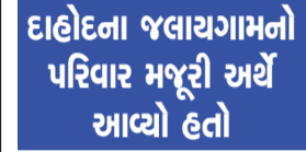
સાવરકુંડલા, તા. ૧૨