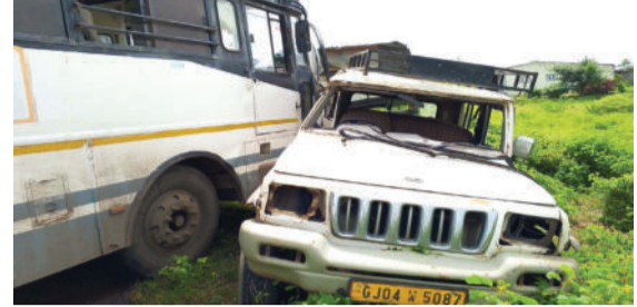
નજીક માર્ગતિનંદન ઠોલ પાસે વચ્ચે અકસ્માત સર્જાયો હતો. બસ અને બોલેરો સાવરકુંડલા-મહુવા રૂટની બસ

અમરેલી, તા. ૧૨ સાવરકુંડલાનાં હાડીડા ગામ નજીક બોલેરો અને બસ વચ્ચે અકસ્માત સર્જાયો હતો. જાણવા મળતી માહિતી મુજબ સાવરકુંડલાના હાડીડા ગામ