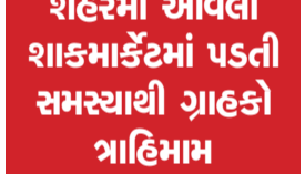
બગસરા, તા. ૧૨

બગસરા નગરપાલિકા સંચાલિત અલીપીર શાકમાર્કેટમાં રેકડી ધારકોના વધતા દબાણે ગંભીર સમસ્યા ઊભી કરી છે. માર્કેટના બંને બાજુના હલાણ પર રેકડી ધારકોએ કબજો જમાવતા,