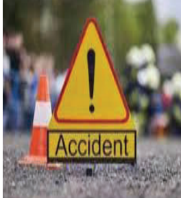
મૂતદેહોને પોસ્ટમોર્ટમ માટે અંબજોગાઈની સરકારી હોસ્પિટલમાં મોકલી આપ્યા

મહારાષ્ટ્ર, તા. ૨૨ બીડ જિલ્લાના અંબાજોગાઈ-લાતુર રોડ પર નંદગાંવ પાટી પાસે રવિવારે સવારે એક સ્વિક્ટ કાર અને કન્ટેનરની ટક્કર થઈ હતી. આ અકસ્માતમાં ચાર લોકોના ઘટનાસ્થળે જ મોત થયા હતા. વરદાપુર પોલીસ સ્ટેશનની ટીમ ઘટનાસ્થળે પહોંચી હતી અને તમામ