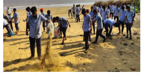
ગાળીયા અને ધોરણ ૧૧ / ૧૨ ના વિદ્યાર્થી ભાઈઓ-બહેનો દ્વારા ભવાની માતાના મંદિરના કાંઠા વિસ્તારમાં તમામ જગ્યાએ સ્વચ્છતા અભિયાન અંતર્ગત કામગીરી કરવામાં આવી હતી.