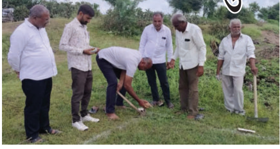
કમ્પોસ્ટ પીટ, સોકપીટ, શેડીંગેશન શેડ તથા ડોર ડુ ડોર કચરાના વ્યવસ્થાપન માટે સફાઈ સાધનો વિગેરેનું નિર્માણ થઈ રહ્યું છે, ત્યારે આજના દિવસે ૧૩૧ સામૂહિક કમ્પોસ્ટ પીટ, ૭૦ વ્યક્તિગત કમ્પોસ્ટ પીટ, ૨૩૦ સામૂહિક સોકપીટ, ૧૨૪ વ્યક્તિગત સોકપીટ, ૪૦ શેડીંગેશન શેડ તથા ૩ EWATs મળીને કુલ ૫૮૮ કામોનું ખાતમુહૂર્ત કરવામાં આવ્યું હતું.

અમરેલી, તા. ૨૨ સ્વચ્છતા હી સેવા - ૨૦૨૪ કાર્યક્રમ અન્વયે સમગ્ર જિલ્લાના ગામોને સ્વચ્છ અને લોકોને સ્વચ્છ બનાવવા ઝુંબેશ શરુ છે. દૈનિક વિવિધ કાર્યક્રમો દ્વારા નાગરિકોમાં સ્વચ્છતા માટે આદત કેળવાય, નાગરિકો સ્વચ્છ રીતે વ્યક્તિગત અને સામૂહિક રીતે સ્વચ્છતા રાખવા અને જાળવવા પ્રેરિત થાય તે આ કાર્યક્રમનો મુખ્ય