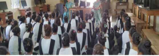
(શ્રીધર કન્સલ્ટિંગ) દ્વારા વિદ્યાર્થીનીઓને POCSCO એક્ટની જોગવાઈઓ અને તેના મહત્વ વિશે સમજાવવામાં આવ્યું હતું. સેમિનારમાં એ વાત પર ભાર મૂકવામાં આવ્યો કે ભારતમાં યૌન શોષણના લાખો કેસ નોંધાય છે અને ગુજરાતમાં ૨૦૨૩-૨૪માં