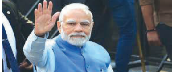
મોદીએ શનિવારે વિલ્મિંગ્ટનમાં જાપાનના વડાપ્રધાન ફ્યુમિયો કિશિદા અને ઓસ્ટ્રેલિયાના વડાપ્રધાન એન્થોની અલ્બેનિસ સાથે મુલાકાત કરી હતી. તમને જણાવી દઈએ કે અમેરિકી રાષ્ટ્રપતિ જો બાઈડેન

વોશિંગ્ટન, તા. ૨૨ વડાપ્રધાન નરેન્દ્ર મોદી આ દિવસોમાં ક્વાડ સમિટમાં ભાગ લેવા માટે અમેરિકામાં છે. આ કોન્ફરન્સની સાથે સાથે તેઓ જાપાનના વડાપ્રધાન ફ્યુમિયો કિશિદા અને ઓસ્ટ્રેલિયાના પીએમ એન્થોની અલ્બેનિસને પણ મળ્યા હતા. પીએમ મોદીએ ઈન્ડો-પેસિફિક ક્ષેત્રમાં શાંતિ, સમૃદ્ધિ અને સ્થિરતા જાળવવા અને પરસ્પર સહયોગને ગાઠ બનાવવા અંગે પણ વિચારોનું આદાન-પ્રદાન કર્યું હતું.