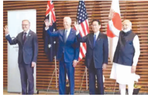
વડાપ્રધાન નરેન્દ્ર મોદીએ કહ્યું, 'મારા ત્રીજા કાર્યકાળમાં આ ક્વાડ સમિટમાં ભાગ લઈને હું અત્યંત ખુશ છું. ૨૦૨૧ની પ્રથમ ક્વાડ સમિટ તમારા

તકનીકો, આબોહવા પરિવર્તન અને ક્ષમતા નિર્માણ જેવા ક્ષેત્રોમાં ઘણી સકારાત્મક અને સમાવિષ્ટ પહેલ કરી છે. કહ્યું, 'અમારો સ્પષ્ટ સંદેશ છે - ક્વાડ અહીં રહેવા, મદદ કરવા, ભાગીદાર અને પૂરક બનવા માટે છે.' આ દરમિયાન પીએમ મોદીએ રાષ્ટ્રપતિ બાઈડેન અને તેમના તમામ સહયોગીઓને આ સંમેલન માટે અભિનંદન પાઠવ્યા હતા. ૨૦૨૪માં ભારતમાં ક્વાડ લીડર્સ સમિટનું આયોજન કરવાની પ્રતિબદ્ધતાનો પણ પુનરોચ્ચાર કર્યો હતો.