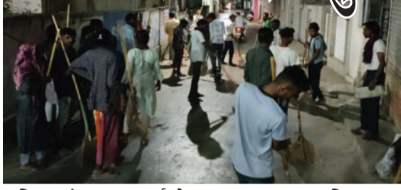
અભિયાનનું આહવાન કર્યું છે. સ્વચ્છતા હી સેવા અભિયાન ૨૦૨૪ : સ્વભાવ સ્વચ્છતા, સંસ્કાર સ્વચ્છતા” અંતર્ગત

અમરેલી, તા. ૨૨ તા. ૨ ઓક્ટોબર - મહાત્મા ગાંધીજીના જન્મ દિવસને સમગ્ર ભારતમાં ‘સ્વચ્છ ભારત દિવસ’ તરીકે ઉજવવામાં આવે છે. વડાપ્રધાન નરેન્દ્રભાઈ મોદીએ આ વર્ષે પણ ‘સ્વચ્છ ભારત મિશન’ ના ૧૦ વર્ષની ઉજવણીના ભાગરુપે સમગ્ર દેશમાં સ્વચ્છતા હી સેવા અભિયાન : સ્વભાવ સ્વચ્છતા, સંસ્કાર સ્વચ્છતા” અંતર્ગત