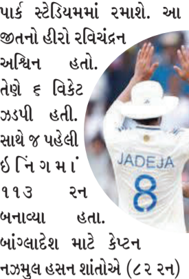
આગળ ધપાવ્યો હતો. શાંતો ૮૨ રન બનાવીને આઉટ થયો હતો.

બાંગ્લાદેશ, તા. ૨૨ ટીમ ઈન્ડિયાએ બાંગ્લાદેશ સામેની પ્રથમ ટેસ્ટ ૨૮૦ રને જીતી લીધી છે. રવિવારે ૫૧૫ રનના ટાર્ગેટને ચેજ કરવા ઊતરેલી ભારતીય ટીમે બીજા ઈનિંગમાં બાંગ્લાદેશને ૨૩૪ રનમાં ઓલઆઉટ કરી દીધું હતું. ટીમે ૨ ટેસ્ટ મેચની સિરીઝમાં ૧-૦ની લીડ મેળવી લીધી છે. બીજા મેચ ૨૭ સપ્ટેમ્બરથી કાનપુરના ગ્રીન