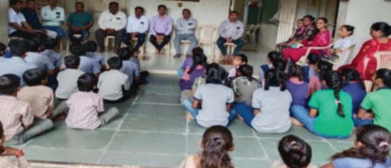
×ટકાઉ ભવિષ્ય માટે વિજ્ઞાન અને ટેકનોલોજી× હતી, જેમાં પાંચ પેટા વિભાગોમાં જુદી જુદી શાળાના બાળકોએ પોતાની કૃતિઓ રજૂ કરી હતી. આ પાંચે વિભાગોમાંથી શ્રેષ્ઠ કૃતિઓ આગામી સમયમાં તાલુકા

અમરેલી, તા.૨૨ G.C.E.R.T. ગાંધીનગર અને જિલ્લા શિક્ષણ અને તાલીમ ભવન અમરેલી પ્રેરિત સીઆરસી મોટા દેવળીયા ક્લસ્ટરની તમામ શાળાઓનું બાળ વૈજ્ઞાનિક પ્રદર્શન ૨૦૨૪ યોજાયું હતું. આ પ્રદર્શનમાં ક્લસ્ટરની તમામ શાળાઓના બાળકોએ ઉત્સાહપૂર્વક ભાગ લીધો હતો. પ્રદર્શનની મુખ્ય થીમ