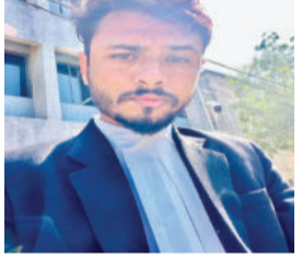
લીધેલ અને તે અંગે અમરેલી સિટી પોલીસ સ્ટેશનમાં આ ૩ ઈસમો વિરુદ્ધ ફરિયાદ નોંધાઈ