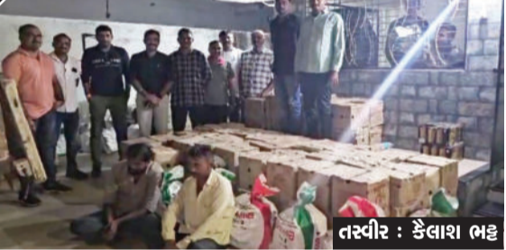
તસ્વીર : કેલાશ ભટ્ટ

પોલીસે દારૂની બોટલ, બીયરના ટીન સહિત રૂ. ૨૧.૯૦ લાખનો મુદ્દામાલ જપ્ત કર્યો ઉના, તા. ૨૨ ઉના તાલુકાના નેસડા ગામની ગૌચરણની સીમ શીતળા માતાજીના મંદિર તરફ જતા રોડ પાસે એક ટાટા કંપનીનો મીની ટ્રક તાલપત્રી બાંધેલ પડેલ હતો.