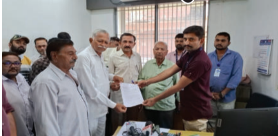
સહકારી મંડળીઓના મંત્રીઓએ એકઠા થઈ આ સસ્પેન્ડ કરાયેલા અધિકારીઓને ફરજ ઉપર લેવા માટે આવેદન આપ્યું હતું. આ અંગે

ગીર ગઢડા, તા. ૨૨ ગીરગઢડા તાલુકાના શાણા વાંકિયા ગામે સહકારી મંડળીમાં ખેડૂત ખાતેદારો સાથે કરોડો રૂપિયાની છેતરપિંડી આચરવામાં આવી હતી. જે બાબતને લઈને જૂનાગઢ જિલ્લા સહકારી બેંક દ્વારા ફરજ પરના ચાર કર્મચારીને તાત્કાલિક સસ્પેન્ડ કરવામાં આવ્યા છે. જેને લઈને ઉના, જૂનાગઢ જિલ્લા સહકારી બેંક ખાતે ઉના અને ગીરગઢડા