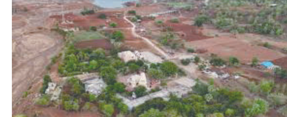
વડાપ્રધાન નરેન્દ્ર મોદી ગુજરાતના મુખ્યમંત્રી હતા ત્યારે તેમણે રાજ્યમાં પ્રવાસન સ્થળોનો બહુમુખી વિકાસ કરીને એક નવી કેડી કંડારી છે, જેના પરિણામ

૭૯૫ ગામોની અરજીઓ બેસ્ટ ટૂરિઝમ એવોર્ડ માટે મળી હતી