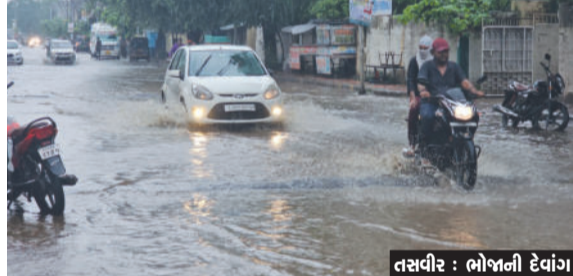
જ વરસાદી વાતાવરણ વચ્ચે બપોર બાદ ભારે વરસાદનાં કારણે રાજાશાહી વખતમાં બનેલ વેરી તળાવ ભારે વરસાદનાં કારણે ઓવરફ્લો થયું હતું.

ગોંડલ, તા. ૨૯ રાજ્યમાં ત્રણ દિવસથી વરસાદી માહોલ વચ્ચે ગોંડલ શહેરમાં અને તાલુકાભરમાં ધોધમાર વરસાદ વરસ્યો હતો. શહેરમાં વહેલી સવારથી