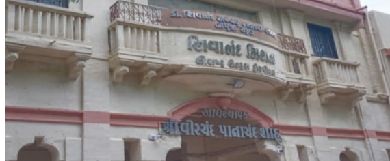
ચાર ઓપરેશન ટેબલ પર કરાયેલા ૩૦ ઓપરેશનમાંથી ૧૦ દર્દીઓને અંધાપાની અસર થઈ. ૧૦ પ્રભાવિત દર્દીઓમાંથી ૭ને રિકવરી મળી, પરંતુ ૩ની સ્થિતિ હજુ પણ ગંભીર છે. ગંભીર સ્થિતિના ૩ દર્દીઓને વધુ સારવાર માટે રાજકોટની ખાનગી હોસ્પિટલમાં ખસેડવામાં આવ્યા છે. એક દર્દીએ અમદાવાદની સિવિલ હોસ્પિટલમાં ફરિયાદ નોંધાવી છે.

જસદણ, તા. ૨૯ જસદણના વિરનગર ખાતે આવેલી શિવાનંદ મિશન આંખની હોસ્પિટલમાં એક ગંભીર ઘટના સામે આવી છે, જેમાં મોતિયાના ઓપરેશન બાદ ૧૦ દર્દીઓને અંધાપાની અસર થઈ છે. આ ઘટનાએ આરોગ્ય વિભાગ અને સ્થાનિક સમુદાયમાં ખળભળાટ મચાવ્યો છે. ગત તા. ૨૩ સપ્ટેમ્બરે (સોમવાર) હોસ્પિટલમાં ૩૦ દર્દીઓના મોતિયાના ઓપરેશન કરવામાં આવ્યા હતા.