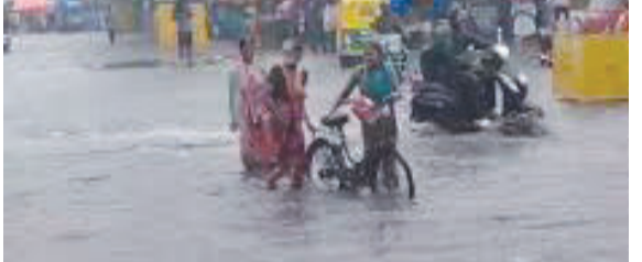
૨૪ કલાક માછીમારોને દરિયો નહીં ખેડવાની સૂચના અપાઈ છે. બીજા ભાજુ ભાવનગર જિલ્લાના મહુવા તાલુકા પંથકમાં ૭ ઈંચ વરસાદ પડતાં અનેક વિસ્તારો

આગામી ૨૪ કલાક માછીમારોને દરિયો નહીં ખેડવાની સૂચના