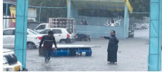
આજે બપોરના સમયે ધોધમાર વરસાદ વરસતા બોટાદના ઝાંપે, જીનનાકા, મધરપાટ, સિનેમારોડ, લક્ષ્મીવાડી રોડ, ટાવર રોડ સહિતના રસ્તાઓ પર પાણી ફરી વળ્યા હતા. ગઢડા શહેર ઉપરાંત તાલુકાના માંડવધાર, કેરાળા, લાખણકા, ટાટમ, ગોરડકા,

પાણીની ભરપૂર આવક થઈ રહી હોઈ આજે ૧૦ દરવાજા ખોલવામાં આવ્યા હતા. નવરાત્રિને હવે ચાર જ દિવસ બાકી રહ્યા છે ત્યારે ખેલેયાઓ માટે રાહતના સમાચાર એ છે કે, આવતીકાલથી રાજ્યમાં વરસાદનું જોર ઘટવાની શક્યતા વ્યક્ત કરવામાં આવી છે. ઉપરવાસમાંથી પાણીની ભરપૂર આવક થતા કડાણા કેમમાં ૧૦ દરવાજા ખોલી ૭૫ હજાર ક્યૂસેક