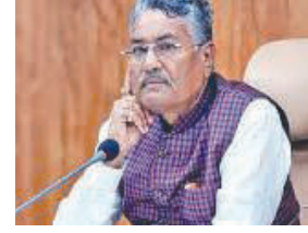
જિલ્લાના ૧૩૬ તાલુકાના કુલ ૬૮૧૨ ગામોનો સમાવેશ થયેલ છે.

વધારાની રકમ ચૂકવવા નિર્ણય કરેલ છે. ઓગસ્ટ માસના આ પેકેજમાં પંચમહાલ, નવસારી, સુરેન્દ્રનગર, દેવભૂમિ દ્વારકા, ખેડા, આણંદ, વડોદરા, મોરબી, જામનગર, કચ્છ, તાપી, દાહોદ, રાજકોટ, ડાંગ, અમદાવાદ, ભરૂચ, જૂનાગઢ, સુરત, પાટણ અને છોટાઉદેપુર એમ ૨૦