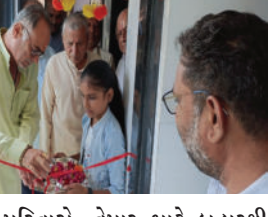
પરિવારો, વેપાર માટે હાહારથી આવતા સેલ્સમેનો સહિતનાઓને એકદમ રાહત ભાવે માત્ર રૂ. ૫૦માં શુધ્ધ, સાત્વિક ભરપેટ અનલિમિટેડ ભોજન પ્રસાદ સરળતાથી મળે તેવું ટ્રસ્ટ દ્વારા આયોજન કરાયું છે.