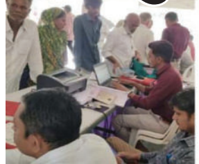
ઘર આંગણે આપવામાં આવ્યો હતો. ઉલ્લેખનીય છે કે, સેવા સેતુ કાર્યક્રમમાં રાશનકાર્ડમાં નામ

રાજુલાના બાબરીયાધાર અને ખાંભાના મોટા સમઠીયાળા મુકામે સેવા સેતુ કાર્યક્રમ યોજાયો હતો. ગંગા સ્વરૂપ આર્થિક સહાય યોજના તેમજ વૃદ્ધ સહાય યોજના અંતર્ગત લાભાર્થીઓને લાભભક્ત+નું સ્થળ પર વિતરણ કરવામાં આવ્યું હતું. રાજ્ય સરકારની વિવિધ પ્રકારની સેવાઓનો લાભ લાભાર્થીઓને