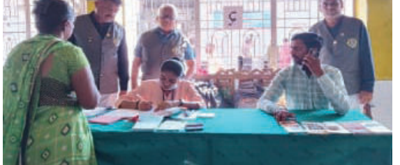
તપાસ કરવામાં આવી હતી. કુલ ૫૦ દર્દીઓએ લાભ લીધો હતો, જેમાંથી ૧૪ દર્દીઓને સુદર્શન નેત્રાલયમાં લઈ જઈ ટાંકા વગરના મોતિયાના