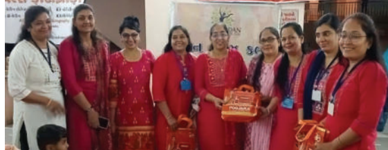
બાબરા, તા. ૨૩

બાબરામાં ઘણા વર્ષોથી ચાલતી ઉડાન લેડીઝ ક્લબ કંઈક નવું પીરસવાની નેમ લઈને આવે છે. બાબરામાં પહેલી વાર લેડીઝ ક્લબ દ્વારા અંતાક્ષરી કાર્યક્રમ યોજાયો હતો. જવારામ મંદિર ખાતે આયોજીત કાર્યક્રમમાં મોટી સંખ્યામાં મહિલાઓ ઉપસ્થિત રહી હતી. અંતાક્ષરીમાં પટ્ટીમોએ ભાગ લીધો હતો. તેમાં બ્લુ ટીમ વિજેતા થઈ હતી.