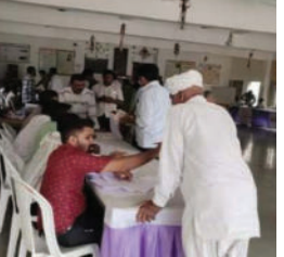
સુધારણા, આવકના દાખલા, નોન કિમિલેયર સર્ટિફિકેટ, આરોગ્ય ચકાસણી સહિતની અરજીઓ