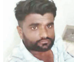
આવેલો તેનો મિત્ર ગંભીર રીતે ઘાયલ થતા તેનું મોત નિષ્કર્ષ્યું હતું. રાજુલા તાલુકાના જૂની

મિત્રને જૂની બારપટોળી ગામની યુવતી સાથે પ્રેમસંબંધ હોવાથી બનાવની રાત્રે બંને પ્રેમિકાને મળવા માટે જૂની બારપટોળી ગામ આવ્યા હતા. ત્યારે જ યુવતીના પરિવારજનો સહિતના લોકોએ લાકડી અને પાઈપથી હુમલો કરતા પ્રેમી યુવક ત્યાંથી જીવ બચાવી નાસી છૂટ્યો હતો. પરંતુ, તેની સાથે