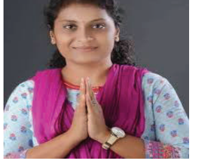
જિલ્લામાં પડેલ ભારે વરસાદને કારણે ખેડૂતો પાયામાલ થઈ ગયા છે ત્યારે તાત્કાલિક વળતર મળે, રાની

ખુલ્લો પત્ર લખ્યો છે. પત્રમાં જણાવ્યું છે કે, રાજ્યભર્યા સુરત વચ્ચે રોરો સર્વિસ ચાલુ કરવી, જિલ્લામાં સાંથલી સિયાઈ યોજના અમલમાં મુકવી, અમરેલીથી અમદાવાદ જતાં નેશનલ હાઈવે મંજૂર થઈ ગયા હોવા છતાં કામગીરી ઠપ્પ હોવાથી વહેલી તકે ચાલુ કરવો, સોમનાથ-કુંકાવાથી દિલ્લી સુધીની ટ્રેન મળે તે માટે નિર્ણય લેવો, અમરેલી