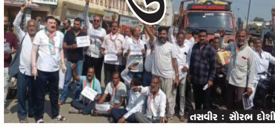
પામેલ હતો, અમરેલી જિલ્લાને જ નુકશાની વળતરની સહાયમાંથી

કોંગ્રેસ દ્વારા રોષ સાથે જણાવેલ છે કે, અમરેલી જિલ્લાને અવાર નવાર અન્યાય શા માટે કરવામાં આવે છે? ગત વર્ષે પણ અમરેલી જિલ્લામાં કમોસમી વરસાદના કારણે થયેલ નુકશાની સામે સર્વે કરવામાં આવ્યો નહોતો. જેથી ખરેખર ખેડૂતોને અન્યાય થવા