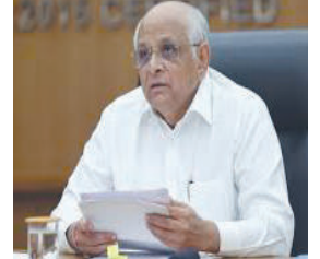
નોન ટી.પી. એરિયામાં ૪૦ ટકા ક્યાપાટ બાદ કરીને ૬૦ ટકા જમીનનું પ્રિમિયમ વસૂલ કરવામાં આવશે. મુખ્યમંત્રીના આ નિર્ણયને પરિણામે

(એ.આર.એલ.) ગાંધીનગર, તા.૨૬ મુખ્યમંત્રી ભૂપેન્દ્ર પટેલે રાજ્યના ૮ શહેરો તથા ભરૂચ-અંકલેશ્વર શહેરી વિકાસ સત્તામંડળના વિસ્તારોમાં સમાવિષ્ટ નોન ટી.પી. વિસ્તારના જમીન ધારકોને હાલ ભરવા પડતા પ્રિમિયમમાં રાહત આપતો મહત્વપૂર્ણ નિર્ણય કર્યો છે. તદનુસાર, ડી-૧ કેટેગરીમાં આવતા અમદાવાદ શહેરી વિકાસ સત્તામંડળ (ઓડી), ગાંધીનગર શહેરી વિકાસ