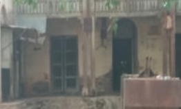
પહેલાં જિલ્લા સરકારી તંત્ર યોગ્ય નિરાકરણ લાવે અને લોક પ્રતિનિધિઓ આ મુદ્દાને ગંભીરતાથી લઈને યોગ્ય કાર્યવાહી કરે એવી માંગ ઉઠી છે.

દામનગર, તા. ૨૬ દામનગરમાં ૧૩૫ વર્ષ જૂની સરકારી ઈમારતો ખંઢેર હાલતમાં જોવા મળી રહી છે. પોલીસ સ્ટેશન, વહીવટદાર કચેરી અને ગ્રામ પંચાયત કચેરીની હાલત છેલ્લાં ૧૦થી વધુ વર્ષથી જાળવણીના અભાવે ખંઢેર હાલતમાં છે. આ ત્રણેય જર્જરિત ઈમારતોને અસામાજિક તત્ત્વો બાનમાં લે