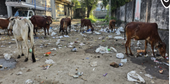
બગસરા પાલિકામાં ઘણા સમયથી પગારના મુદ્દે અનેકવાર સફાઈ કામદારો દ્વારા આંદોલનો કરવામાં આવ્યા છે. હાલમાં દિવાળી જેવા તહેવારો આવી રહેલ છે

વર્ષનું બોનસ ન અપાતા તેમણે પાલિકા કચેરીની બહાર ધરણા કર્યા હતા. શુક્રવારે તેમણે ચીમકી આપી હતી કે, શનિવાર સુધીમાં આમારા આ પ્રશ્નનું સમાધાન નહિ થાય તો સફાઈ કામગીરી બંધ કરાશે. પરંતુ પાલિકા દ્વારા તેમની માંગણીને ફગાવી દેતા સફાઈ કામદારોએ પાલિકા કચેરી ખાતે ધરણા કર્યા