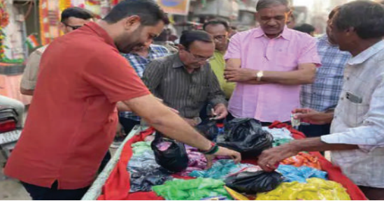
નરેન્દ્ર મોદીના સૂત્રને સાર્થક કરવા અમરેલીમાં ધારાસભ્ય અને ગુજરાત વિધાનસભાના નાયબ દંડક કૌશિક વેકરીયાએ અમરેલી શહેરમાં નવતર અભિગમ દર્શાવ્યો છે. અમરેલી

થવાનું છે. તેમણે પ્રોડક્ટ ખરીદતી વખતે UPIનો ઉપયોગ કરવાનું કહ્યું. તેને જીવનમાં આદત બનાવો. પ્રધાનમંત્રીની અપીલને મોટાભાગના દેશવાસીઓએ અપનાવી છે અને આગામી દિવાળીના પર્વ નિમિત્તે સ્થાનિક વેપારીઓ અને કારીગરો પાસેથી વસ્તુઓની ખરીદી કરીને પ્રધાનમંત્રીની અપીલને સાકાર કરી છે. વડાપ્રધાન