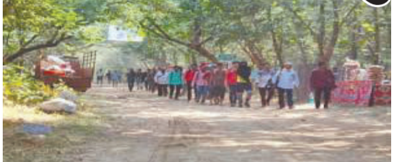
ગિરનાર જંગલના ૩૬ km રૂટ પર આ પરિક્રમાનું આયોજન કરવામાં આવે છે. ત્યારે ગત વર્ષે પરિક્રમામાં પરિવાર સાથે આવેલી એક બાળકીને દીપડાએ ફાડી ખાધી હતી. જેને લઈને આ વર્ષે વનવિભાગનું તંત્ર સજ્જ બન્યું છે.

જૂનાગઢમાં ગિરનારની લીલી પરિક્રમા કારતક માસની સુદ અગિયારસથી શરૂ થાય છે અને કાર્તિક પૂર્ણિમાના દિવસે પૂર્ણ થાય છે. જ્યારે આ વર્ષે ગિરનારની લીલી પરિક્રમા ૧૨ નવેમ્બર થી ૧૫ નવેમ્બર સુધી યોજાશે જેમાં લાખોની સંખ્યામાં પરિક્રમાર્થીઓ પુણ્યનું ભાણું બાંધવા જૂનાગઢ લીલી પરિક્રમામાં આવશે.