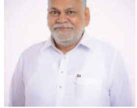
વિજ્ઞાનના વર્તમાન તેમજ નિવૃત્ત શિક્ષકો, પ્રાધ્યાપક, વેપારીગણ, અધિકારીગણ, વ્યવસાયિકો, ડોક્ટર્સ, એન્જિનિયર્સ ઉપરાંત ગણિતમાં રસ ધરાવનારી કોઈપણ વ્યક્તિને હૃદયપૂર્વક આમંત્રણ છે