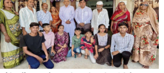
પર્વની હર્ષોલ્લાસ સાથે ઉજવણી કરી હતી.