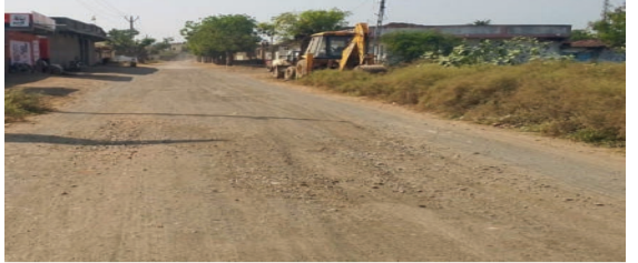
હોવાના કિસ્સાઓ વારંવાર સામે આવી રહ્યા છે. રસ્તાની બંને બાજુએ કોન્ક્રીટ પાથરવામાં આવી છે પરંતુ ડામરનું કામ ઘણા સમયથી પૂર્ણ થયું નથી. આને કારણે વાહનચાલકોને ભારે હાલાકી ભોગવવી પડી રહી છે. સ્થાનિક લોકો આ સમસ્યાથી પરેશાન થઈને તંત્ર સામે રોષ વ્યક્ત કરી રહ્યા છે.

ખાંભા તાલુકાના રૂગનાથપુર ખોડીથી મોટા સમઢીયાળા જતો રસ્તો અત્યંત ખરાબ હાલતમાં છે. આ રસ્તા પર કાંકરા વિખરાયેલા હોવાથી વાહન ચલાવવું મુશ્કેલ બની ગયું છે. ખાસ કરીને નાના વાહનો, પશુપાલકો અને ખેડૂતોને વધુ મુશ્કેલીનો સામનો કરવો પડી રહ્યો છે. આ રસ્તો સાવરકુંડલા અને ખાંભાને જોડતો હોવાથી વાહનચાલકોને અવારનવાર અકસ્માતનો સામનો કરવો પડે છે. આ રસ્તા પર ટુ-વ્હીલર ચાલકો અકસ્માતનો ભોગ બનતા