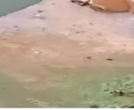
અમરેલી, તા. ૦૮

લીલીયા નજીક માલગાડીની અડફેટે ત્રણ ગાયો આવી જતા તેમના કમકમાટીભર્યા મોત થતા ગૌપ્રેમીઓમાં અરેરાટી પ્રસરી જવા પામી હતી. લીલીયા ભેંસવડી વચ્ચે ફાટક નંબર ૪૧/સી અને ૪૨/સી વચ્ચે પીપાવાવ પોર્ટથી ધોળા જતી માલગાડી અડફેટે ચડી જતા ત્રણ ગાયોના મોત થયા હતા. માલગાડીના ડ્રાઈવરે અહીં ટ્રેન અટકાવવાની પણ તસદી લીધી ન હતી. હિન્દુ સમાજ માટે ગાય પવિત્ર અને પુજનીય છે. રેલવે તંત્ર હાઈકોર્ટની ફટકાર ખાઈ ચુક્યું છે જેથી રેલવેના ડ્રાઈવરો રસ્તામાં સિંહ જુએ તો માલગાડી અટકાવી જાણે સિંહને બચાવી લીધો હોય તેવા દાવા કરે છે. સિંહને જોઈ ટ્રેન અટકાવનાર ડ્રાઈવરો ક્યારેય ગાયને