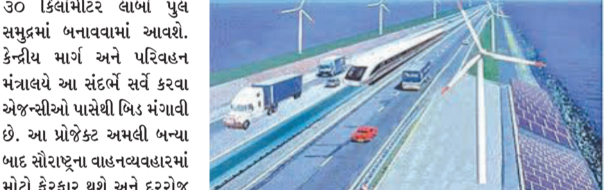
૩૦ કિલોમીટર લાંબો પુલ સમુદ્રમાં બનાવવામાં આવશે. કેન્દ્રીય માર્ગ અને પરિવહન મંત્રાલયે આ સંદર્ભે સર્વે કરવા એજન્સીઓ પાસેથી બિડ મંગાવી છે. આ પ્રોજેક્ટ અમલી બન્યા બાદ સૌરાષ્ટ્રના વાહનવ્યવહારમાં મોટો ફેરફાર થશે અને દરરોજ લાખો લીટર ઈંધણ અને સમયની બચત થશે. માર્ગ પરિવહન અને ધોરીમાર્ગ મંત્રાલય અને ભારતમાલા પ્રોજેક્ટ્સ એન્ડ

(એ.આર.એલ), રાજકોટ, તા.૯ સૌરાષ્ટ્રથી સુરત કે મુંબઈ જવા માંગતા લોકો માટે સારા સમાચાર છે. હવે તેમને બગોદરા કે વડોદરા જવું પડશે નહીં. જામનગરથી રોડ માર્ગે, ભરૂચ માત્ર ૫ કલાકમાં અને સુરત માત્ર ૬ કલાકમાં પહોંચી શકાશે. અમરેલી જિલ્લાના લોકોને ભરૂચ થઈને સુરત સુધી નવો નેશનલ હાઈવે બનાવવા જઈ રહ્યો છે. જેમાં દેશનો સૌથી લાંબો