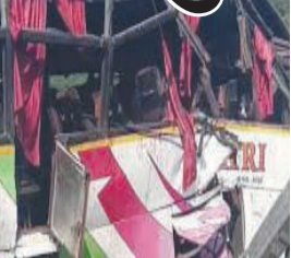
આવ્યા છે. જણાવી દઈએ કે, અંબાજી નજીક આવેલો આ ત્રિશુલીયા ઘાટ ભયજનક માર્ગ તરીકે ઓળખાય છે, જ્યાં આ પહેલા પણ અનેક અકસ્માતો ઘટી ચૂક્યા છે. આ જગ્યાએ અસામાન્ય રીતે સાવધાની જરૂરી છે, પરંતુ તે છતાં, આ માર્ગ પર અકસ્માતોની વારંવાર ઘટનાઓ સામે આવે છે. સ્થાનિકો અને મુસાફરોને આ વિસ્તારમાં ગતિ નિયમો અને સાવચેત રહેવા અંગે વધારે માહિતગાર બનવા માટે સૂચના આપવામાં આવી છે. અહીં મુસાફરી કરતા પહેલા સાવધાની રાખવી ખુબ જ અનિવાર્ય છે. કારણ કે, આ ત્રિશુલીયા ઘાટ પર અનેક અકસ્માતો થયા છે અને ત્યાં અનેક લોકોના મોત પણ થયા છે.

અંબાજી, તા.૯ અંબાજી નજીક આવેલા ત્રિશુલીયા ઘાટ પર અવારનવાર અકસ્માતની ઘટનાઓ બનતી હોય છે. ત્યારે આજે વધુ એક અકસ્માત ત્રિશુલીયા ઘાટ પર બન્યો છે. ૯ નવેમ્બર ૨૦૨૪ના રોજ ત્રિશુલીયા ઘાટ પર ૨૮ યાત્રાળુઓ ભરેલી લકઝરી બસનો અકસ્માત સર્જાયો હતો. જેમાં ૨૦થી વધુ યાત્રાળુઓ ઈજાગ્રસ્ત થયાં હોવાની પ્રાથમિક માહિતી મળી રહી છે. હજુ સુધી કોઈ મળ્યા નથી. બસ અંબાજીથી અંજાર પરત ફરી રહી હતી. યાત્રાળુઓ સવાર લકઝરી બસ અંજાર પરત ફરી રહી હતી. આ દરમિયાન ત્રિશુલીયા ઘાટ પર બ્રેક ફેલ થઈ જતાં બસે મેક્સ ગાડી અને એક કારને અડકેટે લીધી હતી. જેમાં ૨૮ મુસાફરોમાંથી ૨૦ જેટલા મુસાફરોને ઈજા પહોંચી છે. ઈજાગ્રસ્તોને ઈમરજન્સી ૧૦૮ એમ્બ્યુલન્સની મદદથી દાતા રેફરલ સરકારી હોસ્પિટલ ખાતે ખસેડવામાં