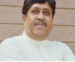
તજજ્ઞ પધારી રસપ્રદ લોકભાગ્ય શૈલીમાં ગણિતની અવનવી બાબતો, સંશોધનો, વ્યવહારિક પ્રયોજન તથા ગણિત શિક્ષણ અંગે ઓડિયો વિઝ્યુઅલ રજૂઆત કરશે. અમરેલી જિલ્લાનાં ગણિત