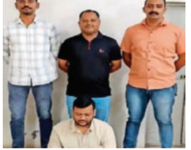
ગુનામાં ફરાર હતો તેને પોલીસે ઝડપી પાડ્યો હતો. આ બુટલેગર સામે અગાઉ લીબડી, વલસાડ, લાઠી અને અમરેલી રૂરલ પોલીસ મથકમાં દારૂની હેરાફેરી સહિતના ગુના નોંધાયેલા છે.