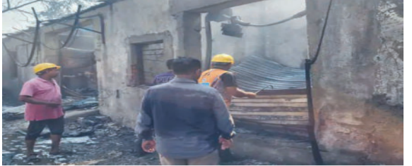
કામ કરી રહેલા કેટલાક કામદારો ફસાયા છે. જેમાં ત્રણના મોત થયા છે. જ્યારે આશંકા છે કે હજુ પણ ત્રણથી વધુ લોકો આગમાં ફસાયા છે. આગ પર કાબૂ મેળવવા માટે ગણદેવી, બીલીમોરા અને નવસારીથી ફાયર

(એ.આર.એલ), નવસારી, તા.૯ નવસારી જિલ્લાના ગણદેવીમાં ભીષણ આગની ઘટના સામે આવી છે. જેમાં ત્રણ લોકો જીવતા ભૂંજાયા છે. જ્યારે ત્રણથી વધુ લોકો ઘાયલ થયા છે. મળતી માહિતી મુજબ, ગણદેવી તાલુકાના દેવસર ગામ પાસે આજે સવારે એક ટ્રાન્સપોર્ટ વેરહાઉસમાં ભીષણ આગ લાગી હતી. આગને કારણે વેરહાઉસમાં