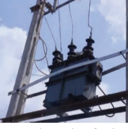
કરવાની તૈયારીઓ થઈ રહેલી હોય ત્યારે જ ખેડૂતોના ટીસી છેલ્લા ૧૨ દિવસથી બંધ હાલતમાં

સાવરકુંડલા તાલુકાના વીજપડી ગામે ખેડૂતોના બંધ પડેલા ટીસી ૧૨ દિવસથી નબદલાતાં ન આવતા રોષ ફેલાયો છે. વીજપડી ગામે શિયાળુ પાકનું વાવેતર