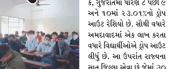
ગુજરાત ત્રીજા નંબરે છે. ૨૧ પ્રવેશોત્સવ કરવામાં આવ્યા છે જેમાં કરોડોનો ખર્ચ કરવામાં આવ્યો છે અને જાહેરાતો કરવામાં આવી છે. પરંતુ હકિકત એવી છે કે, ગુજરાતમાં ધોરણ ૮ પછી ૯ અને ૧૦માં ૨૩.૦૧%નો ડ્રોપ આઉટ રેશિયો છે. સૌથી વધારે અમદાવાદમાં એક લાખ કરતા વધારે વિદ્યાર્થીઓએ ડ્રોપ આઉટ લીધું છે. આ ઉપરાંત રાજ્યના સાત જિલ્લા એવા છે જેમાં ૩૦ ટકા કરતાં વધારે ડ્રોપ આઉટ રહેશે. દેશભરમાં ૧૨.૫૦ લાખ બાળકોનો ડ્રોપ આઉટ છે જેમાં ૬.૯૭ લાખ બાળકો જ્યારે પાંચ લાખથી વધુ બાળકોએ છે.

(એ.આર.એલ), ગાંધીનગર, તા.૯ રાજ્ય સરકારના શિક્ષણ વિભાગ દ્વારા સ્કૂલમાં થતો ડ્રોપ આઉટ રેશિયો જાહેર કરવામાં આવ્યો છે. જે મુજબ ધોરણ આઠ બાદ ૨૩.૨૮% વિદ્યાર્થીઓ ધોરણ ૯માં પ્રવેશ મેળવતા જ નથી. જેને લઈને કોંગ્રેસે સરકાર પર પ્રહાર કર્યા છે. કોંગ્રેસના આક્ષેપ છે કે, સરકાર દ્વારા કમાન્ડ એન્ડ કંટ્રોલ સિસ્ટમ બનાવવામાં આવી છે. વર્લ્ડ