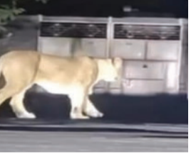
હાજરી દર્શાવતા આવા વીડિયો અવારનવાર સામે આવતા રહે છે.