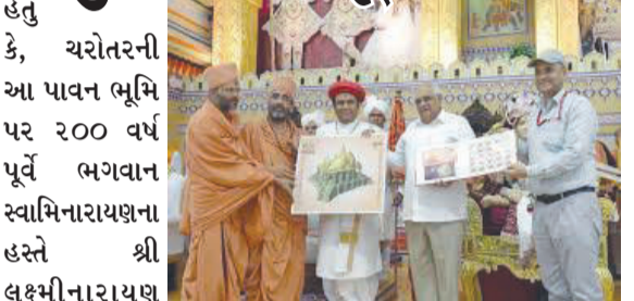
હતું કે, ચરોતરની આ પાવન ભૂમિ પર ૨૦૦ વર્ષ પૂર્વે ભગવાન સ્વામિનારાયણના હસ્તે શ્રી લક્ષ્મીનારાયણ દેવ મંદિરનું નિર્માણ કરવામાં આવ્યું હતું. આ મહોત્સવ આટલો ભવ્ય છે, જ્યારે ભગવાન સ્વામિનારાયણે આ ભૂમિ પર શ્રી

(એ.આર.એલ), વડતાલ, તા.૯ વડતાલ ખાતે ઉજવાઈ રહેલા લક્ષ્મીનારાયણ દેવ દ્વિશતાબ્દી મહોત્સવમાં મુખ્યમંત્રી ભૂપેન્દ્ર પટેલ સહભાગી થયા હતા. આ પાવન અવસરે મુખ્યમંત્રી ભૂપેન્દ્ર પટેલના હસ્તે વડતાલ દ્વિશતાબ્દી મહોત્સવની પાંચ રૂપિયાની ટપાલ ટિકિટનું વિમોચન કરવામાં આવ્યું હતું. સૌ હરિભક્તોને નૂતન વર્ષની શુભકામનાઓ પાઠવતા મુખ્યમંત્રી ભૂપેન્દ્ર પટેલે જણાવ્યું