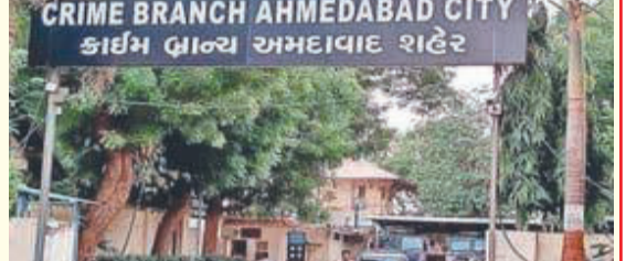
(એ.આર.એલ), અમદાવાદ, તા.૯ સીજી રોડ પર બાળકો પાસે ભીષ મંગાવતા હોવાનો ખુલાસો થયો છે. આરોપીઓ એક બાળક પાસેથી દૈનિક ૧૫૦ રૂપિયા વસૂલતા હતા. જ્યારે બાળક પરિવાર સાથે અથવા અન્ય બાળકો સાથે હાથ ધરવામાં આવ્યું હતું, સર્ચ ઓપરેશનમાં મળેલા બાળકો અને તેમના વાલીઓની પૂછપરછના આધારે એજન્ટો અને નેટવર્કનો પર્દાફાશ થયો છે. અમદાવાદમાં ઠેર - ઠેર સિગ્નલો પર ભીષ માગવા માટે ઉભા રહેતા બાળકોને લઈને ચોકવાનારી ઘટના સામે આવી છે. અમદાવાદ ક્રાઈમ બ્રાન્ચની ટીમે ભીષ મંગાવવાના નેટવર્કનો પર્દાફાશ કર્યો છે. રાજસ્થાનથી બાળકો લાવીને ભીષ મંગાવવા માટે લાવતા બે એજન્ટને ઝડપ્યા છે. એસ.જી. હાઈવે અને