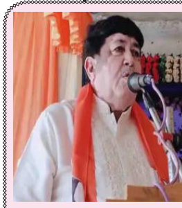
ગેરરીતિ ન થાય તે માટે 'કટકીબાજો'ને ચેતવ્યા હતા. હું મીડિયાના માધ્યમથી કહું છું ગુજરાત ભરમાં ગેરરીતિ થાય તો મારા ધ્યાને મુકજો. ખેડૂતોનું શોષણ સીધું કે આડકતરી રીતે થયું હશે તો કોઈપણને બક્ષવામાં નહિ આવે.