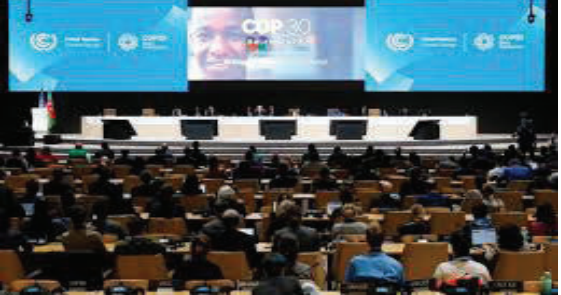
જ દૂરનું" ગણાવ્યું. ભારતે કહ્યું કે ગ્લોબલ સાઉથ માટે યુએસ ૩૦૦ બિલિયનની નાણાકીય સહાયનો આંકડો એ ૧.૩ ટ્રિલિયન યુએસ

નવીદિલ્હી, તા. ૨૪ અઝરબૈજાનની રાજધાની બાકુમાં ચાલી રહેલી સંયુક્ત રાષ્ટ્રની ક્લાઈમેટ કોન્ફરન્સમાં આ વખતે ભારતે કોઈ પણ દેશનો દબદબો બનવા દીધો નથી. ભારતે રવિવારે ક્લાયમેટ ફાઈનાન્સ પેકેજને નકારી કાઢ્યું હતું જેનું લક્ષ્ય ગ્લોબલ સાઉથને ૨૦૩૫ સુધીમાં વાર્ષિક ૩૦૦ બિલિયન ડોલર પૂરા પાડવાનું છે. ભારતે તેને "ખૂબ જ દુર્લભ અને ખૂબ