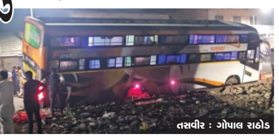
જે રાજુલાથી સાંજના સાત કલાકે ઊપડી જે મહુવા જકાતનાકા પાસે પહોંચતા અચાનક સાઈડમાં

રાજુલા, તા.૨૪ રાજુલામાં ભારે વાહનોને શહેરમાં પ્રવેશબંધી હોવા છતાં તેનો ખુલ્લેઆમ ભંગ થઈ રહ્યો છે અને જાહેરનામાનો ઉલાળીયો કરવામાં આવી રહ્યો છે. ત્યારે રાજુલા શહેરમાં મહુવા જકાતનાકા પાસે આજે સાંજના સમયે કુળદેવી ટ્રાવેલ્સ નામની બસ જે ઉનાથી સુરત જતી હતી