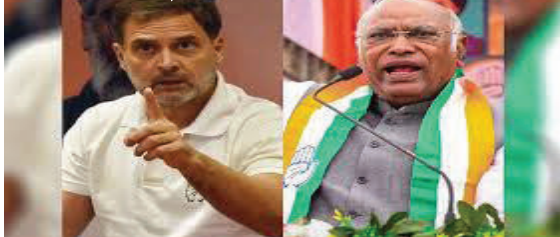
હતી. જ્યારે રાજ્યોમાં સત્તા પર હતી, ત્યારે કોંગ્રેસ ૪૦ વખત વિધાનસભા ચૂંટણીનો સામનો કર્યો હતો અને તેમાંથી માત્ર ૭ જ જીતી શકી હતી. લોકસભા ચૂંટણી પહેલા મધ્યપ્રદેશ, છત્તીસગઢ અને

નવીદિલ્હી, તા. ૨૪ મહારાષ્ટ્ર અને ઝારખંડ વિધાનસભા ચૂંટણીના પરિણામો આવી ગયા છે. ઝારખંડમાં ઈન્ડિયા બ્લોકની જીત થઈ છે, જ્યારે મહારાષ્ટ્રમાં પ્રદર્શન ખૂબ જ ખરાબ રહ્યું છે. આ સાથે હવે કોંગ્રેસ પર સવાલો ઉઠી રહ્યા છે. ૨૦૧૪ થી ૨૦૨૪ ની વચ્ચે કોંગ્રેસ ૬૨ માંથી ૪૭ વિધાનસભા ચૂંટણી હારી છે. ૨૦૧૧માં છેલ્લી વખત કોંગ્રેસ પોતાની સરકારને બચાવીને આસામમાં સત્તામાં પાછી આવી