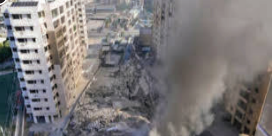
હુમલામાં ૧૫ લોકો માર્યા ગયા છે અને ઘણા ઘાયલ થયા છે. લેબનોનના નાગરિક સ્વયંસેવક સંગઠને જણાવ્યું હતું કે હુમલામાં મૃત્યુઆંક વધી શકે છે કારણ કે કટોકટી બચાવ કાર્યકરો હજુ પણ કાટમાળમાં રહેલા લોકોને શોધી રહ્યા છે. લેબનોન

(એચ.એસ.એલ), બેરૂત, તા. ૨૪ ઈઝરાયેલની સેના લેબનોનમાં હિઝબુલ્લાહના ટાર્ગેટ પર સતત ભારે બોમ્બમારો કરી રહી છે. બેરૂતના મધ્ય વિસ્તારમાં ઈઝરાયેલ દ્વારા કરવામાં આવેલા તાજેતરના મિસાઈલ