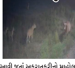
આવી જતાં અફરાતફરીનો માહોલ સર્જાયો હતો. સિંહોએ એક પછી એક પશુઓની પાછળ દોટ મૂકી શિકારનો પ્રયાસ કર્યો હતો. વન્ય પ્રાણીઓ અવારનવાર આ વિસ્તારમાં આવી ચડતાં હોવાથી અને રોડ-રસ્તા પર દેખા દેતાં હોવાથી સ્થાનિક રહીશોમાં ભયનો માહોલ સર્જાયો છે.

દીવ, તા. ૨૪ કેન્દ્રશાસિત પ્રદેશ દીવના ઝોલાવાડી વિસ્તારમાં રાત્રિના સમયે પાંચ સિંહોના ટોળાએ પશુઓનો શિકાર કરવાનો પ્રયાસ કર્યો હતો. આ સમગ્ર ઘટના સીસીટીવી કેમેરામાં કેદ થઈ હતી, જેનો વીડિયો સોશિયલ મીડિયામાં વાયરલ થયો છે. દરિયાકાંઠાના જંગલ વિસ્તારમાં છેલ્લા કેટલાક દિવસોથી વન્ય પ્રાણીઓની હલચલ વધી છે. રાત્રિ દરમિયાન એક તરફ પશુઓનું ટોળું અને બીજી તરફ સિંહોનું ટોળું આમને-સામને