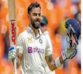
૧૨ રનમાં ૩ વિકેટ ગુમાવી દીધી છે. વિરાટ કોહલીએ ઓસ્ટ્રેલિયા સામે પ્રથમ મેચની બીજી ઈનિંગમાં અણનમ ૧૦૦ રનની ઈનિંગ

પર્થ, તા. ૨૪ ભારત અને ઓસ્ટ્રેલિયા વચ્ચે રમાઈ રહેલી પ્રથમ ટેસ્ટ મેચના ત્રીજા દિવસે ભારત મજબૂત સ્થિતિમાં પહોંચી ગયું છે. કોહલી અને યશસ્વી જયસ્વાલ (૧૬૧ રન)ની સદીના આધારે ભારતે ૪૮૭/૬ પર પોતાની ઈનિંગ ડિક્લેર કરી હતી. આ સાથે ઓસ્ટ્રેલિયાને ૫૩૪ રનનો ટાર્ગેટ આપ્યો હતો. ૨૦ ચેંડમાં ઓસ્ટ્રેલિયાએ સ્ટમ્પ્સ સુધી