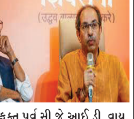
કંઈક પૂર્વ સી.જે.આઈ ડી. વાય. ચંદ્રયૂડ છે. તેઓએ સમયસર પોતાનો નિર્ણય ન આપ્યો, યુકાદો ન આપ્યો. ૪૦ લોકોએ બેઈમાની કરી હતી. જે પાર્ટી ચૂંટાઈને આવી હતી, તે ચાલીને બીજી પાર્ટીની સત્તામાં જતા રહ્યાં. તમારી જવાબદારી છે બંધારણની રક્ષા કરવી. તમે જો યુકાદો આપ્યો હોત તો આગળ કોઈ હિંમત ન કરત. તમે બારી-દરવાજા ખુલ્લા રાખીને ત્યાંથી નિવૃત્ત થઈ ગયાં. હવે કોઈપણ પ્રકારે પાર્ટી બદલી શકાય છે અથવા પોતાની પાર્ટી છોડીને સરકાર બનાવી શકાય છે. ઈતિહાસ ચંદ્રયૂડ સાહેબને ક્યારેય માફ નહીં કરે.'

મુંબઈ, તા. ૨૪ મહારાષ્ટ્ર વિધાનસભા ચૂંટણીના પરિણામો જાહેર થઈ ગયા છે. મહાયુતિ ગઠબંધનને મોટી જીત મળી છે જ્યારે મહાવિકાસ અઘાડીને કારમી હારનો સામનો કરવો પડ્યો છે. આ પરિણામને લઈને હવે ઉદ્ભવ જૂથની શિવસેનાના નેતા સંજય રાઉતનું નિવેદન સામે આવ્યું છે. સંજય રાઉતે મહાવિકાસ અઘાડીની હાર માટે પૂર્વ મુખ્ય ચીફ જસ્ટિસ ઓફ ઈન્ડિયા ડી. વાય. ચંદ્રયૂડને જવાબદાર ગણાવ્યા છે. સંજય રાઉતે મીડિયા સાથે વાતચીત દરમિયાન કહ્યું, 'મહારાષ્ટ્રના જે પરિણામ સામે આવ્યા તે ખૂબ જ ચોંકાવનારા છે. મહારાષ્ટ્રમાં બેઈમાની થઈ રહી છે.' ચંદ્રયૂડ પર મોટો આરોપ લગાવતા સંજય રાઉતે કહ્યું, 'જે પરિણામ આવ્યા, તેના માટે જવાબદાર