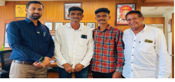
મદદ માટે સરાહનીય કામગીરી કરી રહ્યા છે. તાજેતરમાં વાંકાનેરના માલસીકા ગામે

અમરેલી, તા.૨૪ અમરેલીના ધારાસભ્ય અને નાયબ મુખ્ય ટંકડ કૌશિકભાઈ વેકરીયાએ પોતાના મતક્ષેત્ર પુરતી કામગીરી મર્યાદિત ન રાખીને સમગ્ર રાજ્યમાં લોકોની