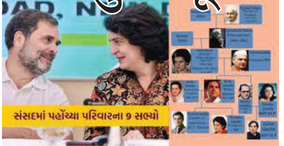
સંસદમાં પહોંચ્યા પરિવારના 9 સભ્યો

નવીદિલ્હી, તા. ૨૪ કોંગ્રેસના મહાસચિવ પ્રિયંકા ગાંધીએ વાયનાડ સંસદીય સીટ પર યોજાયેલી પેટાચૂંટણીમાં શાનદાર જીત નોંધાવીને પોતાના રાજકારણની શરૂઆત કરી છે. પ્રિયંકા ગાંધી વાડા ચૂંટણીમાં જીત મેળવી રાજકારણમાં પ્રવેશનાર નેહરુ-ગાંધી પરિવારના ૧૦મા સભ્ય છે. પ્રિયંકા પહેલા જવાહરલાલ નેહરુ, ઈન્દિરા ગાંધી, ફિરોઝ ગાંધી, સંજય ગાંધી, રાજીવ ગાંધી, સોનિયા ગાંધી, મેનકા ગાંધી, વરુણ ગાંધી અને રાહુલ ગાંધી ગાંધી પરિવારમાંથી