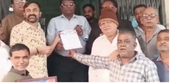
રહેલી ચર્ચા દરમિયાન ગુહમંત્રી અમિત શાહે ડો. બાબા સાહેબ ઓબેડકરનું નામ લેવું એ એક ફેશન

બગસરા, તા. ૨૨ બગસરામાં દલિત સમાજ દ્વારા મામલતદારને આવેદનપત્ર આપવામાં આવ્યું હતું. આ આવેદન ગુહમંત્રી અમિત શાહ દ્વારા લોકસભામાં ડો. બાબા સાહેબ ઓબેડકર વિષે કરવામાં આવેલા એક નિવેદનના વિરોધમાં હતું. દલિત સમાજે આવેદનપત્રમાં જણાવ્યું હતું કે ભારતના બંધારણના અમલના ૭૫ વર્ષ નિમિત્તે લોકસભામાં ચાલી