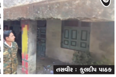
ઉપ સરપંચ સહિત તમામ વાલીઓએ આ જર્જરિત બાંધકામો દૂર કરવાની માંગણી સાથે હોબાળો મચાવ્યો હતો. ઘાંટવડ કન્યા પ્રાથમિક શાળાના પરિસરમાં છેલ્લા ૪૦-૪૫ વર્ષથી એક બંધ બાલમંદિર અને આરોગ્ય વિભાગનું બાંધકામ આવેલું છે. આ બંને બાંધકામો વર્ષોથી બંધ હાલતમાં

સ્થિતિમાં છે. જેના કારણે અહીંથી પસાર થતા બાળકો ભયના ઓચાર હેઠળ જીવી રહ્યા છે. આ બાલમંદિર અને આરોગ્ય વિભાગનું જર્જરિત બાંધકામ કોઈ પણ ઉપયોગ વગર ચાર દાયકાથી બંધ હાલતમાં છે અને શાળાના મેદાનમાં હોવાથી તે અડચણરૂપ પણ છે. કન્યા શાળા પાસે મેદાનની પૂરતી સુવિધા ન હોવાથી વિદ્યાર્થીનીઓને મોટી મુશ્કેલીનો સામનો કરવો પડે છે.