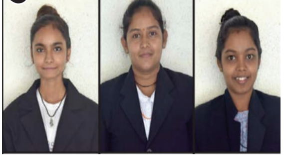
થયું હતું. આ પરીક્ષામાં ગજેરા વધાસીયા મહિલા કોમર્સ કોલેજનું ૮૮ ટકા પરિણામ સાથે

અમરેલી, તા. ૨૨ સૌરાષ્ટ્ર યુનિવર્સિટી દ્વારા શૈક્ષણિક વર્ષ ૨૦૨૩-૨૪માં B.Com.(GM), sem-IIની લેવાયેલી પરીક્ષાનું પરિણામ તાજેતરમાં જાહેર