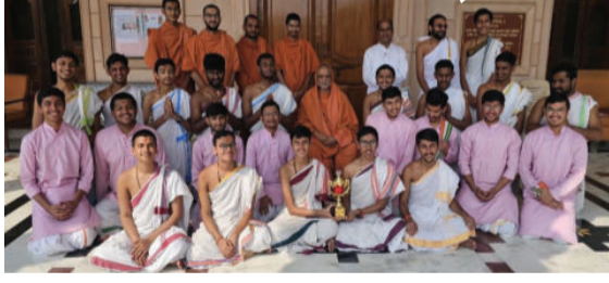
શાસ્ત્રીય સ્પર્ધા યોજાઈ હતી, જેમાં રાજ્યમાંથી ૭૦૦ જેટલા જેમ્સ કવર્ચંદ્રક, ત્રણ રજતચંદ્રક ઋષિકુમારોએ ભાગ લીધો હતો. તથા નવ કાંચચંદ્રક મેળવી આ સ્પર્ધામાં દર્શનમ્ સંસ્કૃત ઝળહળતી સફળતા ફેળવી હતી.

અમરેલી, તા.૨૨ અમદાવાદમાં શ્રી સ્વામિનારાયણ ગુરુકુલ વિશ્વવિદ્યા પ્રતિષ્ઠાન (SGVP)ના વિશાળ કેમ્પસમાં દર્શનમ્ સંસ્કૃત મહાવિદ્યાલય છેલ્લા ૨૬ વર્ષથી કાર્યરત છે. તાજેતરમાં દ્વારકા ખાતે ગુજરાતની તમામ સંસ્કૃત પાઠશાળાઓના ઋષિકુમારોની વિવિધ શાસ્ત્રોને આધારે