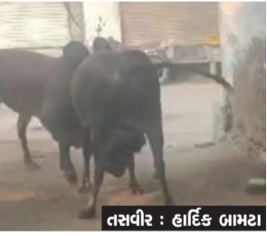
લોકોને બચકા પણ ભર્યા હતા. આવી સ્થિતિમાં તંત્ર દ્વારા આવા આખલાને બંધક બનાવવામાં આવે અને ગૌ શાળામાં રાખવામાં આવે તેવી લોકોમાં માંગ ઉઠી છે.

બગસરા અને આજુ બાજુના ગામોમાં આખલાના આતંકથી લોકો પરેશાન થઈ ગયા છે અને ભયનો માહોલ ઊભો થયો છે. આજે બગસરાની શાક માર્કેટમાં આખલા બાખડતા લારીધારકો અને વાહન ચલાકો પોતાની લારી-વાહનો મૂકીને ભાગી ગયા હતા. આખલાએ કેટલાક લોકોને બચકા પણ ભર્યા હતા. આવી સ્થિતિમાં તંત્ર દ્વારા આવા આખલાને બંધક બનાવવામાં આવે અને ગૌ શાળામાં રાખવામાં આવે તેવી લોકોમાં માંગ ઉઠી છે.