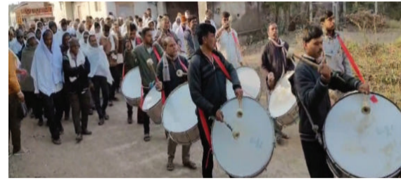
સાથે રહેતા હતા. ગતરોજ તેમનું ૧૦૧ વર્ષની ઉંમર નિધન થયું. માજીની અંતિમ ઈચ્છા હતી કે,