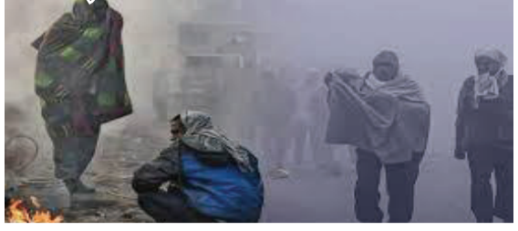
એક નવું વેસ્ટર્ન ડિસ્ટર્બન્સ પશ્ચિમ હિમાલયના પ્રદેશ અને મેદાનોને તાટકે છે. જેના કારણે હવામાનમાં પલટો આવશે. હવામાન વિભાગના જણાવ્યા અનુસાર સોમવારે દિલ્હી-એનસીઆરમાં આંશિક વાદળછાયું રહી શકે છે. ઘણા વિસ્તારોમાં હળવો વરસાદ અથવા ઝરમર વરસાદ પડવાની શક્યતા છે. મંગળવારે ગાઢ ધુમ્મસ રહી શકે છે.

હવામાન વિભાગે મંગળવાર માટે યલો એલર્ટ જાહેર કર્યું છે. હવામાન વિભાગે કહ્યું કે દિલ્હી-એનસીઆર, ઉત્તર પ્રદેશ અને હરિયાણાના ઘણા જિલ્લાઓમાં ૨૬ ડિસેમ્બર (ગુરુવાર) અને ૨૭ ડિસેમ્બર (શુક્રવાર)ના રોજ વરસાદ પડી શકે છે. વરસાદના કારણે ફરી એકવાર કડકડતી ઠંડી પડશે. હિમાચલ પ્રદેશ, પંજાબ, જમ્મુ-કાશ્મીર, હરિયાણા અને મધ્યપ્રદેશમાં તીવ્ર ઠંડીનું મોજું જોવા મળશે.