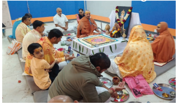
કાર્યક્રમમાં મોટી સંખ્યામાં લોકો હાજર રહ્યાં હતા અને કાર્યક્રમનો લાભ લીધો હતો. આ મંગલ કાર્યકરો અને અમરેલીના વેપારીઓ અવસરે સામાજિક, રાજકીય પણ ઉપસ્થિત રહ્યા હતા.