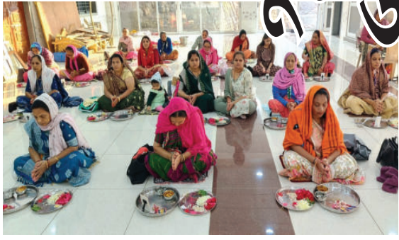
પણ આયોજન કરવામાં આવ્યું હતું તેમજ ગૌભક્તિના દર્શન કરવામાં આવ્યા હતા. કથા પારાયણમાં સંતોએ પ્રવચન કર્યાં હતા. રાત્રી