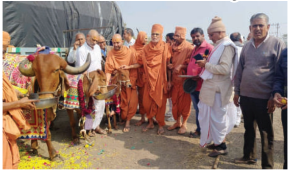
મંદિરોએ આશિર્વાચન પાઠવ્યા હતા. તેમજ ગૌ પૂજન અર્ચન કાર્યક્રમનું

કથાનો બહોળી સંખ્યામાં હરિભક્તો લાભ લઈ રહ્યાં છે. પંચદશાબ્દિ મહોત્સવ દિવસે-દિવસે ભવ્ય અને દિવ્ય બનતો જાય છે. ત્યારે આ મંગલ કાર્ય વિશ્વકલ્યાણના હેતુલક્ષી મહોત્સવના ત્રીજા દિવસે મહાપૂજાનું આયોજન કરવામાં આવ્યું હતું. જેમાં ભાવિક ભક્તો દ્વારા આ કાર્ય ધામધૂમથી અને ઉલ્લાસપૂર્વક કરવામાં આવ્યું હતું. આ અવસરે પધારેલા સંતો અને