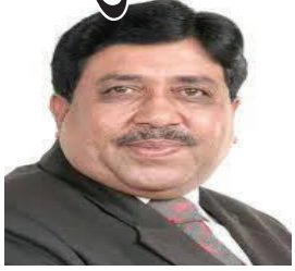
અમરેલી, તા.૨૪ ગુજરાત રાજ્ય તથા અમરેલી જિલ્લામાં આગામી તા. ૨૫થી ૨૭ ડિસે. કુલ ત્રણ દિવસ દરમ્યાન ભારે માવઠાની હવામાન ખાતાએ આગાહી કરેલ છે. જેને

માવઠાથી સંભવિત નુકસાનમાં ખેડૂતોને સહાય મળે તે અંગે રજૂઆત