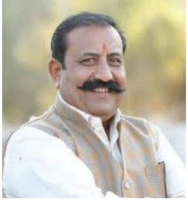
અમરેલીમાં તા. ૨૪ ડિસેમ્બર, ૨૦૨૪ને મંગળવારના રોજ ભારત સરકારના "સહકાર થી

આજે અમર ડેરી ખાતે બપોરે ૧૨:૩૦ કલાકે કાર્યક્રમનું ઓનલાઈન પ્રસારણ થશે