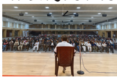
આ કાર્યક્રમ યોજાયો હતો. નેત્ર ચિકિત્સા આયુર્વેદ હોસ્પિટલ, અમરેલીએ આ કાર્યક્રમમાં સહયોગ આપ્યો હતો. આ કાર્યક્રમનો મુખ્ય ઉદ્દેશ્ય માનવ શરીરમાં રહેલા ત્રણ

અમરેલી, તા.૨૪ બી.એ.પી.એસ. સ્વામિનારાયણ મંદિર, અમરેલી દ્વારા રવિ સત્સંગ સભામાં પ્રકૃતિ પરિક્ષણ કાર્યક્રમનું આયોજન કરવામાં આવ્યું હતું. ભારત સરકારના આયુષ મંત્રાલય દ્વારા ચલાવવામાં આવતા 'દેશનું પ્રકૃતિ પરિક્ષણ અભિયાન'ના ભાગરૂપે