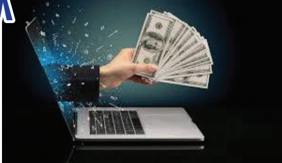
દુકાનોમાં જ થશે. ડિઝાઈન મુજબ, જો ચોક્કસ સમયગાળા માટે ચલણનો ઉપયોગ ન થાય તો, તે મોકલવાના ખાતામાં પરત કરી શકાય છે. આ ખાતરી કરશે કે પૈસા યોગ્ય રીતે ખર્ચવામાં આવે છે. આનાથી છતરપિંડીનું જોખમ પણ ઘટશે. ખાનગી કંપનીઓ દ્વારા ચોક્કસ ખર્ચની જરૂરિયાતોને પહોંચી વળવા માટે સમાન પદ્ધતિઓનો ઉપયોગ પણ કરી શકાય છે.

કરન્સી વોલેટનો ઉપયોગ કરીને વ્યક્તિ-થી-વ્યક્તિ વ્યવહારો અને વ્યક્તિ-થી-વેપારી વ્યવહારોની સુવિધા આપે છે. અત્યાર સુધીના અનુભવ પછી, રિઝર્વ બેંકે દરખાસ્ત કરી છે કે આ ચલણની પ્રોગ્રામેબિલિટી (આ કિસ્સામાં સૂચનાઓને સમજવા, સ્વીકારવા અને તેનું પાલન કરવામાં સક્ષમ ગણતરી સિસ્ટમ) અને ઓફલાઈન કાર્યક્ષમતાનો પ્રયાસ કરવો જોઈએ જેથી કરીને માત્ર ડિજિટલ જ નહીં, પરંતુ આ ચલણને પણ અપનાવવામાં આવશે. ચલણમાં વધારો થશે, પરંતુ તે જાહેર નીતિના ધ્યેયો હાંસલ કરવામાં પણ મદદ કરશે.