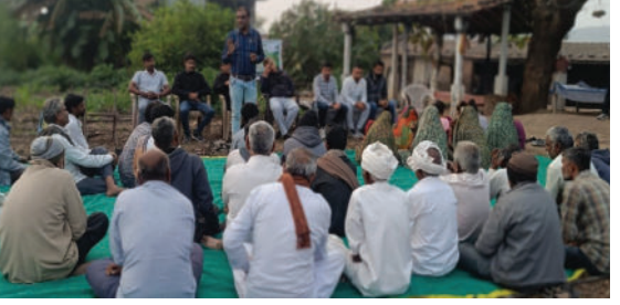
રોગ નિયંત્રણ માટે નિમાસ્ત્ર, બ્રહ્મસ્ત્ર, આગ્નિસ્ત્રની વિસ્તૃત વિગતો આપવામાં આવી હતી. કરિયાણા ગામ સ્થિત ચામુંડા પ્રાકૃતિક કૃષિ ફાર્મ ખાતે ખેડૂતોએ

અમરેલી, તા.૦૧ બાબરા તાલુકાના કરિયાણા મુકામે ખેડૂતોને પ્રાકૃતિક કૃષિના વિવિધ આયામો અને બાગાયતી પાકોમાં પ્રાકૃતિક કૃષિનું મહત્વ વિષયક નિષ્ણાંતો દ્વારા વિગતવાર માર્ગદર્શન આપવામાં આવ્યું હતું. પ્રાકૃતિક કૃષિના મહત્વના ઘટકરૂપ જીવામૃત, ઘન જીવામૃત, આચ્છાદન, મિશ્ર પાક પદ્ધતિ ઉપરાંત પ્રાકૃતિક કૃષિના ફાયદા વગેરે ઉપરાંત