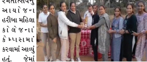
રમતોત્સવનું આયોજન હરીબા મહિલા કોલેજના કોલેજના કાર્યકર્તાઓ કરવામાં આવ્યું હતું. જેમાં હરીબા મહિલા કોલેજની રક્ષા શક્તિ સ્કૂલ અને ગાયત્રી સંસ્કાર બેડમિન્ટન, ક્રિકેટ સહિતની રમતોમાં ભાગ લીધો હતો. આ

અમરેલી, તા.૦૧ ચલાલા ખાતે અમરેલી જિલ્લા પોલીસ સુરક્ષા સેતુ સોસાયટી દ્વારા રમતોત્સવનું આયોજન કરવામાં આવ્યું હતું. ચલાલા પોલીસ સ્ટાફનાં ભાઈઓ અને બહેનોએ સંસ્થાના બાળકો સાથે કબડ્ડી, ખો-ખો, વોલીબોલ, બેડમિન્ટન, ક્રિકેટ સહિતની રમતોમાં ભાગ લીધો હતો. આ