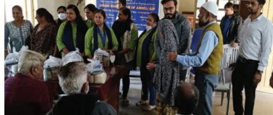
અમરેલી શહેરના ૪૦ ટીબીના દર્દીઓએ ભાગ લીધો હતો, જેમને પોષણયુક્ત આહાર માટે કીટનું વિતરણ કરવામાં આવ્યું હતું. ઈનરવ્હીલ ક્લબ દ્વારા

અમરેલી, તા.૦૧ જિલ્લા ક્ષય કેન્દ્ર-અમરેલી ખાતે ઈનરવ્હીલ ક્લબ ઓફ અમરેલી-ગીર દ્વારા ટીબીના દર્દીઓ માટે ન્યુટ્રિશન કીટ વિતરણ કાર્યક્રમનું આયોજન કરવામાં આવ્યું હતું. આ કાર્યક્રમનો મુખ્ય ઉદ્દેશ્ય ટીબીના દર્દીઓને પોષણયુક્ત આહાર પૂરો પાડવાનો અને તેમને રોગ સામે લડવા માટે પ્રોત્સાહિત કરવાનો હતો. આ કાર્યક્રમમાં