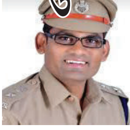
પોલીસે ભાજપના નેતાનો અહમ સંતોષવા આ કૃત્ય કરેલ છે. ત્યારે આ કૃત્ય કરનાર પોલીસ અધિકારીઓ સામે કડક કાર્યવાહી કરવામાં આવે

દુધાતે આકોશ વ્યક્ત કરી મુખ્યમંત્રીને પત્ર પાઠવ્યો છે. પત્રમાં જણાવવાયું છે કે જિલ્લામાં બેકામ દારૂનું વેચાણ, ખનીજ ચોરી થઈ રહી છે. ત્યારે આ ગુનાના આરોપીઓનું સરઘસ કાઢવામાં આવતું નથી. પરંતુ પોતાના માલિકના કહેવાથી પત્ર ટાઈપ કરવા બદલ યુવતીની કાયદાનું ઉલ્લંઘન કરી રાત્રીના ૧૨ વાગે ધરપકડ કરી હતી. યુવતીને મુખ્ય રસ્તા પર ચલાવી