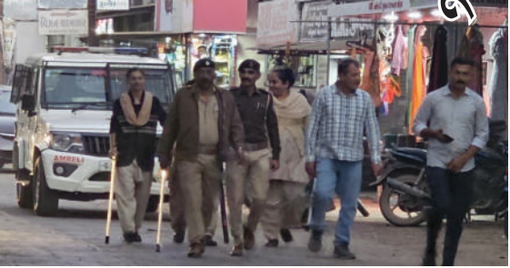
બજાર નીકળીને વાહન ચાલકો, સમસ્યા બાબતે કડક સૂચનાઓ આપી ટ્રાફિક સમસ્યા નિવારણ

અમરેલી જિલ્લાના વડીયા શહેરમાં પોલીસ દ્વારા મુખ્ય બજારમાં પગપાળા પેટ્રોલિંગ કરીને લોકોને ટ્રાફિકની સમસ્યાના નિવારણની સૂચનાઓ આપવામાં આવી હતી. વડીયામાં પી.એસ. આઈ. દવે અને તેમની સમગ્ર ટીમ દ્વારા પગપાળા મુખ્ય