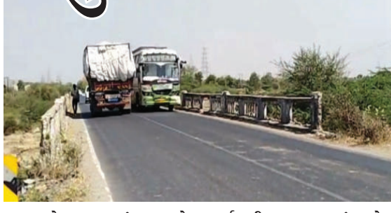
રજૂઆતો કરવા છતાં પણ નવો પુલ બનાવવા અંગેની કોઈ

અમરેલી રાજકોટ હાઈવે પર આવેલ ૪૦ વર્ષથી પુલ જુનો પુલ જર્જરિત હાલતમાં છે. ચોવીસ કલાક વાહનોથી ધમધમતો આ પુલ ગમે ત્યારે ધરાશયી થાય તેમ છે. પુલની રેલીંગ પૂર્ણ તૂટી ગઈ છે અને બચી છે તે પણ અતિ જર્જરિત હાલતમાં છે. આ અંગે સ્થાનિક લોકો દ્વારા અવારનવાર