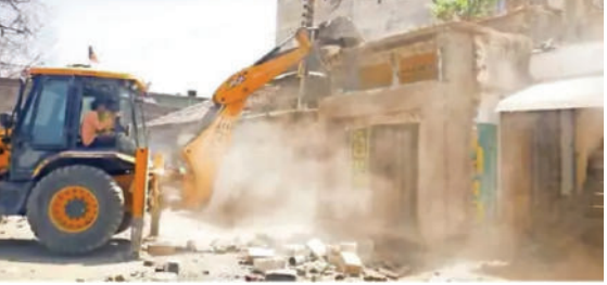
વીજપડી બસ સ્ટેન્ડ વિસ્તારમાં જુની મેડી તેમજ ડેલીબાનું મેડીની સામેની દુકાનો ઉપર તેમજ રાજુલા

સાવરકુંડલા તાલુકાના વીજપડીમાં જુદા જુદા સ્થળે થયેલા દબાણ તંત્ર દ્વારા હટાવવામાં આવ્યા હતા. પોલીસ બંદોબસ્ત સાથે તંત્રએ બજારમાં અનેક સ્થળેથી દબાણ હટાવ્યા હતા. સાવરકુંડલા તાલુકાના વીજપડી ગામે ગ્રામ પંચાયત સત્તાધીશો દ્વારા ડિમોલેશન પ્રક્રિયા હાથ ધરવામાં આવેલ હતી.