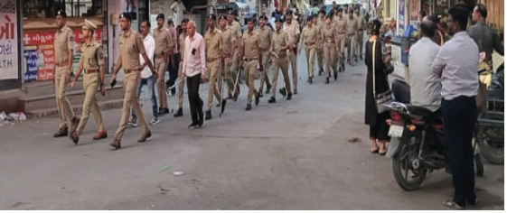
સાથે ઉજવે. સાથે જ, કાયદો અને વ્યવસ્થા જાળવવા માટે પોલીસ તંત્ર દ્વારા યુસ્ત આયોજન કરવામાં આવ્યું છે. પોલીસ તંત્ર દ્વારા શહેરમાં માર્ચ પાસ્ટ અને ફૂટ પેટ્રોલિંગ કરવામાં આવ્યું હતું. સાવરકુંડલા પોલીસ તંત્ર સતત સતર્કતા સાથે પોતાની ફરજ બજાવી રહ્યું છે, જેથી શહેરમાં કાયદો અને વ્યવસ્થા જાળવાઈ રહે.

તહેવારો શાંતિથી ઉજવાય તે માટે પોલીસ તંત્ર ખડેપગે સાવરકુંડલા, તા.૩૦ સાવરકુંડલા શહેરમાં આગામી ધાર્મિક તહેવારો રમજાન ઈદ અને રામનવમી શાંતિ અને સુલેહથી ઉજવાય તે માટે પોલીસ તંત્ર ખડેપગે છે. આ માટે સાવરકુંડલા ટાઉન પોલીસ સ્ટેશનમાં શાંતિ સમિતિની બેઠક યોજાઈ હતી, જેમાં સમાજના તમામ વર્ગના લોકોને તહેવારો શાંતિથી ઉજવવા માટે જાહેર અપીલ કરવામાં આવી હતી. ભારતીય સંસ્કૃતિના જતન માટે જરૂરી છે કે લોકો દરેક ઉત્સવ હર્ષ, ઉલ્લાસ અને ઉમંગ