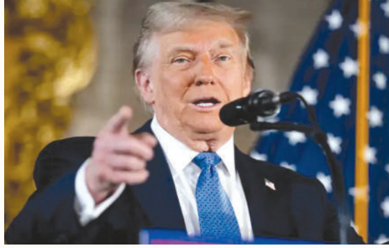
આધારિત એપ્લિકેશન 'કેચ એન્ડ રિવોક' લોન્ચ કરી છે. આ એપ વિદ્યાર્થીઓની સોશિયલ મીડિયા પ્રવૃત્તિઓ પર નજર રાખે છે. જો કોઈ વિદ્યાર્થી હાસ અથવા અન્ય પ્રતિબંધિત સંગઠનોને સમર્થન આપતો જોવા મળે છે, તો તેનો વિઝા રદ કરવામાં આવી રહ્યો છે. નવી વિઝા અરજી પ્રક્રિયા પણ કડક બનાવવામાં આવી છે. વિદ્યાર્થીઓને મોકલવામાં આવેલા ઈમેલમાં કહેવામાં આવ્યું હતું કે, તમારો વિઝા રદ કરવામાં આવ્યો છે. તમારે CBP હોમ એપ દ્વારા યુએસથી પોતાને ખૂદને દેશનિકાલ થવું પડશે. જો વિદ્યાર્થીઓ ગેરકાયદેસર રીતે USમાં રહે છે, તો તેમને દંડ, અટકાયત અથવા બળજબરીથી

નવી દિલ્હી, તા.૩૦ અમેરિકાએ સેંકડો વિદેશી વિદ્યાર્થીઓના F-1 વિઝા રદ કર્યા છે. ડોનાલ્ડ ટ્રમ્પ વહીવટીતંત્રે અમેરિકામાં અભ્યાસ કરતા સેંકડો આંતરરાષ્ટ્રીય વિદ્યાર્થીઓને ઈ-મેઈલ મોકલીને દેશ છોડવાનો આદેશ આપ્યો છે. વિદ્યાર્થીઓના આંદોલનો અને સોશિયલ મીડિયા પર કથિત રાષ્ટ્ર વિરોધી પોસ્ટને કારણે આ કાર્યવાહી કરવામાં આવી છે. ભારતીય વિદ્યાર્થીઓ પણ તેનાથી પ્રભાવિત થયા છે. વિઝા રદ કરવા માટે AI-આધારિત એપ્લિકેશન 'કેચ એન્ડ રિવોક'નો ઉપયોગ થઈ રહ્યો છે. આ નિર્ણય પાછળનું કારણ યુનિવર્સિટી કેમ્પસમાં વિદ્યાર્થીઓની ભાગીદારી જણાવવામાં આવી રહી છે. સરકારે સોશિયલ મીડિયા પર કથિત રાષ્ટ્ર વિરોધી પોસ્ટ શેર કરનારા અથવા લાઈક કરનારા વિદ્યાર્થીઓ સામે પણ કાર્યવાહી કરી છે. તેની અસર ભારતીય વિદ્યાર્થીઓ પર પણ પડી છે. અમેરિકાના વિદેશ સચિવ માર્કો રૂબિયોએ જાહેરાત કરી હતી કે રાષ્ટ્ર વિરોધી પ્રવૃત્તિઓમાં કથિત રીતે સામેલ વિદેશી વિદ્યાર્થીઓના વિઝા રદ કરવામાં આવશે. તેમણે જણાવ્યું હતું કે, અત્યાર સુધીમાં ૩૦૦થી વધુ વિઝા રદ કરવામાં આવ્યા છે. આ પ્રક્રિયા દરરોજ ચાલી રહી છે. દરેક દેશને એ નક્કી કરવાનો અધિકાર છે કે તેના દેશમાં કોણ રહી શકે અને કોણ નહી. યુએસ સરકારે AI