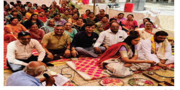
સુરત, અમદાવાદ અને અન્ય શહેરોમાંથી મોટી સંખ્યામાં લોકો

અમરેલી તાલુકાનાં પીઠવાજાળ ગામે ખોડિયાર મંદિર ખાતે દેસાઈ પરિવાર દ્વારા ભવ્ય સપ્તયંત્રી યજ્ઞનું આયોજન કરવામાં આવ્યું હતું. ચૈત્રી નવરાત્રીનાં પ્રથમ દિવસે જ સમસ્ત પરિવારજનોની ઉપસ્થિતિમાં યોજાયેલા કાર્યક્રમમાં